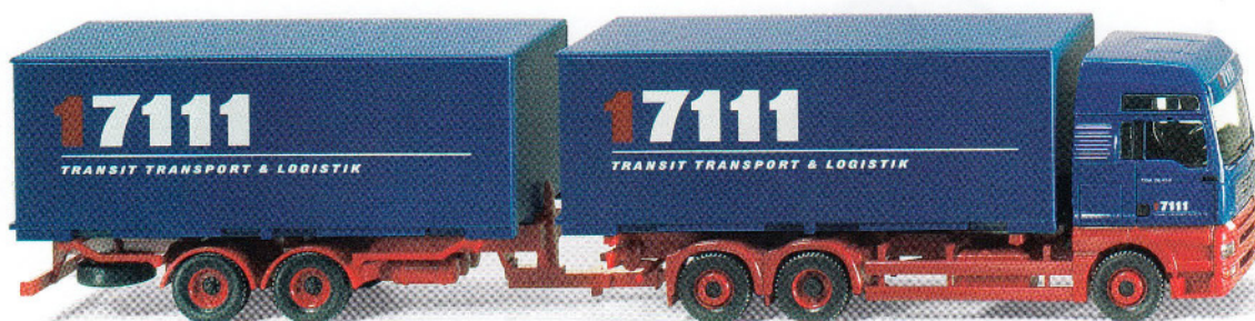
598 03 41 Wechselkoffer-Zentralachshängerzug (MAN TGA XXL)

F ünfzig Jahre bewegte Lkw-Geschichte: Sie liegt zwischen dem legendären Krupp Titan Hängerzug und dem topaktuellen MAN-Zentralachshängerzug. WIKING dokumentiert beide Meilensteine im Rahmen der Modellpflege und stattet den Krupp Titan mit typengerechtem Zierrat aus. Außerdem fahren zwei außergewöhn-