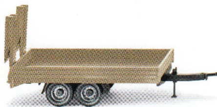
666 02 21 Anhänger für Minibagger