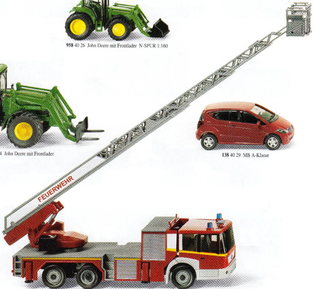
615 40 41 Feuerwehr – DLK 30 PLC (MB Econic)

Verstärkung und Modellaktualität zugleich bedeutet die neue Metz-Drehleiter auf Mercedes-Benz Econic-Fahrgestell, die WIKING mit den Mai-Neuheiten an den Fachhandel ausliefert. Das dreiachsige Einsatzfahrzeug vom Typ DLK 30 PLC erhält als Neuentwicklung eine aufwändige Drehleiterkonstruktion mit