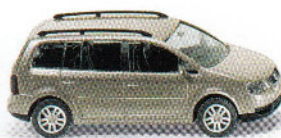
305 02 28 VW Touran