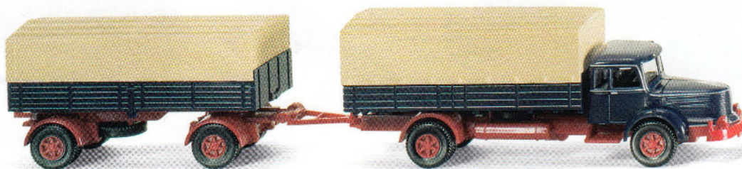
891 02 40 Pritschen-Lastzug (Krupp Titan)