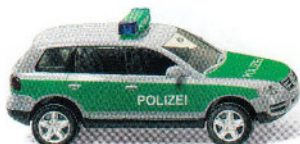
104 25 32 Polizei – VW Touareg