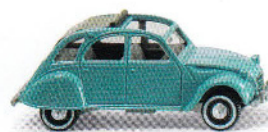
809 07 21 Citroën 2 CV