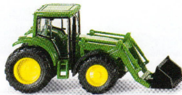
958 40 26 John Deere mit Frontlader N-SPUR 1:160