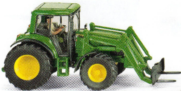
393 40 34 John Deere mit Frontlader