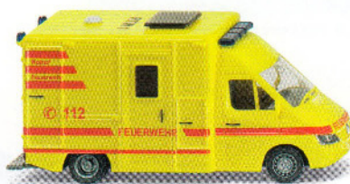
321 02 30 Rettungswagen