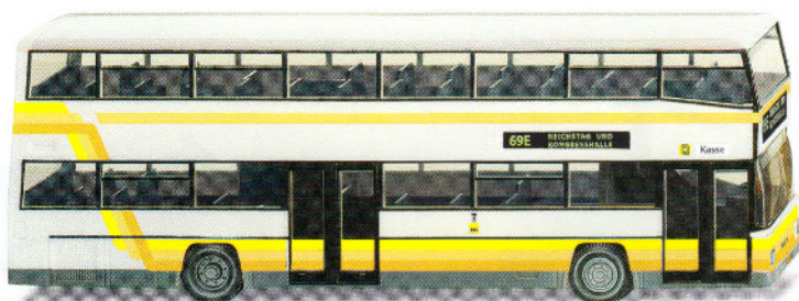
0731 11 40 Doppeldeckbus D 89