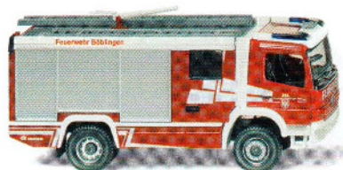
0612 02 41 Feuerwehr – Rosenbauer RLFA 2000 AT