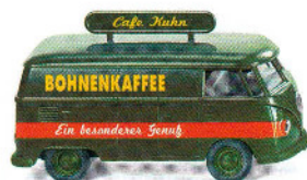
0797 03 30 VW Transporter (T1) mit Dachschild