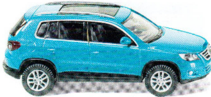
0068 40 30 VW Tiguan mit Glasschiebedach