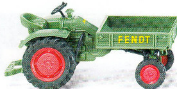
0899 40 25 Fendt Geräteträger