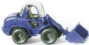
693 08 31 THW - Radlader 280 (Kramer)