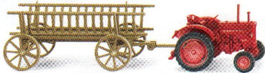
893 01 31 Leiterwagen mit Traktor