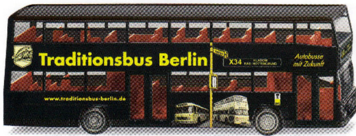
731 08 46 Doppeldeckbus D 89