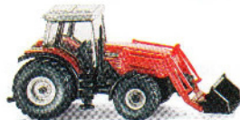
957 40 25 Massey Ferguson mit Frontlader N-SPUR 1:160

Der „T@B“ von Tabbert bedeutet Retro-Styling par excellence! WIKING stellt mit der ersten Jahresauslieferung an den Fachhandel das neu interpretierte Caravan-„Ei“ vor, das 50 Jahre zurück die Wohnwagen-tradition in Europa begründete. Zugleich zieht der Hanomag-Schlepper R16 einen zeitgenössischen Leiterwagen – landwirtschaftlicher Alltag anno dazumal. Im Kontrast dazu der jetzt