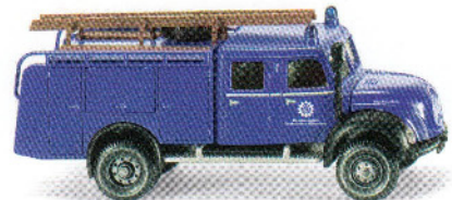
874 01 35 THW - TLF 16 (Magirus)