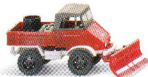
861 07 28 Unimog U 411 mit Schneepflug