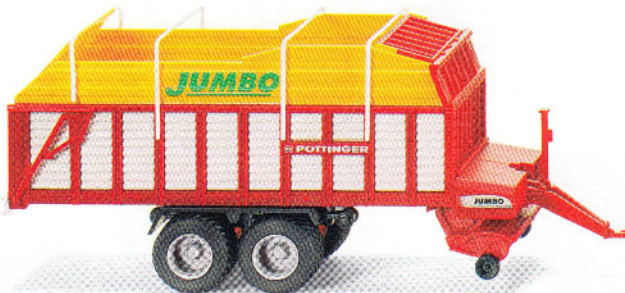
381 40 28 Heuladewagen (Pöttinger)