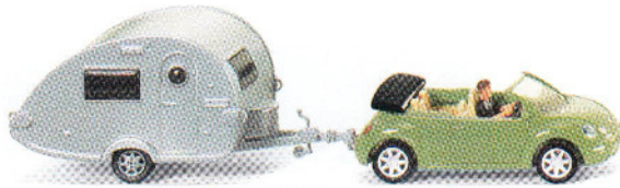
063 40 36 New Beetle Cabrio mit Wohnwagen „T@B“