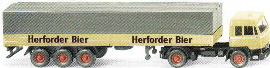
849 40 39 Pritschen-Sattelzug (Büssing BS 16 L)