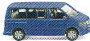
308 02 28 VW Multivan