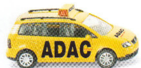
078 07 32 ADAC - VW Touran