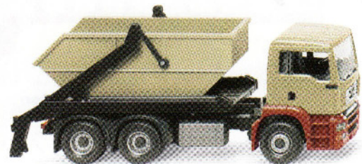
679 03 32 Absetzkipper (MAN TG-A M)

E r gilt als Fahrzeugrarität in der THW-Chronologie: Der blaue Magirus-Rundhauber mit TLF 16-Aufbau, den WIKING in der Januar-Modellpflege vorstellt. Da ist der Kramer-Radlader 280 mit heutiger Einsatzaktualität ein willkommener THW-Kontrast. Natürlich stehen farbenreiche Aktualisierungen im Mittelpunkt der Fachhandelsauslieferung, weil sie jedem Modell eine neue miniaturisierte