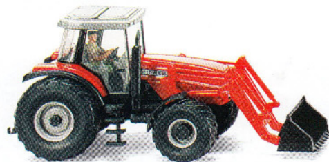
385 40 33 Massey Ferguson MF 8280 mit Frontlader

Der „T@B“ von Tabbert bedeutet Retro-Styling par excellence! WIKING stellt mit der ersten Jahresauslieferung an den Fachhandel das neu interpretierte Caravan-„Ei“ vor, das 50 Jahre zurück die Wohnwagen-tradition in Europa begründete. Zugleich zieht der Hanomag-Schlepper R16 einen zeitgenössischen Leiterwagen – landwirtschaftlicher Alltag anno dazumal. Im Kontrast dazu der jetzt