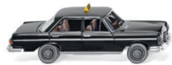
0800 11 Taxi - MB 280 SE