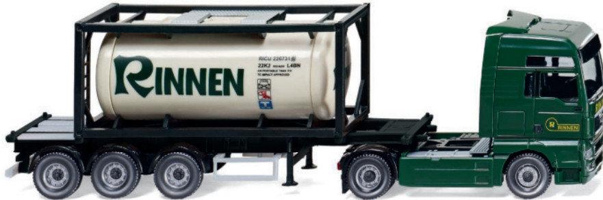
0536 01 Tankcontainersattelzug 20' (MAN TGX)