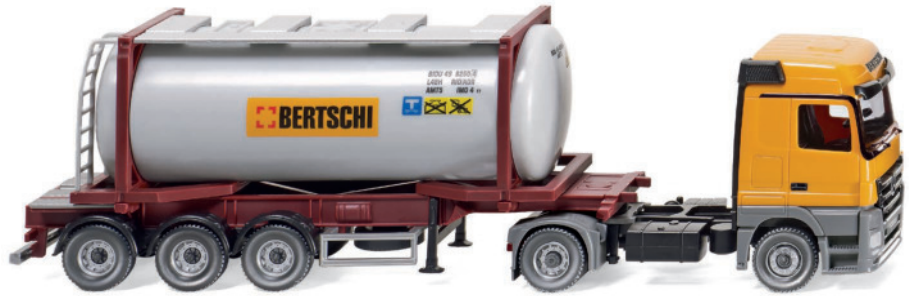
0536 02 Tankcontainersattelzug Swap (MB Actros)