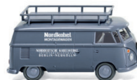
0797 15 VW T1 Kastenwagen