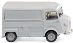
0262 02 Citroën HY Verkaufswagen