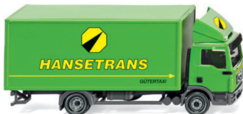
0435 06 Koffer-Lkw (MAN TGL)