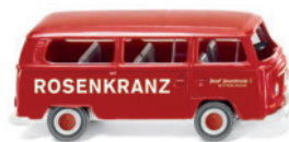
0315 01 VW T2 Bus