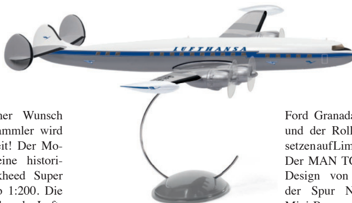
7342 01 Lockheed Super Constellation