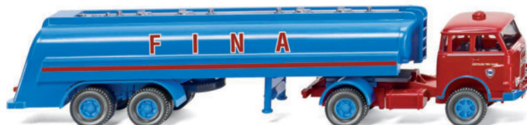
0882 48 Tanksattelzug (MAN Pausbacke)