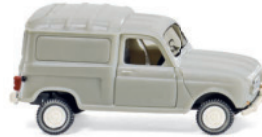
0225 01 Renault R4 Kastenwagen