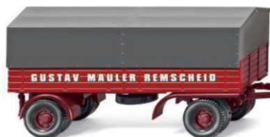
0859 05 Pritschenhängerzug (MB L 6600)