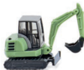
0946 06 Mini-Bagger HR18 (Schaeff) N-Spur 1:160