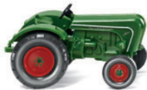
0878 49 Allgaier Schlepper