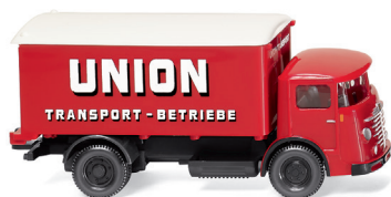
0476 03 Koffer-Lkw (Büssing 4500) Erstaufritt als Koffer-Variante UVP 19 %: 16,99 € / UVP 16 %: 16,56 € · 1953-55