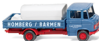
0271 02 Pritschenwagen mit Aufsatztank (MB L 408) Heizöl für Kleinverbraucher UVP 19 %: 16,99 € / UVP 16 %: 16,56 € · 1967-71