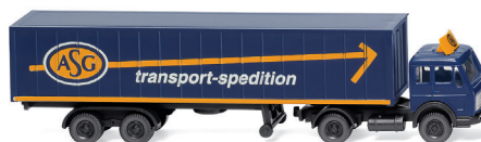
0950 03 Containersattelzug (MB) Spur N 1:160 ASG in Spur N UVP 19 %: 11,99 € / UVP 16 %: 11,69 € · 1989-94