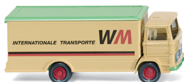
0436 01 Koffer-Lkw (MB LP 1317) UVP 19 %: 12,99 € · Jetzt: UVP 7,99 €