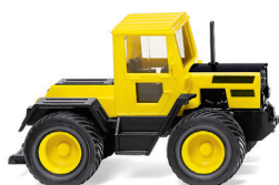
0385 97 MB Trac Allradtechnik aus Gaggenau UVP 19 %: 13,99 € / UVP 16 %: 13,64 € · 1975-80