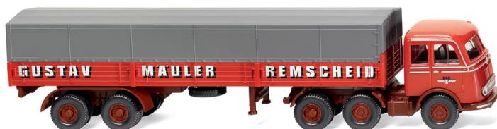
0488 04 Pritschensattelzug (MB LPS 333) Tausendfüßler im Mäuler-Einsatz UVP 19 %: 23,99 € / UVP 16 %: 23,39 € · 1958-61