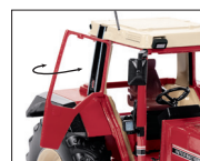
0778 52 IHC 1455 XL Der Kultschlepper im Großformat UVP 19 %: 89,95 € / UVP 16 %: 87,68 €