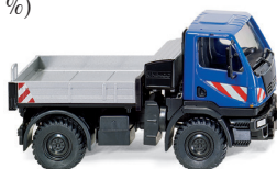
0369 02 Unimog U 20 UVP 19 %: 13,69 € · Jetzt: UVP 8,99 €