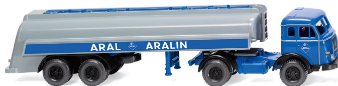
0882 47 Tanksattelzug (Henschel) Typischer Aral-Großtankwagen UVP 19 %: 23,99 € / UVP 16 %: 23,39 € · 1955-61