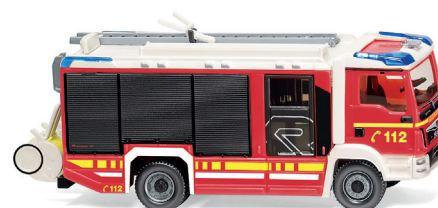
0612 44 Feuerwehr – AT LF (MAN TGM Euro 6/Rosenbauer) Neue Modellkombination des Alleskönners UVP 19 %: 35,99 € / UVP 16 %: 35,08 €