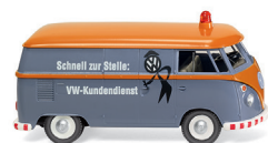
0797 27 VW T1 Kastenwagen Kult-Bulli im Servicedienst UVP 19 %: 18,49 € / UVP 16 %: 18,02 € · 1963-67