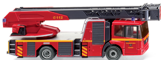
0627 03 Feuerwehr Lübeck – Metz DL 32 (MB Eonic) UVP 19 %: 28,89 € · Jetzt: UVP 19,99 €