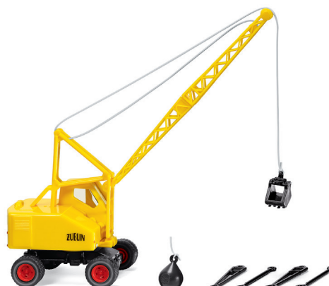
0662 05 Seilbagger (Fuchs F 301) Mit neuer Hochauslegerlagerung UVP 19 %: 23,99 € / UVP 16 %: 23,39 € · 1959-70

Wiking-Modellbau GmbH & Co. KG · Schlittenbacher Str. 60 · 58511 Lüdenscheid · info@wiking.de · www.wiking.de