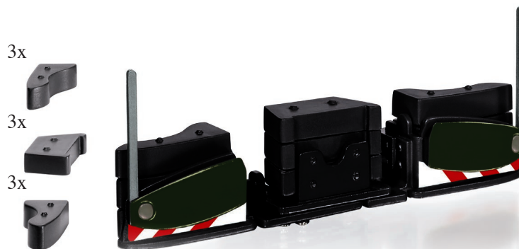
0778 44 AGRIBumper schwarz UVP 19,95 €