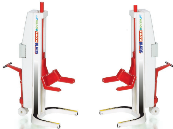
0778 45 Stertil Koni Mobile Hebesäule (Inhalt: 2 Stück) UVP 29,95 €