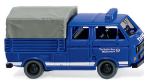
0293 07 THW - VW T3 Doppelkabine UVP 12,99 €