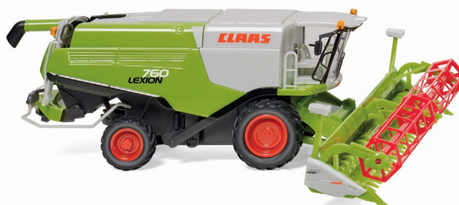
0389 14 Claas Lexion 760 Mährescher mit V 1050 Getreidevorsatz UVP 30,49 €

Modellhistorie aus fünf Jahrzehnten präsentiert WIKING zum Ausklang des Programmjahres 2018: So fahren das VW Karmann Ghia Coupé als "Gelb-Schwarzer Renner", aber auch das Glas Goggomobil sowie der Opel Caravan '57 ins Programm. Dem traditionsreichen Modelltrio der 1950er- und 1960er-Jahre hat WIKING ein aufwändiges Finishing gewidmet – der Opel Freizeitkombi überrascht mit zweifarbiger Flankengestaltung sowie einem zeit-