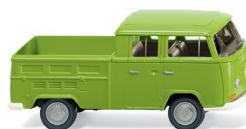
0314 01 VW T2 Doppelkabine UVP 16,99 €