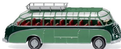
0730 02 Reisebus (Setra S8) UVP 17,99 €