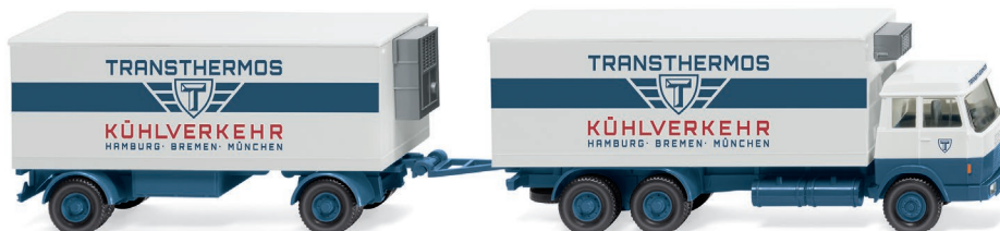
0440 01 Kühlkofferlastzug (Hanomag Henschel) UVP 22,99 €