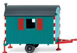
0656 07 Bauwagen UVP 9,99 €