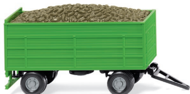
0388 15 Rübenanhänger UVP 7,99 €