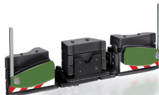
0778 42 AGRIBumper Fendt Design