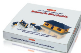
0990 94 Set "ASG" UVP 39,99 €

Als Knautsch-Gesicht hat sich der Tempo Matador in den frühen 1950er-Jahren einen verlässlichen Namen gemacht, als es darum ging, das Wirtschaftswunder in der Bundesrepublik auf rollende Räder zu bringen. Der Hamburger Transporter galt als Allrounder und war seinerzeit ein willkommener Helfer im Verkehrsalltag. WIKING miniaturisiert den legendären Matador dank völlig neuer Formen mit hoher Filigranität und hilft damit der Dezember-Auslieferung zu facettenreicher Transporter-Attraktivität. Hinzu kommen als Doppelkabinen der VW T2 ebenso wie der VW T3 in den Farben des THW. Aber auch der