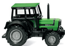
0386 02 Deutz-Fahr DX 4.70 UVP 9,99 €