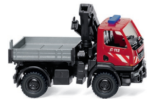
0601 31 Feuerwehr – Unimog U 20 mit Ladekran UVP 19,99 €