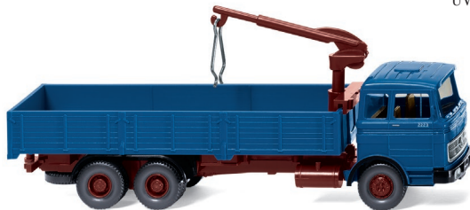
0433 07 Hochbordpritschen-Lkw (MB LP 2223) UVP 14,99 €