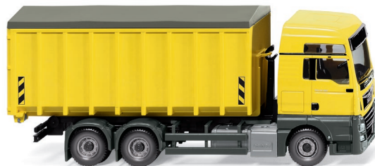
0672 05 Abrollcontainer (MAN TGX EURO 6c/Meiller) UVP 28,99 €