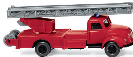
0620 02 Feuerwehr – Drehleiter (Magirus S 3500) UVP 13,99 €