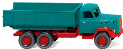
0645 03 Schuttwagen (Magirus) UVP 13,99 €