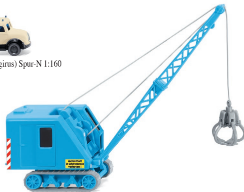
0661 49 Raupenkran (Krupp Ardel) UVP 15,99 €