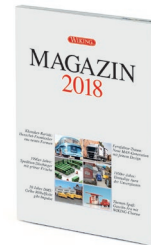
0006 25 WIKING-MAGAZIN 2018 UVP 11,00 €

Der legendäre italienische Roadster hat sein WIKING-Denkmal erhalten! Beim Alfa Spider, aus der Feder des Kultdesigners Pininfarina, hat sich WIKING bei der Konstruktion des italienischen Klassikers ganz bewusst der neuen Formensprache verschrieben – die Details sind filigran nachgebildet. Außerdem stellen die Traditionsmodellbauer den BMW 2002 im Dienst des Freistaates vor, der nach zeitgenössischem Vorbild der bayerischen Polizei gestaltet ist. Darüber hinaus debütieren der Mercedes-Benz LP 2223 als Hochbordpritschen-Lkw