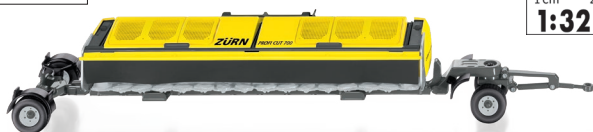
0778 38 Zürn Direktschneidwerk Profi Cut 700 mit Wagen UVP 74,95 €