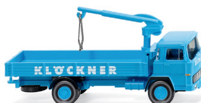
0423 01 Pritschen-Lkw (Magirus 100 D7) UVP 14,99 €