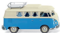
0797 33 VW T1 Campingbus UVP 15,49 €