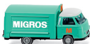
0279 01 Verkaufswagen (Borgward) UVP 13,99 €