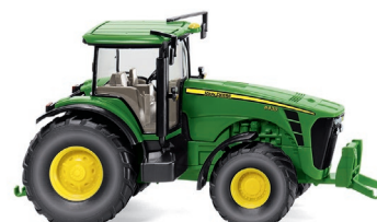
0391 02 John Deere 8430 UVP 12,99 €