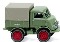
0368 02 Unimog U 401 UVP 17,49 €