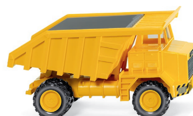
0866 02 Muldenkipper (Kaelble KV 34) UVP 17,99 €

Er ist der mächtigste John Deere, den WIKING bislang in den Maßstab 1:87 miniaturisierte: Der John Deere 8430 hat sich als leistungsstarker Schlepper in der Großlandwirtschaft einen blitzsauberen Ruf erworben – das zugehörige Modell wirkt allein wegen seiner Dimension imposant. Im Kontrast dazu tritt der MAN 4R3 der bäuerlichen Wirtschaftswunderjahre bescheiden auf. Ihm stellt WIKING epochengerecht den Mercedes-Benz 180 – erstmalig mit Interieur – als Brandmeister-Pkw zur Seite. Der VW Käfer 1200 mit offenem Faltdach unter der