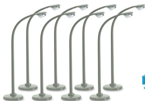
0018 21 Zubehörpackung – Straßenbeleuchtung (Inhalt: 16 Stück) UVP 12,49 €