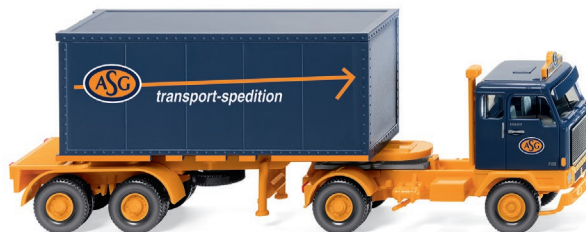
0526 02 Containersattelzug 20' (Volvo F89) UVP 21,49 €