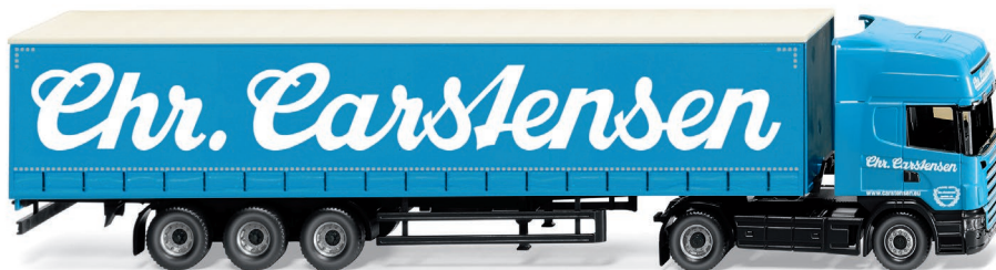
0537 09 Gardinenplanensattelzug (Scania R420 Topline) UVP 29,99 €

Die facettenreiche Welt der Miniaturen aus sechs Jahrzehnten – WIKING hält sie lebendig! Das Froschauge debütiert mit Plane ebenso wie der VW T1 als Campingbus mit zeitgenössisch typischem Dachgepäckträger. Modellfreude bereitet das Tieflader-Gespann nach Bölling-Vorbild der 1980er-Jahre ebenso viel wie der Saviem-Koffersattelzug der Straßburger Brauerei