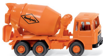
0682 04 Betonmischer (MAN) UVP 13,49 €