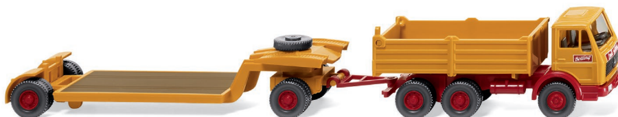
0492 01 Tiefdehängerzug (MB NG) UVP 18,99 €