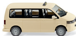
0308 08 Taxi – VW T5 GP Multivan UVP 15,49 €