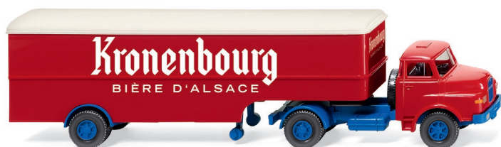
0513 22 Koffersattelzug (Saviem) UVP 19,99 €