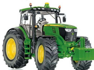
0778 36 John Deere 6250R UVP 79,95 €