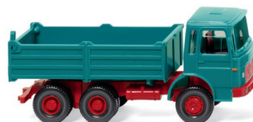
0673 07 Hochbordkipper (MAN) UVP 14,99 €