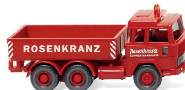
0509 01 Schwerlastzugmaschine (Magirus) UVP 13,99 €