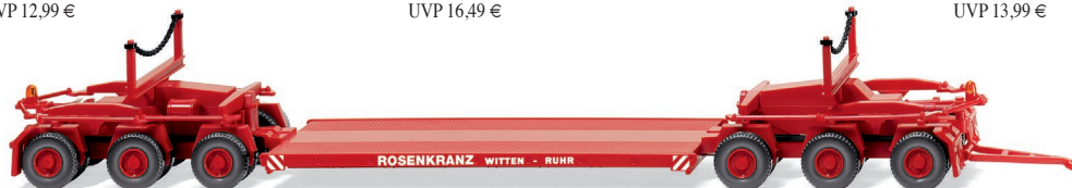
0851 33 Tiefladeanhänger (Scheuerle) UVP 17,99 €