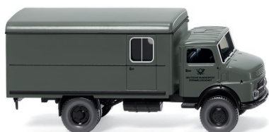
0852 38 Fernmeldedienst – Koffer-Lkw (MB Kurzhauber) UVP 14,99 €