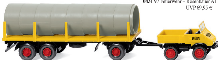
0392 05 Unimog U 411 mit Rungenanhänger UVP 20,99 €