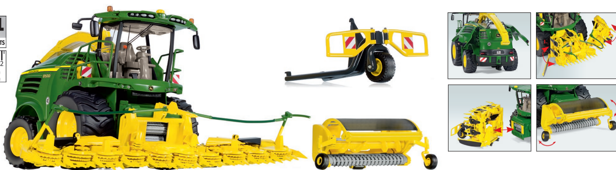
0778 32 John Deere Feldhäcksler 8500i UVP 179,95 €