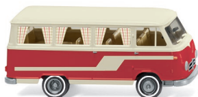
0270 45 Borgward Campingbus B611 UVP 12,99 €