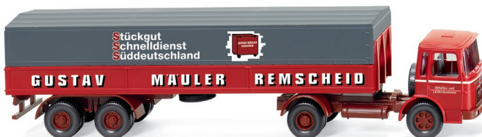
0515 02 Pritschensattelzug (MAN) UVP 20,49 €