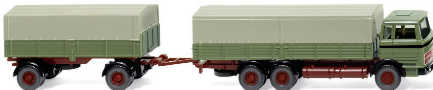
0433 06 Pritschenhängerzug (MB) UVP 19,99 €