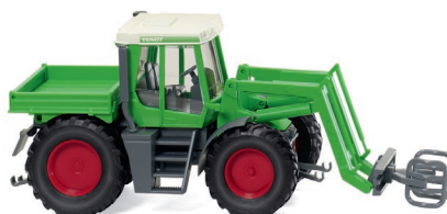
0380 03 Fendt Xylon mit Ballengreifer UVP 16,49 €