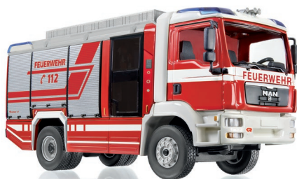
0431 97 Feuerwehr – Rosenbauer AT LF (MAN TGM) UVP 69,95 €