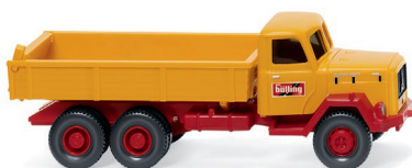
0424 04 Pritschenkipper (Magirus) UVP 13,99 €