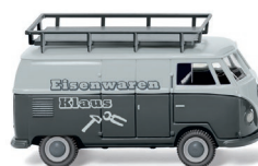
0788 03 VW T1 (Typ 2) Kastenwagen UVP 16,99 €