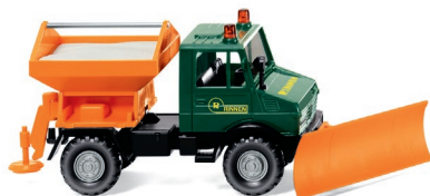
0646 08 Winterdienst – Unimog U 1300 UVP 12,99 €