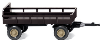
0869 03 Landwirtschaftlicher Anhänger UVP 6,99 €