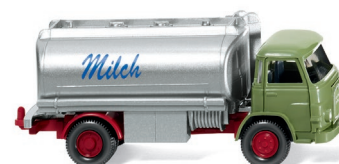
0807 48 Milchwagen (MAN 415) UVP 13,99 €

WIKING lässt die neue Generation der MB E-Klasse als Version mit geschlossenem Dach Premiere feiern. Genauso debütieren der Volvo Amazon als Viertürer und der legendäre VW 411 als Feuerwehr-Einsatzleitwagen. Eine aufwendige Neuentwicklung stellt WIKING mit dem multifunktionalen Fuchs Seilbagger F 301 vor, der dank seiner vielseitigen Beweglichkeit alle Werte seines Vorbilds in den Maßstab 1:87 trägt. Als weitere Klassiker erscheinen der MAN 415 als Milchwagen, der Langholztransporter mit Magirus S 3500