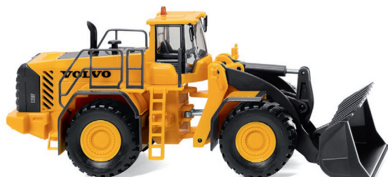
0652 02 Radlader (Volvo L 350F) UVP 29,99 €