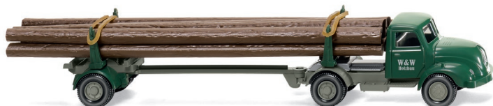
0390 10 Langholztransporter (Magirus S 3500) UVP 16,99 €