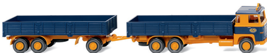
0433 04 Pritschenhängerzug (Scania 111) UVP 20,99 €