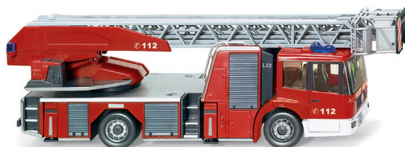
0627 04 Feuerwehr – Metz DL 32 (MB Econic) UVP 32,99 €

Aktualität auf allen 1:87-Baustellen: WIKING lässt den imposanten Volvo Radlader L 350F, aber auch den Atlas-Mobilbagger 2205 M ins Programm fahren. Beide Spezialisten erreichen durch vollfunktionale Ladebewegungen ein hohes Maß an modellbauerischer Vorbild-authentizität. Außerdem können sich Feuerwehrfreunde über die Metz-Drehleiter DL 32 freuen, die auf dem Niederflurfahrgestell des Mercedes-Benz Econic für jeden Rettungseinsatz gerüstet ist. Für den Winterdienst auf dem Speditionsgelände des Logistikers