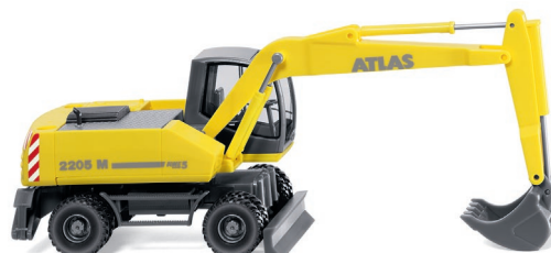
0661 03 Mobilbagger (Atlas 2205 M) UVP 17,99 €