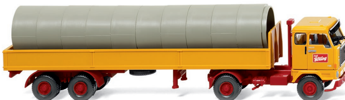
0515 01 Alupritschensattelzug (Volvo F88) UVP 21,49 €