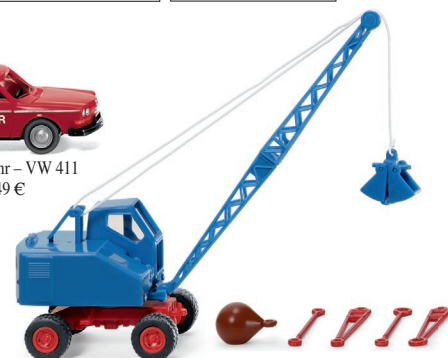
0662 01 Seilbagger (Fuchs F 301) UVP 22,99 €