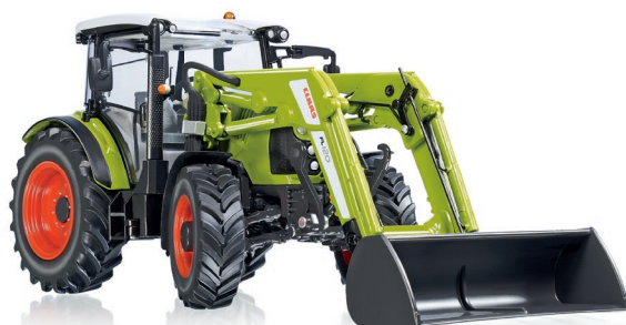
0778 29 Claas Arion 430 mit Frontlader 120 UVP 74,95 €