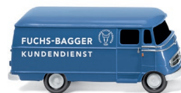
0265 03 Kastenwagen (MB L 319) UVP 10,99 €