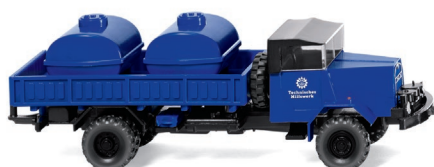
0693 28 THW – Behelfstankwagen (MAN) UVP 13,99 €