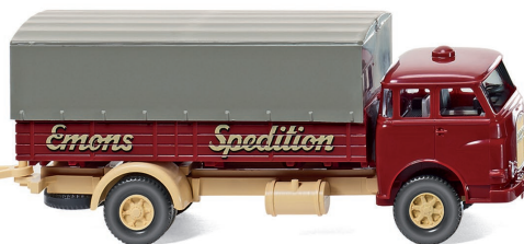
0416 03 Pritschenhängerzug (MAN Pausbacke) UVP 20,99 €