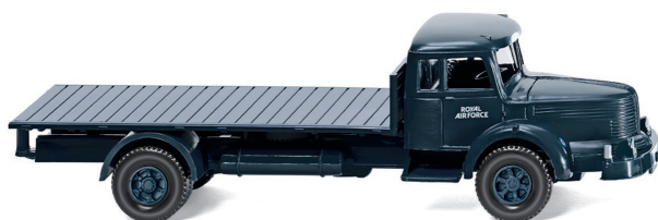
0480 04 Flachpritschen-Lkw (Krupp Titan) UVP 13,99 €