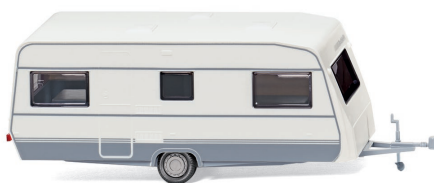
0092 03 Wohnwagen (Dethleffs 530) UVP 10,99 €