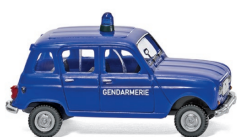
0224 04 Gendarmerie - Renault R4 UVP 11,99 €