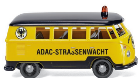
0797 19 ADAC - VW T1 Bus UVP 15,99 €