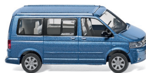
0273 40 VW T5 GP California UVP 17,99 €