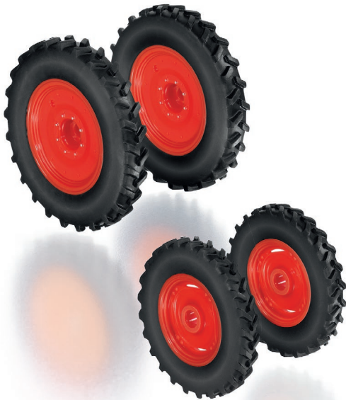
0773 95 Rädersatz Pflegebereifung für Claas Arion Baureihe 400 · UVP 19,95 €

D er Claas Arion der 400er-Baureihe ist geradezu prädestiniert für den Einsatz der Pflegebereifung. Die von WIKING bereitgestellten Reifen sind deutlich schmaler und können den kompakten Schlepper im Pflanzenschutz und in Sonderkulturen