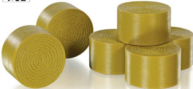
0773 93 Rundballen, 6 Stück - Ø 54 mm · UVP 9,95 €

Schon vor Jahrzehnten begann der Siegeszug der Rundballen auf europäischen Feldern. Sie ließen sich ohne händischen Kraftaufwand mit dem Frontlader zum Transport beladen. Gerade auf dem Hof genügt immer noch ein kompakter Schlepper mit Hubwerk und einem einfachen Ballenheber, um einen Rundballen zu bewegen. Auf kurzen Wegen können die runden ca. 130 Kilogramm