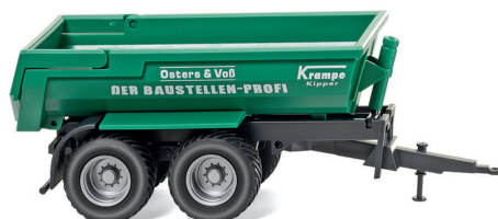
0388 14 Krampe Halfpipe Muldenkipper UVP 10,49 €