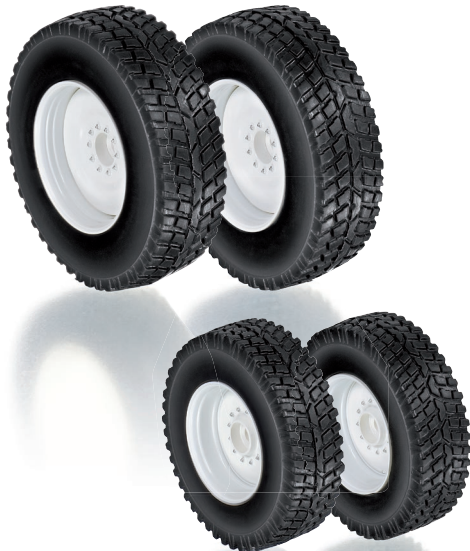
0773 96 Rädersatz Kommunalbereifung für Valtra Baureihe T4 · UVP 19,95 €

G erade im Alltagseinsatz, vornehmlich auf Straßen und befestigten Wegen, kann die Valtra Baureihe T4 vorbildgerecht mit Kommunalbereifung bestückt werden. Damit entspricht die Ausrüstung der Einsatzrüstung von kommunalen Bauhöfen,