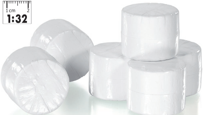
0773 92 Rundballen in Silagefolie, 6 Stück - Ø 35 mm · UVP 9,95 €

Heute gehören sie zum Alltagsbild auf den Höfen: Ballensilage wird zunehmend beliebter und hat sich in der Milchproduktion schon einen festen Platz erobert. Gepresste und mehrlagig folierte Ballen gelten heute als solides Verfahren, mit dem sich hochwertiges Gärfutter ohne große Verluste produzieren lässt. Bereits bei der Ernte werden die Ballen gepresst und im zweiten Arbeitsgang mit Folie mehrfach fest umgewickelt. Unerlässlich ist zum Heben und Lagern ein Rundballengreifer, der die folierten Ballen nicht beschädigt.