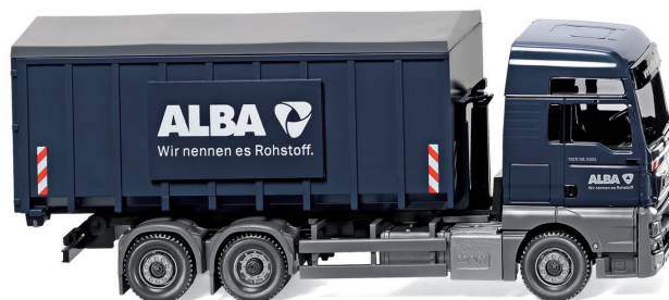
0672 04 Abrollcontainer (Meiller/MAN TGX Euro 6) UVP 29,99 €