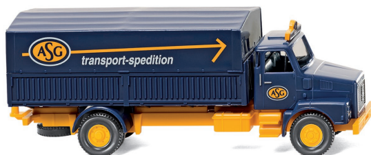
0462 01 Stahlpritschen-Lkw (Volvo N 10) UVP 15,99 €