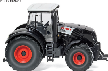
0363 02 Claas Axion 850 UVP 14,49 €

W IKING-Traditionsthemen aktualisieren im August die Modellpflege: Die schwedische Spedition ASG schwörte einst auf den Volvo N 10 Stahlpritschen-Lkw, den WIKING in den 1970er-Jahren bevorzugt für den dortigen Heimatmarkt miniaturisierte und jetzt in den unverwechselbaren Farben vorstellt. Die beliebte MAN Pausbacke ergänzt in den Farben der bekannten Spedition Emons das Lkw-Spektrum. Weil einst der Fuhrpark des