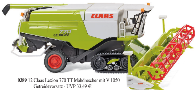
0389 12 Claas Lexion 770 TT Mährescher mit V 1050 Getreidevorsatz · UVP 33,49 €