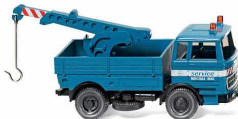
0634 03 Abschleppwagen (MB 1620) UVP 14,99 €