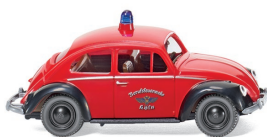
0861 37 Feuerwehr - VW Käfer 1200 UVP 12,99 €