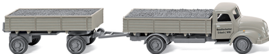
0420 01 Pritschenhängerzug (Magirus S 3500) UVP 15,99 €

Bei WIKING beginnt die Erntezeit mit dem topaktuellen Claas Lexion 770 TT mit V 1050 Getreidevorsatz – eine imposante Landmaschine mit hohem Präzisionsanspruch. Besonders bemerkenswert ist das funktionsfähige Raupenlaufwerk, das die Traditionsmodellbauer erstmals im Landmaschinenbereich miniaturisieren und damit die Geländegängigkeit einer neuen Mährescher-Generation vorstellen. Das aktuelle Alltagsstraßenbild zeigen der VW T5 GP California und der