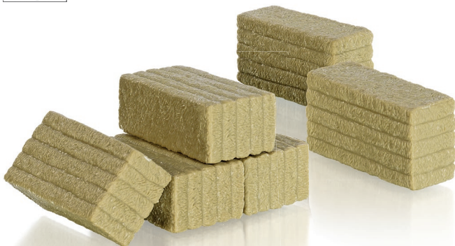
0773 94 Quaderballen, 6 Stück - 66 x 35 x 25 mm · UVP 9,95 €

Ihre Form ist zugleich der Garant für ihren Einsatzvorteil: Die optimale Lager- und Stapelfähigkeit beschert dem Quaderballen wachsende Akzeptanz in der Landwirtschaft. Dabei schwören immer mehr Landwirte auf das einfache Zangenhandling der Quader, die vorher sehr trocken und dicht gepresst werden. Bei WIKING steht die Kuhn Großpacken-