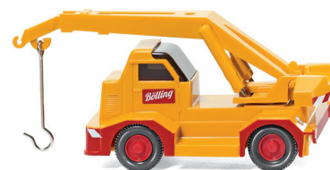
0680 02 Mobilkran (Demag) UVP 11,49 €