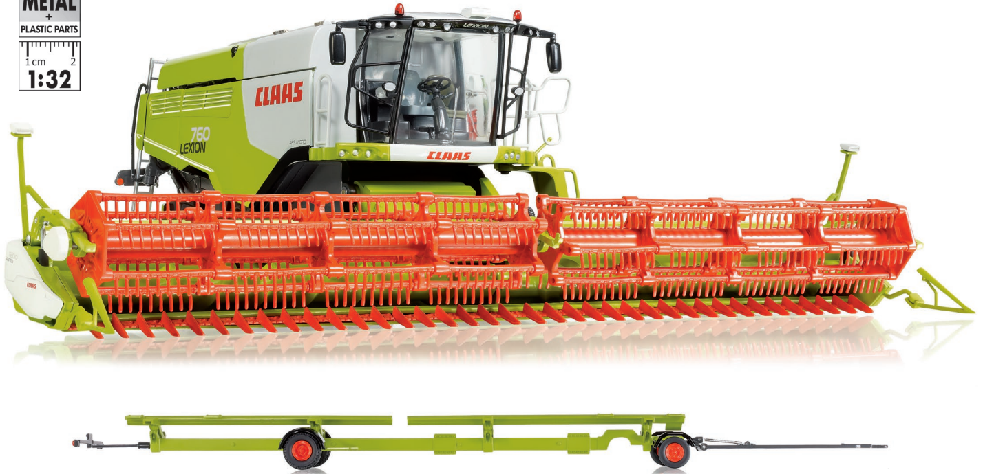
0778 24 Claas Lexion 760 TT Mähdrescher mit V 1200 Getreidevorsatz · UVP 139,95 €

Neueste Technik in 1:32 – bei WIKING erhält erstmals ein Mähdrescher ein voll funktionsfähiges Raupenlaufwerk! Die Modellbauer miniaturisieren den Claas Lexion Mähdrescher 760 TT mit dem in Breite und Ausführung imposanten Schneidwerk V 1200. Die mächtige 1:32-Miniatur verfügt über die vom Lexion 770 bekannte Funktionalität, die dieses Modell genauso unverwechselbar macht wie sein Vorbild. WIKING setzt mit dem Claas Lexion 760 TT einen Mähdrescher im Maßstab 1:32 um, der sich mit dem Original hinsichtlich Funktionalität und Detailtreue messen kann. Das vorangestellte, abnehmbare Hochleistungs-Schneidwerk V 1200 verfügt über eine höhenverstellbare Haspel mit pendelnd gelagerten Zinken und kann mittels beigefügtem Schneidwerkwagen zum nächsten Erntefeld transportiert werden. Zahlreiche vorbildgerechte Details, wie die zu öffnende Motor- und Lüftungsclappen und der horizontal-schwenkbare Strohhäcksler, überzeugen den Betrachter auf Anhieb. Hinzu kommt die raffinierte Öffnungsmechanik des Korntanks, der in Wirklichkeit bis zu 12.500 Liter Getreide bunkern kann, so dass die innenliegende, „schwimmende“ Schnecke sicht-