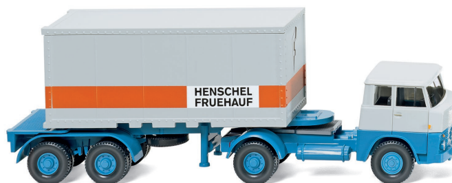
0526 01 Containersattelzug 20' (Henschel HS 14/16) UVP 18,99 €