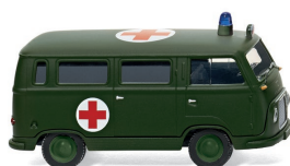
0695 08 Bundeswehr - Ford FK 1000 Bus UVP 11,99 €