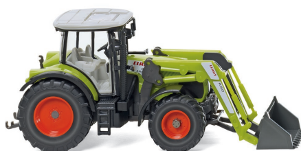
0363 11 Claas Arion 630 mit Frontlader 150 UVP 15,99 €