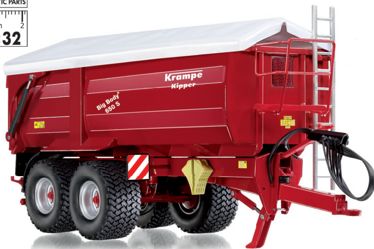
0773 35 Krampe Big Body 650 S Hinter- / Seitenkipper · UVP 64,95 €

S o versprüht das Ladewunder Maßstabsfaszination: Der Krampe Big Body 650 S entfaltet auch als Präzisionsminiatur seine alltagstaugliche Spezialistenfunktion. Der Anhänger verfügt über eine präzise Seitenkippfunktion, die die Mulde im vorbildgerechten Winkel anhebt. Zwei zusätzliche Klappen an der linken Seite lassen sich öffnen, um das Ladegut zielsicher an seinem vorgesehenen Ablageplatz zu positionieren. Durch Stifte am Fahrgestell lässt sich die Kippfunktion auch auf die rückwärtige Entladungsfunktion umstellen. Außerdem ist die Deichsel höhenverstellbar, der Stützfuß beweglich, die Leiter abnehmbar und in verschiedenen Höhen positionierbar. Die hintere Achse wird lenkbar ausgeführt.