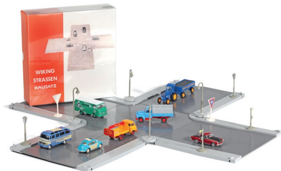
1199 01 Strassen Bausatz (ohne Modelle/Zubehör) UVP 19,99 €