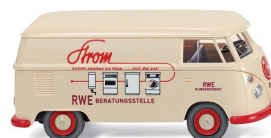
0797 17 VW T1 Kastenwagen UVP 13,99 €