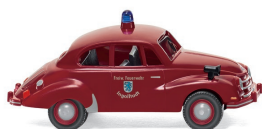
0861 35 Feuerwehr - DKW F 89 UVP 12,99 €