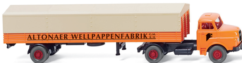
0514 03 Pritschensattelzug (MAN) UVP 19,99 €