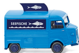
0262 05 Citroën HY Verkaufswagen UVP 11,99 €