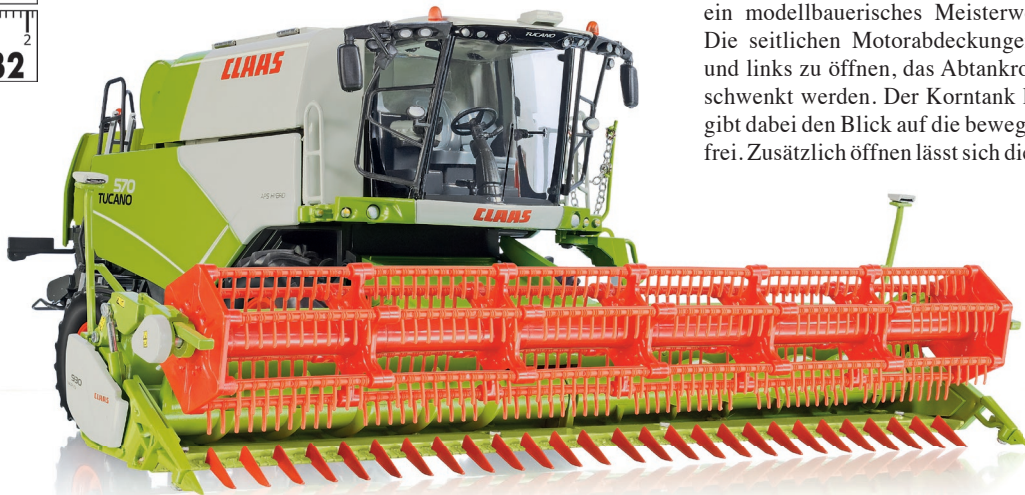
0778 17 Claas Tucano 570 Mährescher mit Getreidevorsatz V 930 · UVP 159,95 €

W IKING-Premiere für eine neue Claas Mährescher-Generation: Mit dem Tucano 570 mit Getreidevorsatz und Schneidwerkwagen debütiert ein modellbauerisches Meisterwerk voller Funktionalität. Die seitlichen Motorabdeckungen am Aufbau sind rechts und links zu öffnen, das Abtankrohr kann radiusgerecht geschwenkt werden. Der Korntank lässt sich oben öffnen und gibt dabei den Blick auf die bewegliche Schnecke im Inneren frei. Zusätzlich öffnen lässt sich die hintere Motorabdeckung, das Luftansauggitter ist drehbar. Das gesamte Mähreschermodell erhält höchste Mobilität durch die pendelnd aufgehängte Hinterachse. Außerdem macht die volltransparente Kabine den Arbeitsplatz in allen seinen Details erlebbar.