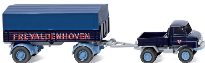
0371 04 Unimog U 411 mit Anhänger UVP 18,49 €