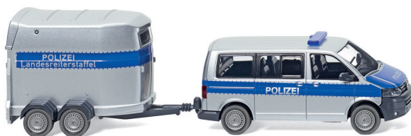
0308 07 Polizei – VW T5 GP Multivan mit Pferdeanhänger UVP 25,99 €