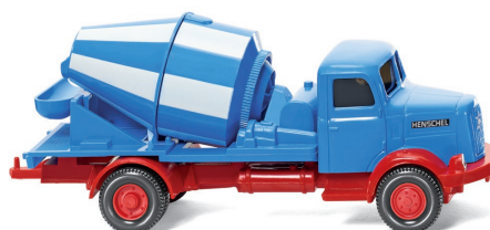
0532 01 Betonmischer (Henschel HS 100) UVP 13,49 €