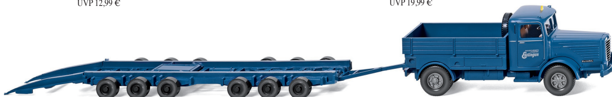
0590 01 Straßenroller Culemeyer (Büssing 8000) UVP 18,99 €