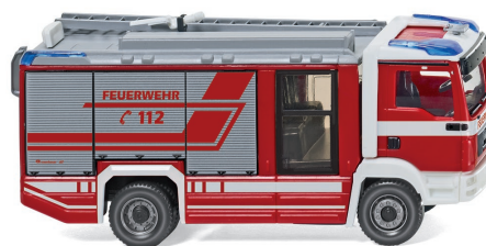
0612 47 Feuerwehr – Rosenbauer AT LF (MAN TGM) UVP 24,99 €

So träumen 1:87-Freunde vom modellbauerischen Frühling: Mit der WIKING-Modellpflege fährt der bildschöne Glas 1700 GT Cabrio ins Programm, der an die späten Produktionsjahre der Dingolfinger Hans Glas GmbH erinnert. Dennoch konnte auch die Eleganz der Vorbildkarosserie aus der italienischen Designerfeder von Frua die Übernahme durch BMW nicht verhindern. In den traditionellen Farben der Spedition Freyaldenhoven präsentiert sich der Unimog U 411, der wie einst sein Vorbild auf dem Firmenhof einen Anhänger zieht und damit