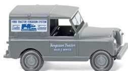
0100 03 Land Rover UVP 10,49 €