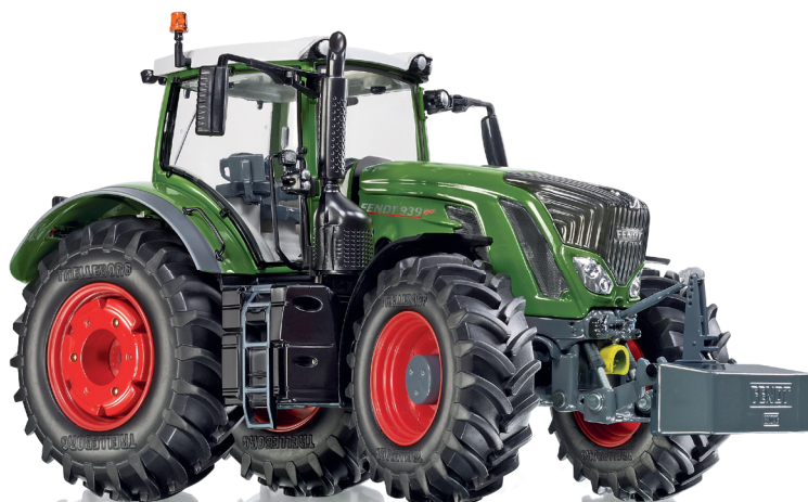
0773 43 Fendt 939 Vario (2014)

Der Fendt 939 Vario steht für Design, Ästhetik und modellbauerisches Detailvergnügen – WIKING bringt es im 1:32-Modell auf den Punkt! Die Traditionsmodellbauer miniaturisieren den Top-Schlepper, dessen Vorbild auf vielen großlandwirtschaftlichen Höfen Einzug halten wird. Der Fendt 939 Vario ist das Flaggschiff aus Marktoberdorf und durch seine extreme Leistungsstärke für die ganz schweren Arbeiten auf dem Acker bestens geeignet. WIKING legt größten Wert auf eine detailfeine Gestaltung von Kabine und Interieur. Gleiches gilt für die Gestaltung von Motor und Haube.