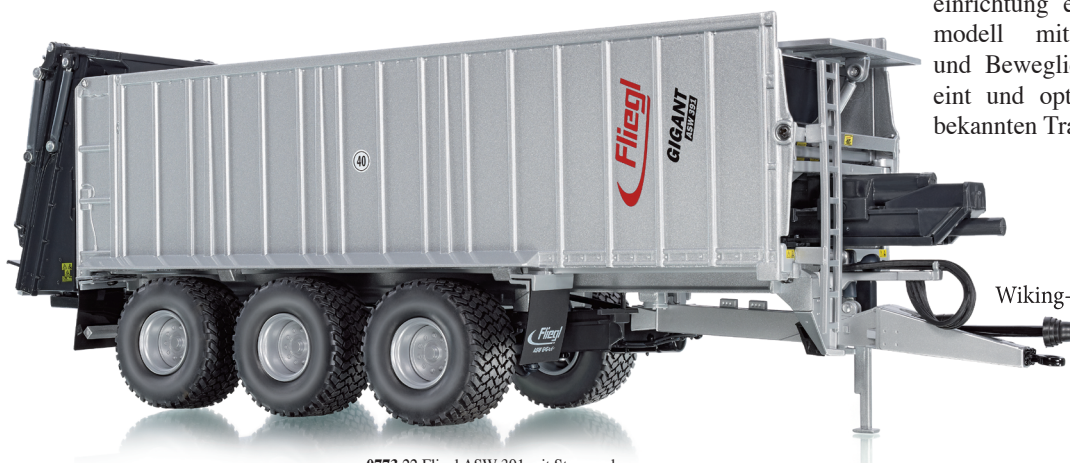
0773 22 Fliegl ASW 391 mit Streuwerk

Der voll funktionsfähige Fliegl Abschiebewagen Gigant ASW 391 erhält eine Zusatzfunktion! Gerade in der Großlandwirtschaft hat die heckseitige Streueinrichtung für das Ladegut deutlich an Bedeutung gewonnen. WIKING miniaturisiert die Streueinrichtung ebenso wie das Gesamtmodell mit hoher Funktionalität und Beweglichkeit. Das Vorbild vereint und optimiert die Vorteile aller bekannten Transportsysteme.