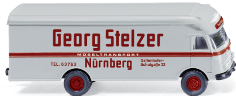
0500 01 Möbelwagen (Ackermann)