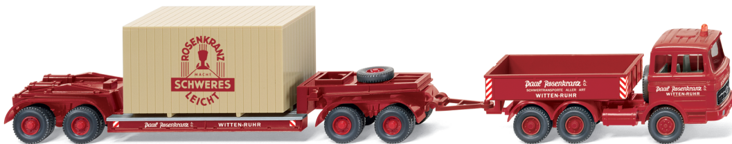
0504 01 Schwerlastzug (MB LP 2223)