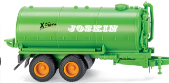
0382 39 Vakuumfasswagen (Joskin)