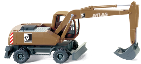
0661 02 Mobilbagger (Atlas 2205M)