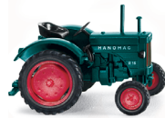
0885 04 Hanomag R16