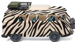
0797 09 VW T1 Campingbus „Safari“