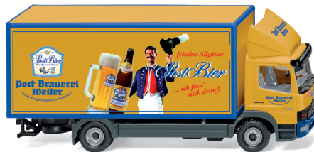
0435 05 Koffer-Lkw (MB Atego)