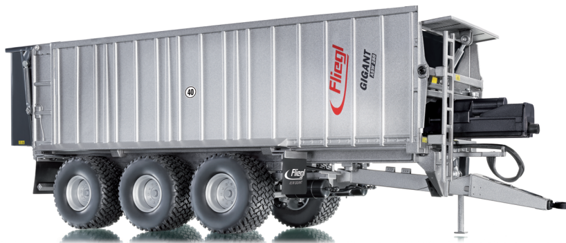
0773 13 Fliegl Abschiebewagen ASW288