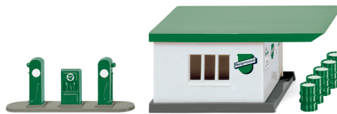
Bestandteile Set 0990 77 „Historische Tankstelle“