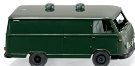
0270 48 Borgward Kastenwagen B611