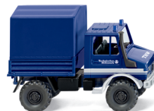
0693 16 THW - Unimog U 1700 mit Plane