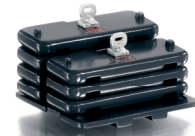
0773 80 Ballastgewichte für Claas Xerion