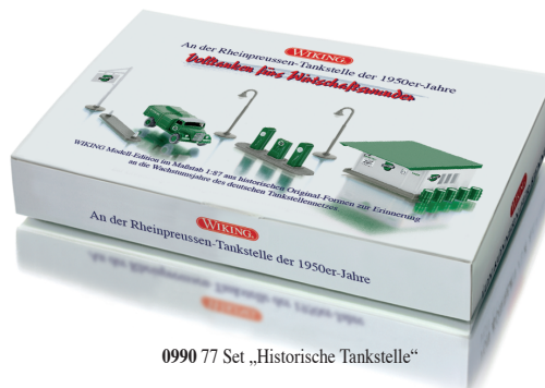
0990 77 Set „Historische Tankstelle“

Liebe zu Raritäten wird belohnt: Mit einem Klassiker-Set aus historischen Formen lässt WIKING die 1950er-Jahre lebendig werden, als die heute längst vergessene Treibstoffmarke „Rheinpreussen“ vor allem im Ruhr-Revier zum Straßenbild gehörte. Opel Blitz-Tankwagen, aber auch die typisch grün-weißen Zapfsäulen und das legendäre „Haus zur Tankstelle“ finden damit den Weg in Liebhaberhände. Ölfässer, Bogenlampe und Verkehrsinsel hält das Set ebenfalls bereit – die authentische WIKING-Ausstattung für eine zeitgenössische Szenerie. Außer-