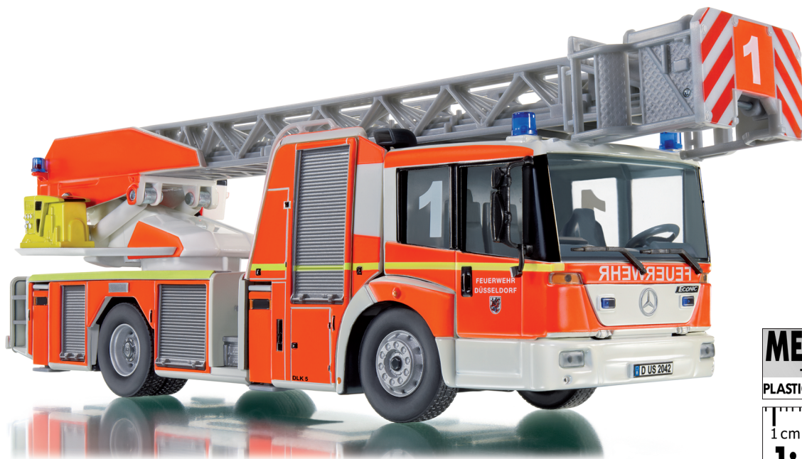
0431 02 Feuerwehr - DL 32 (MB Eonic)