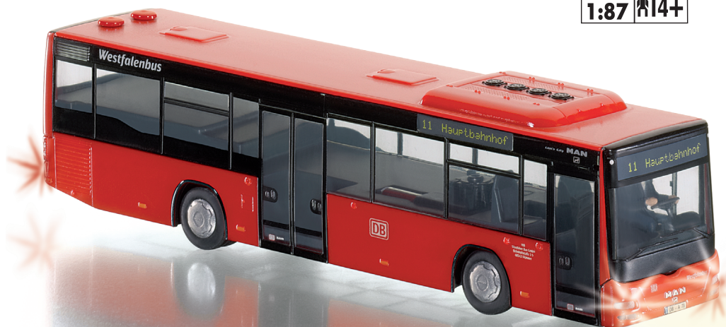
0774 26 MAN Lion's City A78 - DB UVP 179,95 €

WIKING CONTROL 87 macht erneut mobil: Der MAN Lion's City ergänzt als neue 1:87-Miniatur mit Hightech an Bord das modellbauerische Spielsystem – die faszinierende Fernsteuerung mit maßstabspräziser Lenkbewe-