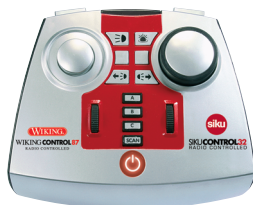
0774 10 Fernbedienung UVP 44,99 €