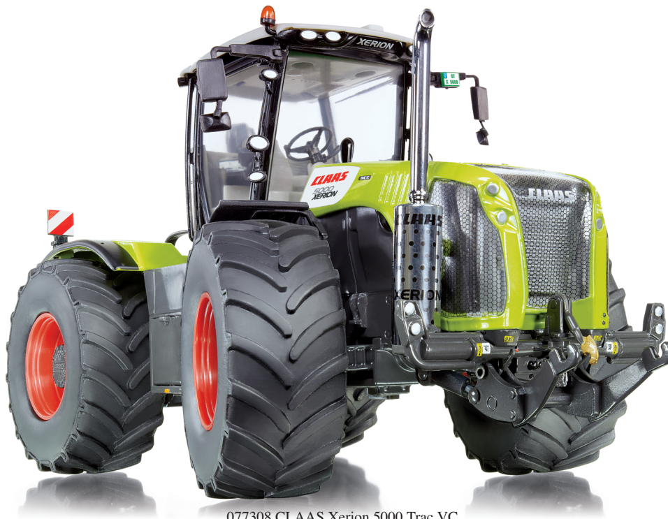
077308 CLAAS Xerion 5000 Trac VC UVP 59,95 €