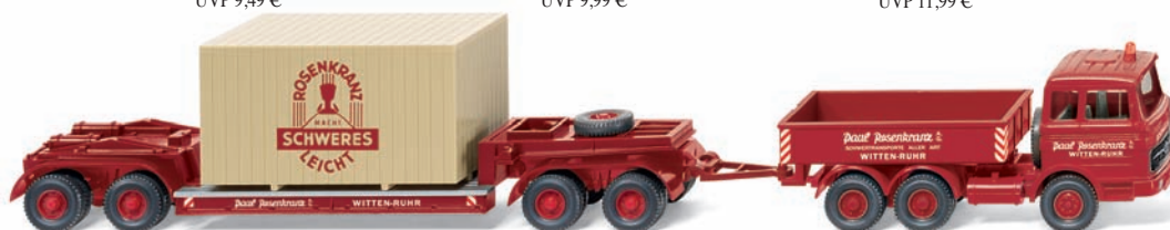
0504 01 Schwerlastzug (MB LP 2223) UVP 24,99 €