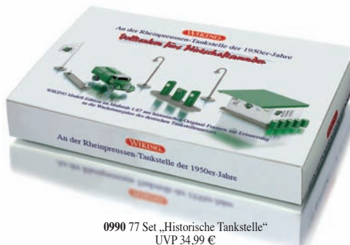
0990 77 Set „Historische Tankstelle“ UVP 34,99 €

Liebe zu Raritäten wird belohnt: Mit einem Klassiker-Set aus historischen Formen lässt WIKING die 1950er-Jahre lebendig werden, als die heute längst vergessene Treibstoffmarke „Rheinpreussen“ vor allem im Ruhr-Revier zum Straßenbild gehörte. Opel Blitz-Tankwagen, aber auch die typisch grün-weißen Zapfsäulen und das legendäre „Haus zur Tankstelle“ finden damit den Weg in Liebhaberhände. Ölfässer, Bogenlampe und Verkehrsinsel hält das Set ebenfalls bereit – die authentische WIKING-Ausstattung für eine zeitgenössische Szenerie. Außer-