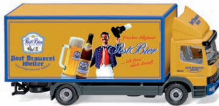
0435 05 Koffer-Lkw (MB Atego) UVP 18,99 €