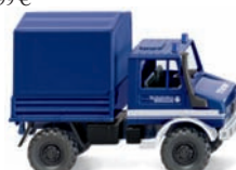
0693 16 THW - Unimog U 1700 mit Plane UVP 9,99 €