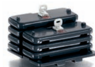
0773 80 Ballastgewichte für Claas Xerion UVP 14,95 €