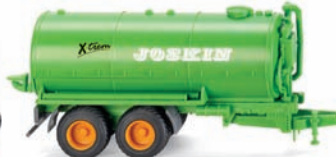
0382 39 Vakuumfasswagen (Joskin) UVP 11,99 €