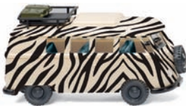
0797 09 VW T1 Campingbus „Safari“ UVP 14,99 €