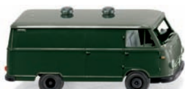
0270 48 Borgward Kastenwagen B611 UVP 12,49 €