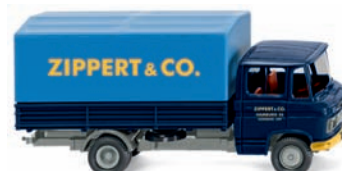
0271 01 Pritschen-Lkw (MB L 408) UVP 13,99 €

Zwei 1:87-Klassiker auf dem Weg zu WIKING-Meilensteinen: Mit dem 64er-Ford Mustang und dem Glas 1700 GT Cabrio erfüllen sich noch vor dem Weihnachtsfest lang gehegte Sammlerwünsche! Außerdem fahren der Borgward B611 mit detailfeinem Interieur als Gefangenentransporter und der Opel Kapitän als Polizeistreife ins Programm. Der THW-Unimog U 1700 sowie der VW Caddy der Berliner Feuerwehr ergänzen die Neuheiten-Auslieferung ebenso wie der MB L 408 der Spedition Zippert und der Schwerlastzug LP 2223 des Kranspezialisten