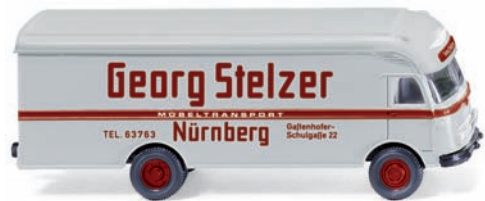
0500 01 Möbelwagen (Ackermann) UVP 12,99 €