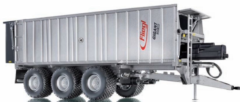
0773 13 Fliegl Abschiebewagen ASW288 UVP 59,95 €