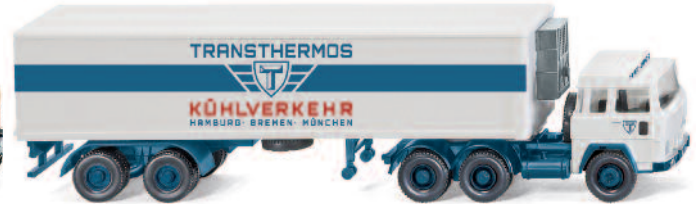
0528 49 Kühlkoffersattelzug (Magirus 235 D) UVP 19,99€

Beides sind Klassiker, die untrennbar mit der deutschen Nachkriegsgeschichte verbunden sind: WIKING stellt mit der August-Auslieferung das Glas Goggomobil mit filigranem Faltdach und den Ford FK 1000 als Kastenwagen vor. Beide Neuheiten erscheinen dank typischer WIKING-Handschrift filigran detailliert und komfortbedruckt. Darüber hinaus bringen der Ford Granada als Polizeifahrzeug und der Magirus 235 D