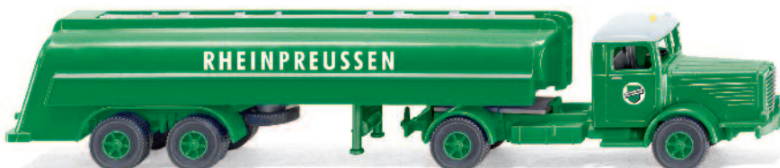
0882 49 Tanksattelzug (Büssing 8000) UVP 18,99€

Vier Jahrzehnte Automobilgeschichte – WIKING führt die Epochen in der Modellpflege facetten- und spannungsreich zusammen. Mit der legendären Brennstoffmarke „Rheinpreussen“ fährt der Tanksattelzug Büssing 8000 ins Programm, während der Ford Lincoln Continental und die MB Pagode als gestandene Chromklassiker die 1960er-Jahre Re-