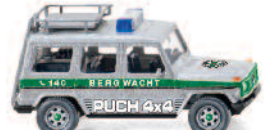
0278 03 Puch G UVP 14,99€