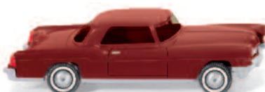
0210 01 Ford Lincoln Continental UVP 11,49€