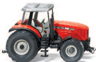
0385 05 Massey Ferguson MF 8270 UVP 12,49€