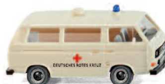
0320 02 DRK - VW T3 Bus UVP 11,49€