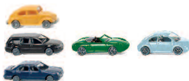
0918 08 Set mit 3 verschiedenen Pkw (Mix) N-Spur 1:160 UVP 7,99€