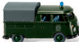
0864 19 Polizei - VW T1 Doppelkabine mit Plane UVP 12,99€