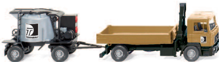
0689 03 Gussasphaltkocher-Hängerzug (MAN F 90) UVP 17,49€