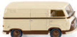
0289 01 Ford FK 1000 Kastenwagen UVP 11,99€