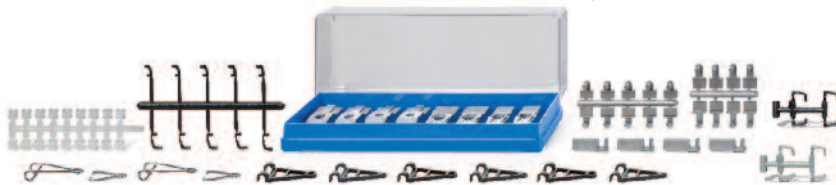
0018 05 Zubehörpackung - Verbindungen UVP 9,99€