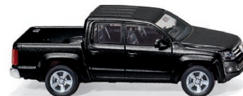
0311 02 VW Amarok UVP 18,89 €