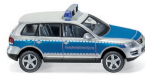
0104 43 VW Touareg GP "Kampfmittelbeseitigung" UVP 16,99 €