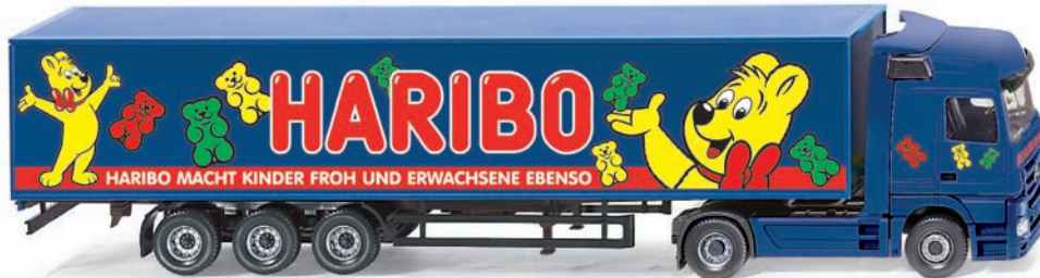
0538 15 Koffersattelzug (MB Actros) UVP 25,49 €