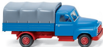
0345 01 Pritschen-LKW (Hanomag Diesel L28) UVP 11,49 €