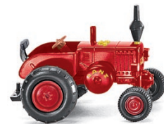
0880 04 Lanz Bulldog UVP 6,99 €