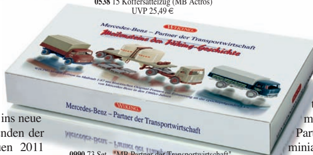
0990 73 Set - "MB Partner der Transportwirtschaft" UVP 36,99 €

W IKING startet mit einer Klassiker-Offensive ins neue Modelljahr – automobile Legenden der Wirtschaftswunderjahre erfreuen 2011 den 1:87-Sammler! So miniaturisieren die Traditionsmodellbauer das Goggomobil der ersten Stunde ebenso wie den Ford Transit in der beeindruckenden Panoramaversion. Mit dem Hanomag Diesel Pritschen-Lkw macht WIKING das Neuheiten-Wunschtrio zahlreicher Markenfreunde komplett, denn alle drei Modelle zählen zu den Klassikern, die einst das Straßenbild der aufstrebenden