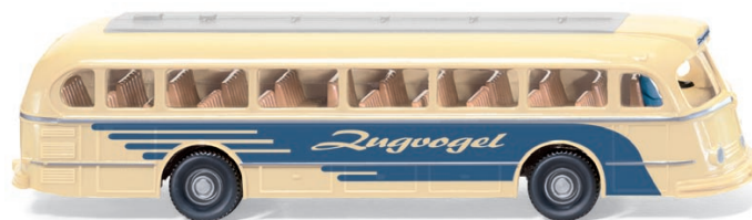
0700 01 Autobus (MB O 6600 H Pullman) UVP 15,49 €

Dieser Autobus versprüht den WIKING-Charme der 1960er-Jahre: Der Mercedes-Benz O 6600 H Pullman erfährt mit der Februar-Modellpflege ein zeitgenössisch liebevolles Finishing – der Bus-Klassiker macht seinem Namen als „Zugvogel“ alle Ehre und zieht die Blicke der Sammler auf sich. Außerdem gibt es ein Wiedersehen mit dem Lanz Bulldog, dem geschlossenen Unimog U 411 sowie der legendären Ente von Citroën.