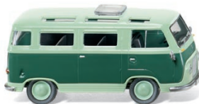
0289 99 Ford Transit Panorama-Bus UVP 11,95 €