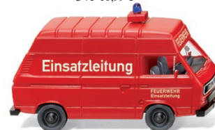
0601 21 Feuerwehr VW T3 UVP 10,99 €