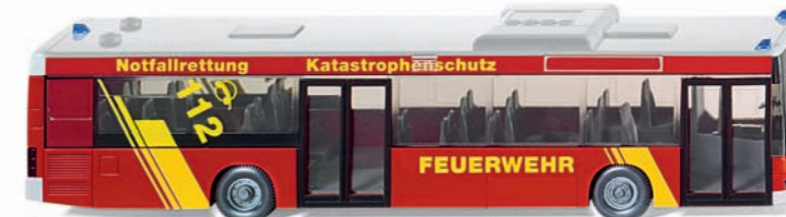
0706 03 42 Feuerwehr - MAN Linienbus