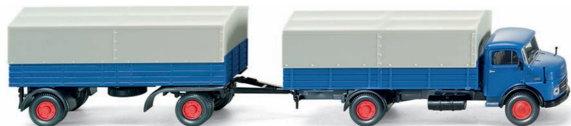
0852 01 39 Pritschen-Lastzug (MB L1113)