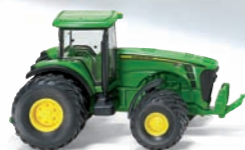
0966 40 27 John Deere 8530 mit Doppelbereifung N-SUR 1:160

Neuheiten-Vielfalt und eine Sonder-Edition für den themenreichen Modellfrühling 2008: WIKING stellt den urbanen Allradler VW Tiguan vor und erinnert mit dem Fendt Farmer 2S an den Marktoberdorfer Erfolgsschlepper. Und auch das Rüsselsheimer Duo mit Opel Rekord D und legendärem Commodore B bringt neuen 1970er-Jahre Lifestyle ins Klassikerprogramm. Ebenso bemerkenswert ist die neue Kurzhauber-Baureihe von Mercedes-Benz, die eine Reihe von zeitgenössischen Lkw eröffnet. In einmaliger Auslieferung verspricht eine Themen-