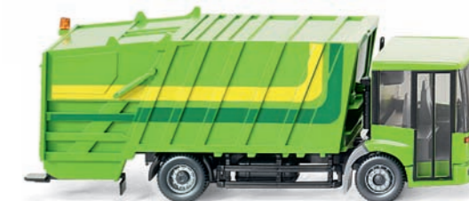
0638 04 35 Pressmüllwagen (MB Econic)