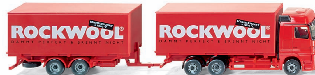
0599 06 42 Wechselkoffer-Zentralachshängerzug (MB Actros)

So reizvoll kann die Autowelt im Maßstab 1:87 sein: Zu einer außergewöhnlichen WIKING-Mission startet ein VW Touareg Gespann, das als ungewöhnliche Fracht die „Zwickauer Rennpappe“ geladen hat – der einstige DDR-Bestseller Trabant 601 lässt als kontrastrei-