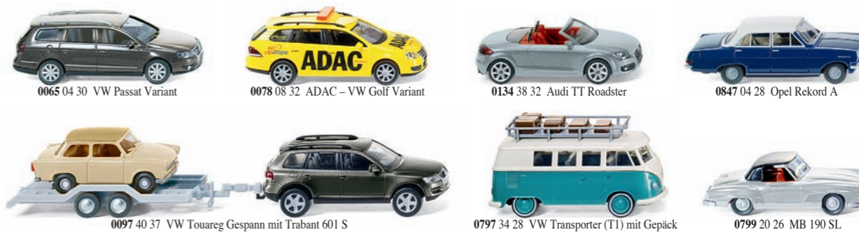
0065 04 30 VW Passat Variant