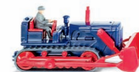
0868 03 20 Planierraupe (Gmeinder-Kaelble PR 610)