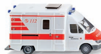
0321 04 30 Rettungswagen - RTW (MB Sprinter)