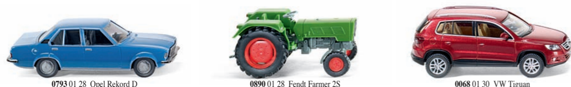
0793 01 28 Opel Rekord D