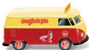
797 02 31 VW T1 mit Dachschild