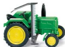
882 01 25 John Deere 2016