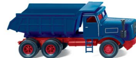
866 38 33 Muldenkipper (Kaelble)