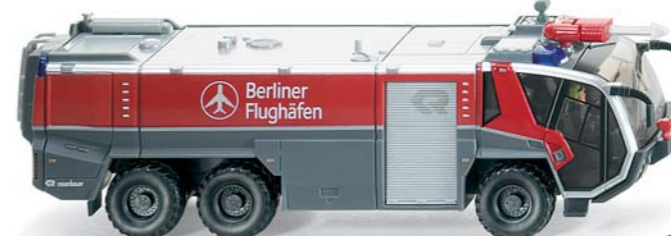
626 02 46 Feuerwehr – FLF Panther 6x6 (Rosenbauer)