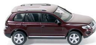
060 40 30 VW Touareg