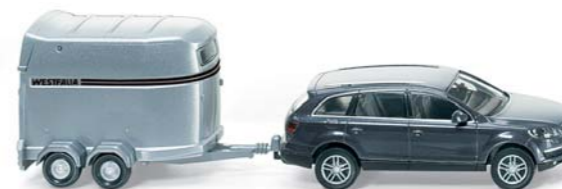
066 03 41 Audi Q7 mit Pferdeanhänger