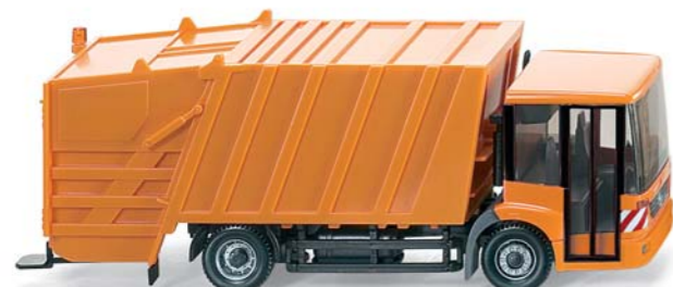
638 03 34 Pressmüllwagen (MB Eonic Facelift)