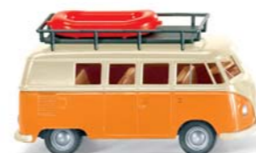
797 38 28 VW T1 mit Schlauchboot