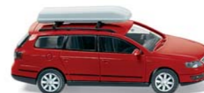
065 03 33 VW Passat Variant mit Dachbox