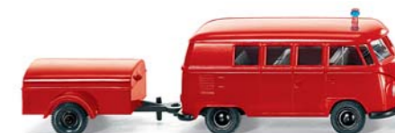
861 13 29 Feuerwehr – VW T1 mit Anhänger