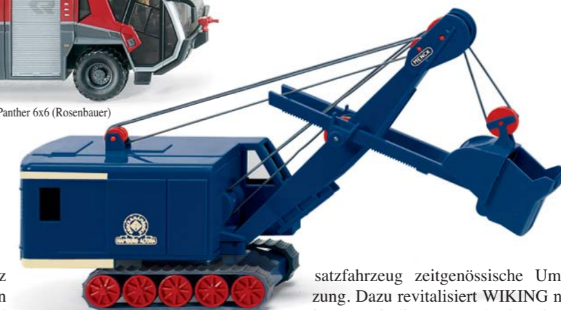
897 03 37 Menck-Bagger

Die Berliner Flughäfen sind stolz auf ihre neue Generation von Flugfeldlöschfahrzeugen – und WIKING miniaturisiert als Pendant dazu den Rosenbauer Panther 6x6 in 1:87. Die Modellpflege nimmt sich im April der Farbaktualisierung zahlreicher topaktueller Pkw von VW bis Mercedes an. Im Mittelpunkt steht zweifellos das imposante Gespann des Audi Q7 mit Pferdeanhänger. Zugleich