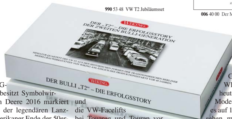
990 53 48 VW T2 Jubiläumsset

Dieses WIKING-Modell besitzt Symbolwirkung: Der John Deere 2016 markiert den Neubeginn der legendären Lanz-Ära, als die Amerikaner Ende der 50er-Jahre das Ruder der Traktorproduktion übernahmen und zugleich ihre grün-gelben Markenfarben in Deutschland einführten. Außerdem stellt WIKING im April den neuen Audi TT Roadster