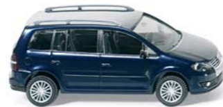
305 40 30 VW Touran