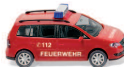
0601 20 33 Feuerwehr - VW Touran GP