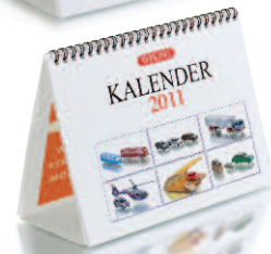
0006 17 00 WIKING Magazin 2010

DL 32 in den Farben der Feuerwehr Lübeck. Opel Rekord D und der DEUTZ-FAHR DX 4.70 machen als Youngtimer die Modellpflege komplett. Und weil WIKING wie keine andere