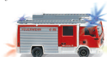
0774 24 Feuerwehr - LF 10/6 CL (MAN TGL)

WIKING CONTROL 87 wird zum modellbauerischen Spielsystem ausgebaut – die faszinierende Hightech-Philosophie macht's möglich! Fortan sind alle Systemkomponenten einzeln erhältlich, so dass eine noch bessere Kombination