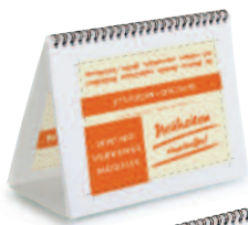
0007 11 00 WIKING Kalender 2011

Mit wirklichen WIKING-Schmankerln aus historischen Formen überrascht die Modellpflege der Oktober-Auslieferung – allen voran der Ackermann-Möbelzug im zeitgenössischen Auftritt der Spedition Schenker. Außerdem gibt es ein Wiedersehen mit dem VW T2, dessen Pritschenvorbild einst im kommunalen Straßendienst unterwegs war. Als Molkeriegefährt bringt das Goli-Dreirad die Milchkannen gleich mit, der legendäre Ford 17M erscheint im zeitgemäßen Design. Während der Mercedes-Benz 320 D einmal mehr das THW-Thema ergänzt, erscheint die neueste Metz-Drehleitergeneration