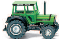
0386 01 27 DEUTZ-FAHR DX 4.70