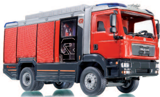
0431 40 Rosenbauer AT (MAN TGM)