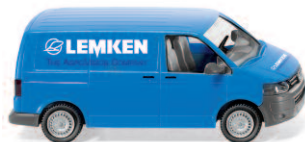
0309 04 34 VW T5 GP Kastenwagen