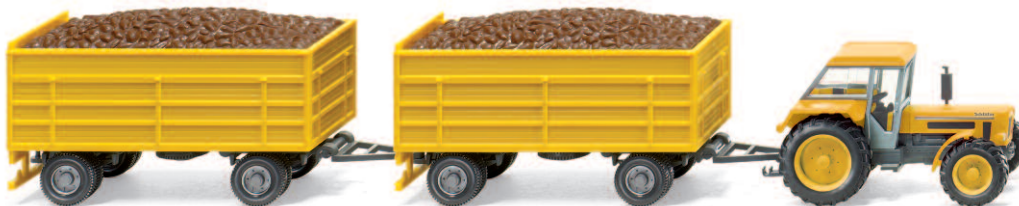
0875 02 42 Schlüter 1250 VL mit 2 Rübenanhängern