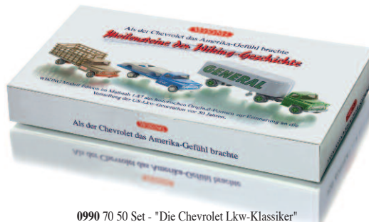
0990 70 50 Set - "Die Chevrolet Lkw-Klassiker"

K raftvoller Auftritt für einen Mercedes Benz-Klassiker erster Güte: WIKING stellt den LP 6600 als Behelfstanzug vor – ein attraktives Haubergespann, dessen Vorbild einst in Diensten der Spedition Hoyer stand. Überdies rüsten sich in 1:87 zwei Unimog für den Spezialeinsatz: Der U 20 hat sich fit für den Winterdienst gemacht, der U 1700 befördert die Kabeltrommel zur Baustelle. Außerdem belebt ein zeitgenössisches Rübenernstegespann das Landwirtschaftsthema. Dem kraftstrotzenden Schlüter 1250 VL stehen dabei gleich zwei Anhänger gut zu