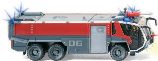
0774 21 00 Feuerwehr - FLF Panther 6x6 (Rosenbauer)