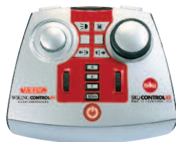
0774 10 Fernbedienung