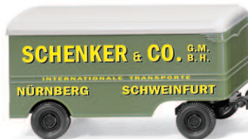
0540 01 40 Möbelzug - Ackermann