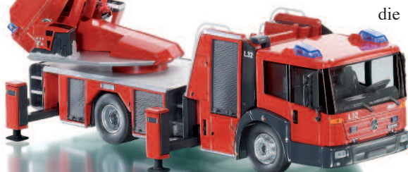
0431 01 Feuerwehr - DL 32 (MB Eonic)

D iecast-Qualität in 1:43 – WIKING stellt mit der Oktober-Auslieferung gleich zwei Feuerwehr-Spezialisten vor, die mit Funktionalität und Detailkraft überzeugen. Mit der DL 32 von Metz fährt erstmals eine Drehleiter ins Programm, die angesichts ihrer Dimension auf den ersten Blick beeindruckt. Die volle Beweglichkeit des 75 cm langen Leiterparks auch in der 43-fachen Miniaturisierung steht dabei im Mittelpunkt dieser neuesten Drehleitergeneration, die auf dem Fahrgestell des Mercedes Benz Eonic eine imposante Einsatzwirkung entfaltet. Als Pendant dazu stellt WIKING die neue „AT“-Generation von