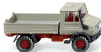
0375 01 28 Unimog 1700 L mit Kabeltrommel