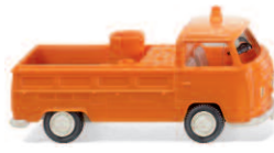
0316 01 30 VW T2 Pritsche - Kommunal