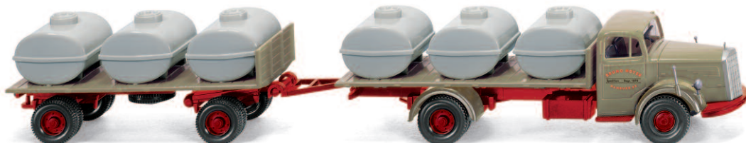
0859 40 40 Behelfstanzug (MB LP 6600)

K raftvoller Auftritt für einen Mercedes Benz-Klassiker erster Güte: WIKING stellt den LP 6600 als Behelfstanzug vor – ein attraktives Haubergespann, dessen Vorbild einst in Diensten der Spedition Hoyer stand. Überdies rüsten sich in 1:87 zwei Unimog für den Spezialeinsatz: Der U 20 hat sich fit für den Winterdienst gemacht, der U 1700 befördert die Kabeltrommel zur Baustelle. Außerdem belebt ein zeitgenössisches Rübenernstegespann das Landwirtschaftsthema. Dem kraftstrotzenden Schlüter 1250 VL stehen dabei gleich zwei Anhänger gut zu