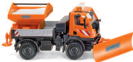
0646 05 37 Unimog U 20 - Winterdienst