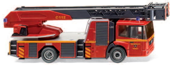
0627 03 48 Feuerwehr Lübeck - DL 32 (MB Econic)