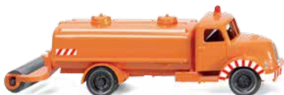
0640 01 Kommunal – Sprengwagen (Magirus Sirius) UVP 13,99 €