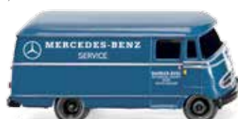
0265 02 Kastenwagen (MB L 319) UVP 10,99 €