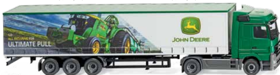
0537 08 Gardinenplanensattelzug (MB Actros) UVP 29,99 €