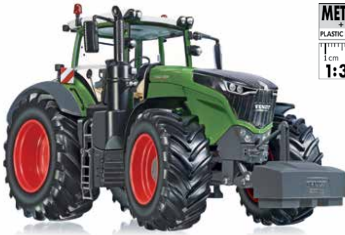
0773 49 Fendt 1050 Vario · UVP 79,95 €