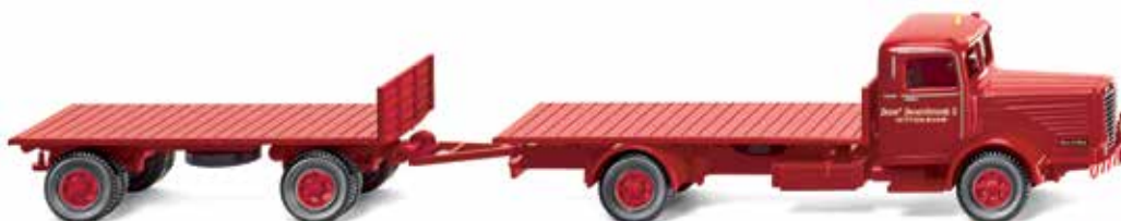
0856 01 Flachpritschenlastzug (Büssing 8000) UVP 17,99 €