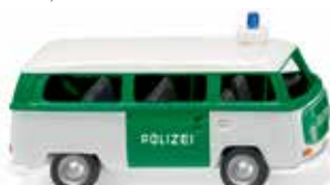
0864 39 Polizei - VW T2 Bus UVP 11,99 €