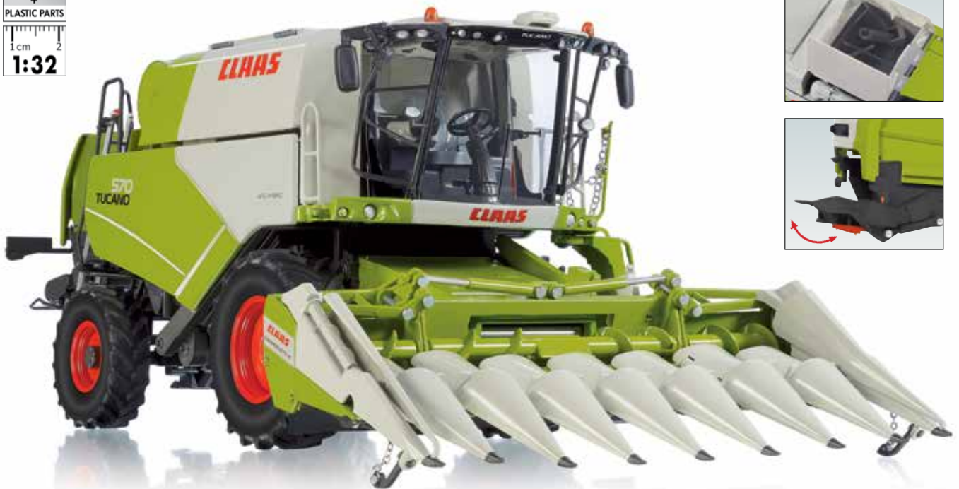
0778 18 Claas Tucano 570 Mähdrescher mit Maisvorsatz Conspeed 8-75 · UVP 159,95 €