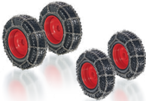
0773 91 Rädersatz mit Ketten für Fendt 828 · UVP 29,95 €

Perfekte Zusatzausrüstung: WIKING macht den Fendt 828 Vario für den Spezialeinsatz bereit! Jetzt gibt es einen Räderketten-Satz, so dass jeder einzelne der abmontierbaren Reifen wintertauglich wird.