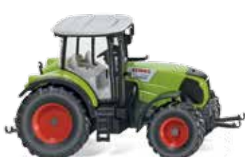
0363 10 Claas Arion 640 UVP 14,99 €