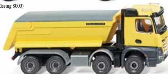
0674 49 Muldenkipper (Meiller/MB Arocs) UVP 32,99 €