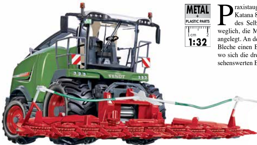
0778 13 Fendt Katana 85 Feldhäcksler · UVP 139,95 €