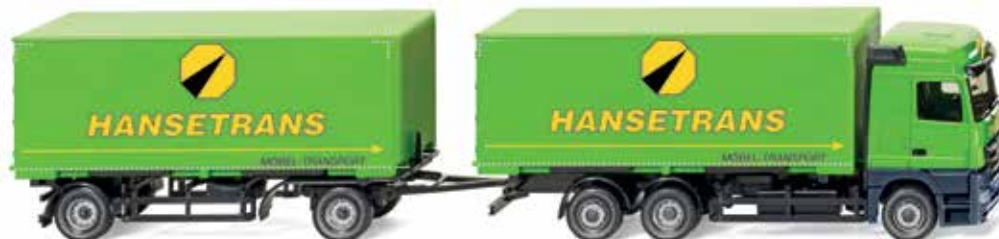
0573 11 Wechselkoffelhängerzug (MB Actros) UVP 29,99 €