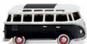
0317 03 VW T1 Sambabus UVP 11,49 €