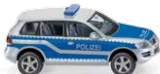
0104 49 Polizei – VW Touareg GP UVP 16,99 €