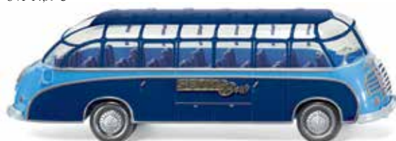
0730 01 Reisebus (Setra S8) UVP 17,99 €