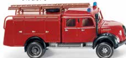
0863 38 Feuerwehr - TLF 16 (Magirus) UVP 17,49 €