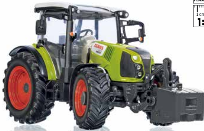
0778 11 Claas Arion 420 · UVP 64,95 €