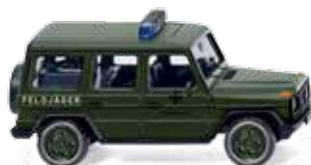
0695 07 Bundeswehr - Feldjäger (MB G) UVP 14,99 €