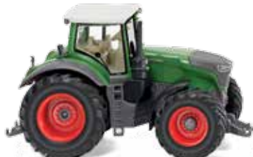
0361 60 Fendt 1050 Vario UVP 16,99 €