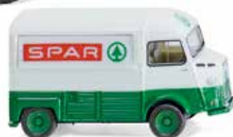
0262 04 Citroën HY Verkaufswagen UVP 11,99 €