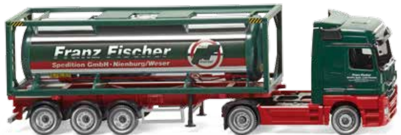
0536 03 Tankcontainersattelzug 30' (MB Actros) UVP 34,99 €

Die neue Baustellen-Generation von Mercedes-Benz ist da! Der Arocs mit seinem markanten Frontgrill in Baggerzahn-Optik aktualisiert das große WIKING-Traditionsthema – der Modell-Debutant stellt sich als attraktiver Dreiseitenkipper vor. Einen Blick zurück wirft hingegen der Volvo F89 in Bölling-Farben, der den Baustellenalltag der 1970er-Jahre beleuchtet, während der Mercedes-Benz Actros erstmals einen 30-Fuß-Tankcontainer eskortiert. Erin-