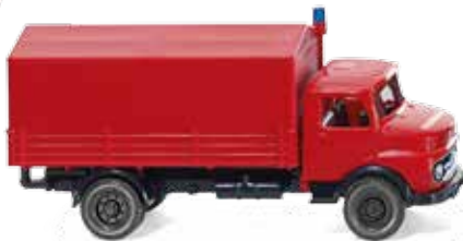
0861 34 Feuerwehr - Pritschen-Lkw (MB Kurzhauber) UVP 12,49 €