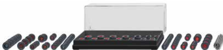
0018 15 Zubehörpackung - Lkw-Räder UVP 11,99 €