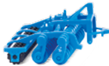
0378 20 Lemken Kurzscheibenegge Heliodor 9 UVP 6,99 €