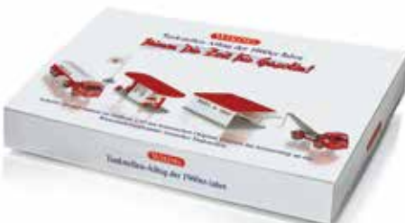
0990 89 Set "Tankstelle Gasolin" UVP 49,99 €

Zur individuellen Nachrüstung können WIKING-Freunde jetzt auch auf ein Lkw-Räder-Set zurückgreifen, u.a. mit den beliebten Trilexfelgen. Wirkliche WIKING-Kenner wissen Modelle mit "Flügelrad"-Spedition zu schätzen, denn Koffer-Lkw Modelle erschienen bereits vor fünf Jahrzehnten in dieser Gestaltung, die sich großer Beliebtheit erfreuten. Wunderschöne Klassiker in zeitgenössischen Farben stehen überdies im Mittelpunkt der Dezember-Modellpflege. Dazu zählen der eisengraue Mercedes-Benz 220 S und der perlweiße DKW Junior de Luxe mit grauem Dach, aber auch der NSU Ro 80, dessen aerody-