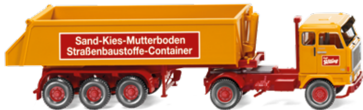
0676 06 Hinterkippersattelzug (Volvo F89) UVP 18,99 €