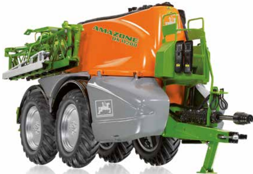
0773 46 Amazone Feldspritze UX 11200 · UVP 99,95 €

Auch im Modell ein Superlativ: Die Amazone UX 11200 zeigt die Dimensionen einer imposanten 12.000 Liter-Spritze mit Tandemachse. Das Super-L-Gestänge ermöglicht in der modellbauerischen Arbeitsbreite die Darstellung der ganzen Leistungsfähigkeit des Vorbilds. Dazu tragen auch die breiten, abklappbaren Spritzenarme sowie das anheb- und absenkbare Spritzgestell bei. Die Pumpenmimik ist filigranisiert nachgebildet, der Domdeckel an der Tankoberseite kann geöffnet werden.