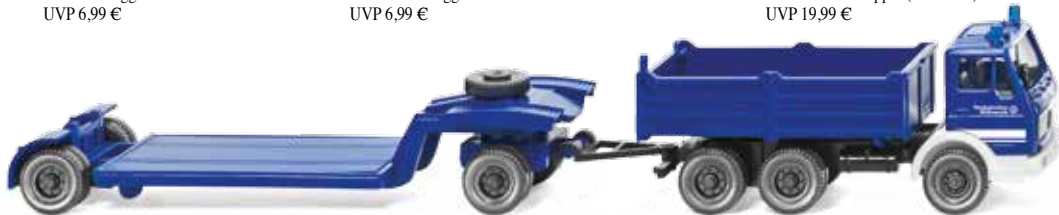
0693 26 THW - Tiefladehängerzug (MB NG) UVP 18,99 €