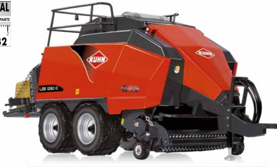
0778 19 Kuhn Großpackenpresse LSB 1290 iD · UVP 89,95 €

Die Kuhn Großpackenpresse LSB 1290 iD ist im Ernteeinsatz Garant für Quaderballen mit bis zu 25% höherer Dichte. WIKING zeigt wie's geht – alle vorbilddominanten Funktionen sind miniaturisiert. Sämtliche Maschinenverkleidungen können geöffnet werden. Hinter der frontseitigen Getriebeklappe verbirgt sich das Schwungrad, die Seitenklappen geben den Blick auf die entnehmbaren Garnkästen für die Verpackungsbänder frei. Die dachseitige Abdeckhaube ermöglicht technisch faszinierende Einblicke.