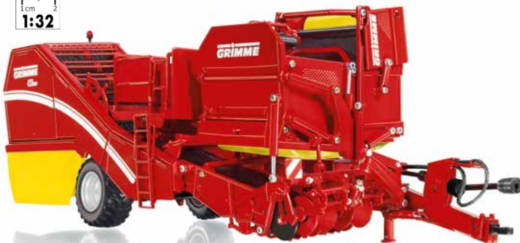
0778 16 Grimme Bunkerroller SE 260 · UVP 139,95 €

Mit dem seitlich gezogenen Grimme SE 260 miniaturisiert WIKING erstmals einen Bunkerroller im Maßstab 1:32. Das WIKING-Modell verfügt für den seitlich gezogenen Schleppereinsatz über eine schwenkbare Deichsel und eine gefederte Pendelachse. Große modellbauerische Detailqualität verbirgt sich unter der roten Grimme-Verkleidung – der Blick ins Maschineninnere fasziniert.