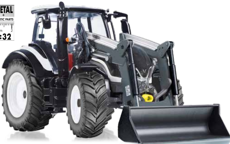
0778 15 Valtra T174 mit Frontlader · UVP 69,95 €

Der Valtra T174 bestätigt auch in 1:32 seinen Ruf als ein wendig-leistungsfähiger Hof- und Erntehelfer. Dank des vollbeweglichen Frontladers kommt das Valtra-Konzept der '365-Tage-Sicht' zum Tragen. Schmale Kabinenpfosten und bestmögliche Rundumsicht erleichtern den Schleppereinsatz zu jeder Tages- und Nachtzeit. Die Räder können auch bei diesem Modell selbstverständlich gewechselt werden.