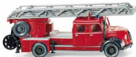
0862 34 Feuerwehr – Drehleiter (Magirus DL 25h) UVP 21,49 €