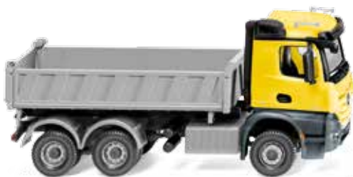
0678 49 Dreiseitenkipper (MB Arocs) UVP 26,99 €