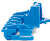
0378 10 Lemken Kreiselegge Zirkon 12 UVP 6,99 €