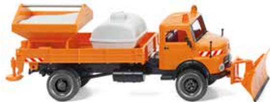
0646 07 Winterdienst - Pritschenkipper (MB LAK) UVP 19,99 €