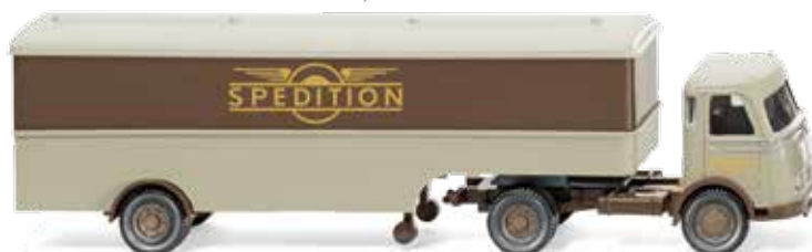
0513 20 Koffersattelzug (MB Pullman) UVP 19,99 €