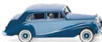
0838 03 Rolls Royce Silver Wraith UVP 13,49 €