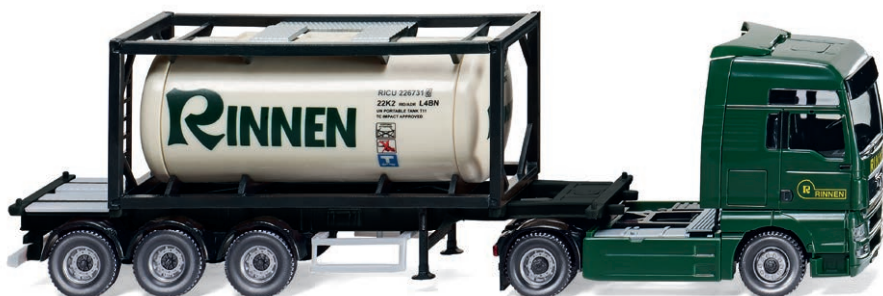
0536 01 Tankcontainersattelzug 20' (MAN TGX) UVP 29,99 €