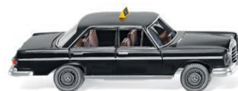
0800 11 Taxi - MB 280 SE UVP 11,99 €