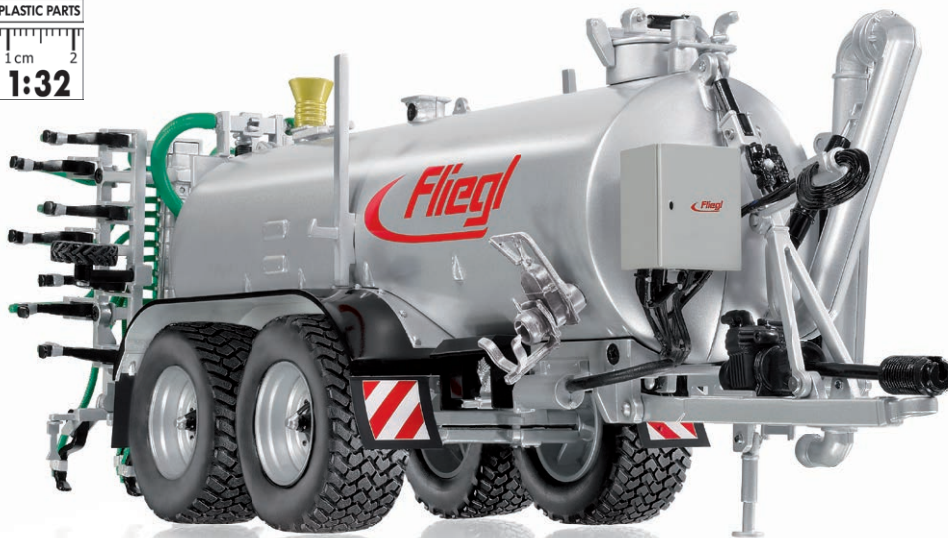
0773 38 Fliegl VFW 18.000 Profiline / Güllegrubber GUG 6m · UVP 79,95 €