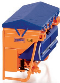
0773 89 Schmidt Traktorstreuer Traxos FS 12 UVP 34,95 €