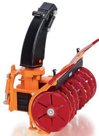
0773 90 Schmidt Anbau-Fräsche FS 105-265 UVP 29,95 €