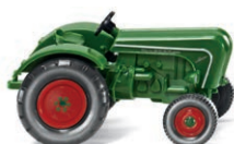
0878 49 Allgaier Schlepper UVP 7,99 €