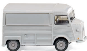
0262 02 Citroën HY Verkaufswagen UVP 10,99 €