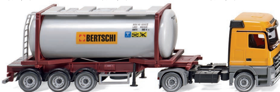
0536 02 Tankcontainersattelzug Swap (MB Actros) UVP 29,99 €