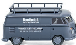
0797 15 VW T1 Kastenwagen UVP 12,99 €