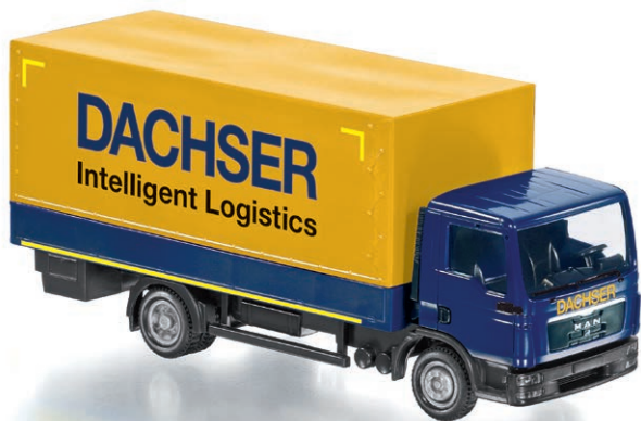
0774 28 Pritschen-Lkw (MAN TGL) · UVP 189,95 €