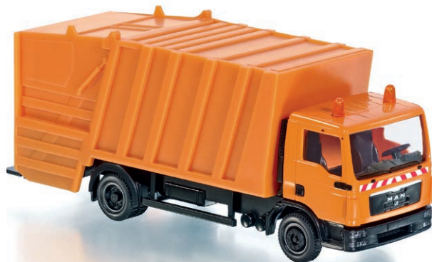
0774 29 Pressmüllwagen (MAN TGL) · UVP 189,95 €