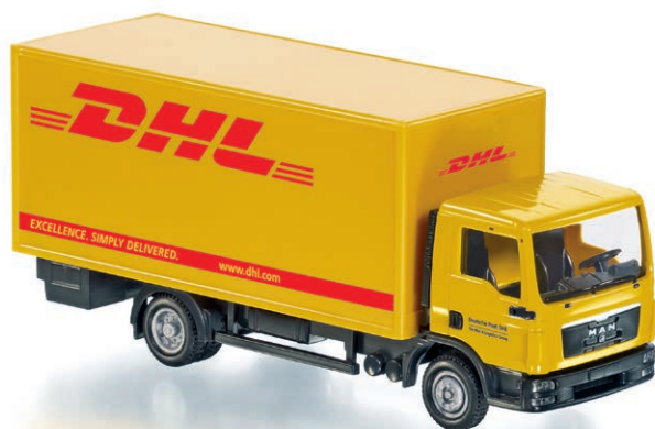
0774 27 Koffer-Lkw (MAN TGL) · UVP 189,95 €