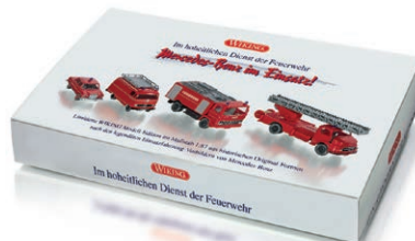
0990 88 Set „Feuerwehr“ UVP 43,99 €

Die französische Trikolore lässt grüßen – WIKING stellt drei Klassiker vor: Der Renault R4 überzeugt mit Sonnendach, aber auch als „Fourgonette“ mit Leiteröffnung – natürlich beweglich konstruiert. Genauso funktionell präsentiert sich auch der Citroën HY als Verkaufswagen mit aufklappbarem Verkaufstand. Ergänzend debütieren der Allgaier-Schlepper, der BMW 2002 mit neuer Stoßstange sowie der Mercedes-Benz 280 SE als Edel-Taxi