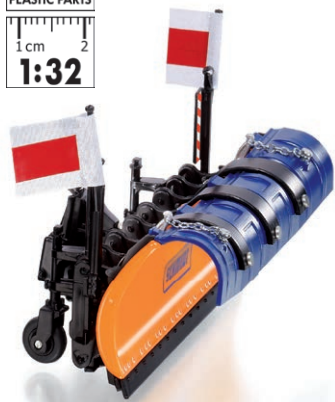
0773 88 Schmidt Schneepflug Taron MS 32.1 UVP 34,95 €