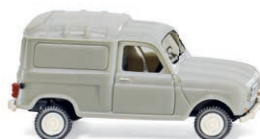
0225 01 Renault R4 Kastenwagen UVP 10,49 €