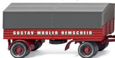
0859 05 Pritschenhängerzug (MB L 6600) UVP 21,99 €