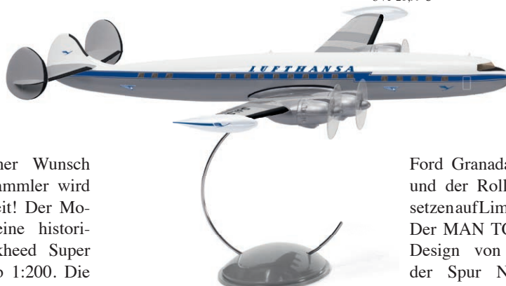
7342 01 Lockheed Super Constellation UVP 39,99 €