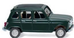
0224 02 Renault R4 UVP 9,99 €