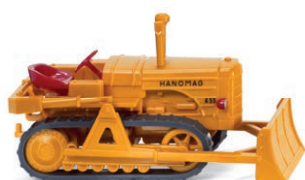
0844 38 Hanomag K55 Raupenschlepper UVP 9,99 €