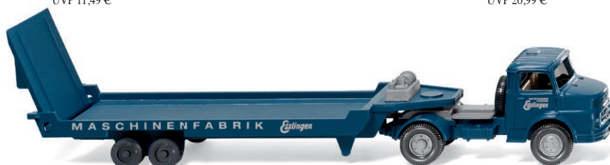
0490 01 Tiefladesattelzug (MB 1413) UVP 14,99 €