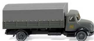
0949 03 Pritschen-Lkw (Magirus) N-Spur 1:160 UVP 8,49 €

Wunderschöne Klassiker – die Modellpflege mit viel zeitgenössischem Esprit macht's möglich! So fährt der VW Bulli der ersten Generation in bunter Flower-Power-Optik ins WIKING-Programm – die "Peace-Generation" der späten 1960er-Jahre lässt grüßen. Der Mercedes-Benz 1413 als Tieflader der Maschinenfabrik Esslingen macht genauso viel Modellspaß wie der Lanz Bulldog und der Kohlenanhänger mit wechselnden Wagennummern, die beide nach historischen Vorbildern der Berliner Hedwigshütte miniaturiert