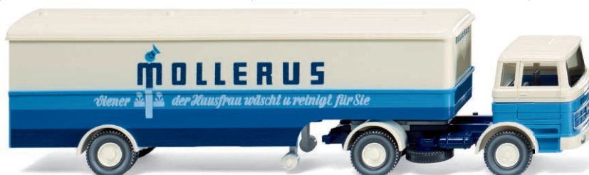
0513 18 Koffersattelzug (MB 1620) UVP 20,99 €