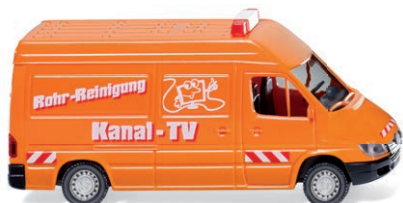
0283 02 Kommunaldienst - MB Sprinter Kastenwagen UVP 11,49 €