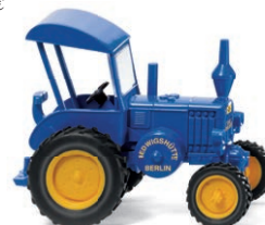
0880 07 Lanz Bulldog mit Dach UVP 8,99 €