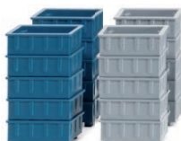
0018 12 Zubehörpackung - Stapelkästen UVP 4,99 €