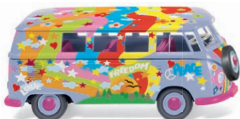
0797 14 VW T1 Bus UVP 16,99 €