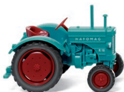
0885 05 Hanomag R 16 UVP 12,49 €