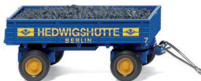
0400 01 Kohlenanhänger UVP 5,99 €