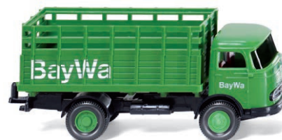
0446 03 Gitteraufbau-Lkw (MB LP 321) UVP 12,49 €