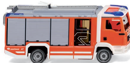
0612 49 Feuerwehr Rosenbauer AT LF (MAN TGL) UVP 24,99 €

Mit dem AT von Rosenbauer hält die neue Generation von Feuerwehrfahrzeugen in tagesleuchtrot bei WIKING Einzug. Der Fendt Katana 65 mit Gras pick-up überzeugt mit einem Höchstmaß an Detailqualität. Auch der Unimog U 20 feiert als Feuerwehrspezialist Premiere. Einen automobilen Blick zurück wirft WIKING auf den Renault R4 mit Sonnendach. Erstmals fährt der MAN