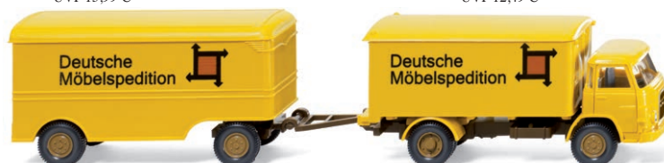
0540 03 Möbelkofferlastzug (MAN) UVP 17,49 €