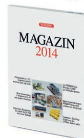
0006 21 WIKING Magazin 2014 UVP 10,00 €

Wunderschöne Klassiker – die Modellpflege mit viel zeitgenössischem Esprit macht's möglich! So fährt der VW Bulli der ersten Generation in bunter Flower-Power-Optik ins WIKING-Programm – die "Peace-Generation" der späten 1960er-Jahre lässt grüßen. Der Mercedes-Benz 1413 als Tieflader der Maschinenfabrik Esslingen macht genauso viel Modellspaß wie der Lanz Bulldog und der Kohlenanhänger mit wechselnden Wagennummern, die beide nach historischen Vorbildern der Berliner Hedwigshütte miniaturiert