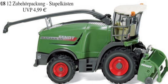
0389 60 Fendt Katana 65 mit Gras pick-up UVP 27,99 €