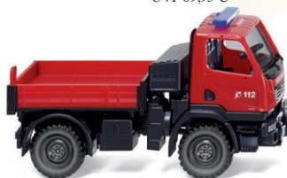
0601 25 Feuerwehr - Unimog U 20 UVP 13,99 €