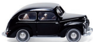
0820 03 Ford Taunus G73A UVP 11,99 €