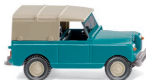
0100 02 Land Rover UVP 8,49 €