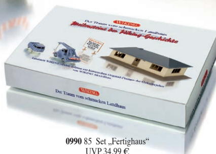
0990 85 Set „Fertighaus“ UVP 34,99 €

W IKING erinnert mit einer limitierten Edition an die Anfänge des Verkehrsmodell-Sortiments: Damals gehörte auch das Fertighaus „Typ Landhaus“ dazu, das die Modellbauer jetzt, sechs Jahrzehnte später, wieder den historischen Formen entlocken konnten. Das filigran aufgewertete „Landhaus Peltzer“ – die Außenleuchte entstand eigens dafür neu – erinnert an den kreativen Gründer von Wiking-Modellbau, der viele Jahre in Malente eine Oase der Ruhe fand. So inszenieren die Modellbauer diese seltene Themen-Edition durch eine typische Fertighauszenerie mit VW T1 und dem Demag Mobilkran V70 – eine wunderschöne Reminiszenz an