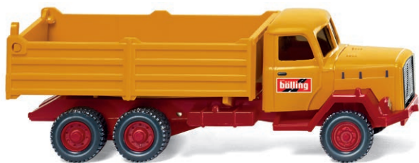
0424 02 Hochbordkipper (Magirus Saturn) UVP 12,99 €