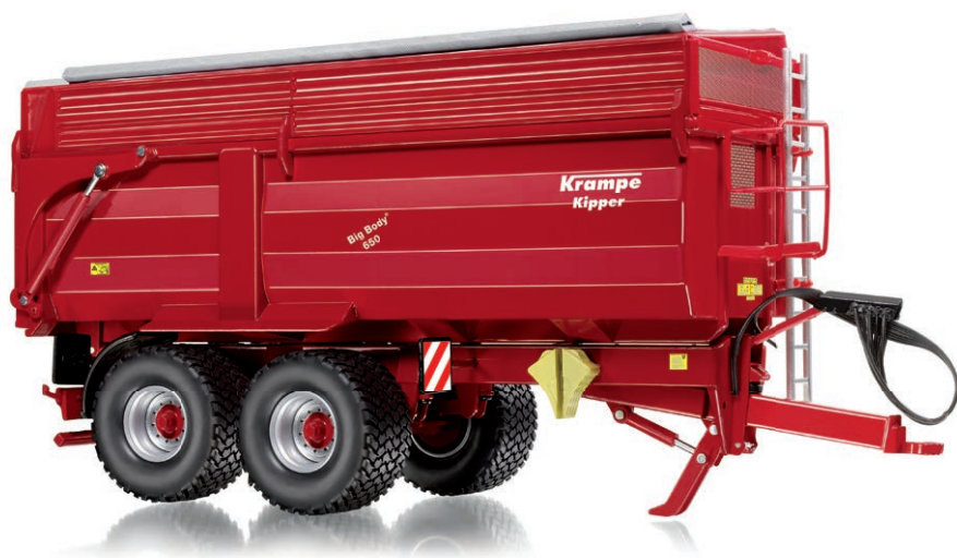
0773 39 Krampe Big Body · UVP 59,95 €