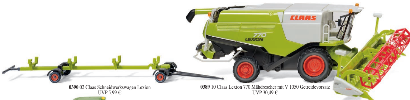
0390 02 Claas Schneidwerkswagen Lexion UVP 5,99 €