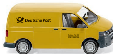
0309 06 VW T5 GP Kastenwagen UVP 14,49 €