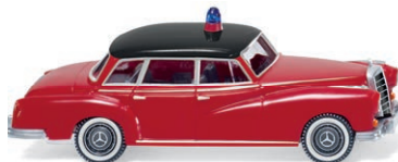
0861 25 Feuerwehr - MB 300 UVP 13,99 €