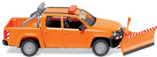
0311 07 VW Amarok - Winterdienst UVP 19,99 €