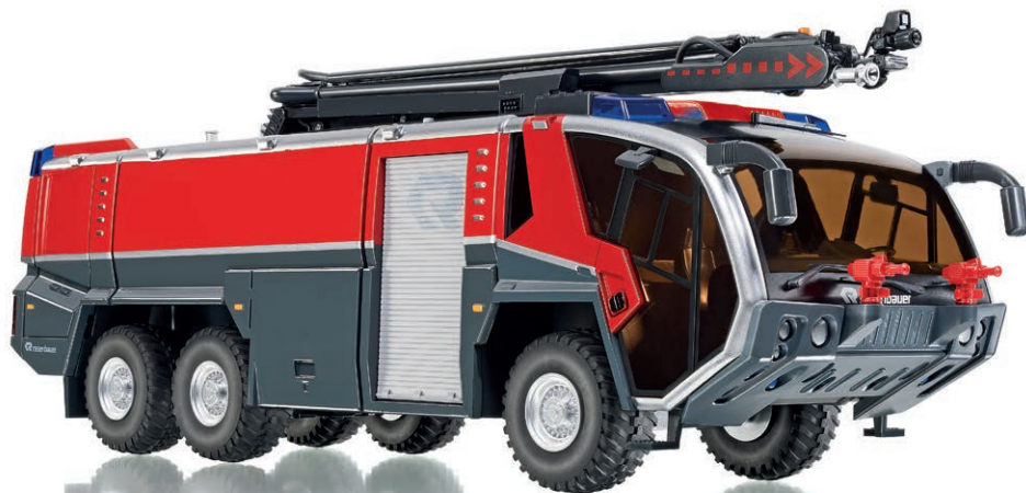
0430 03 Feuerwehr - Rosenbauer FLF Panther 6x6 mit Löscharm UVP 69,95 €