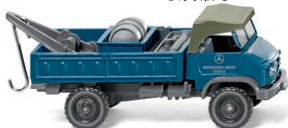
0366 01 Werkstattwagen (Unimog S) UVP 9,99 €