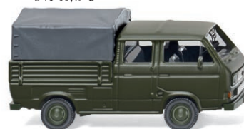
0293 02 Bundeswehr - VW T3 Doppelkabine UVP 11,99 €