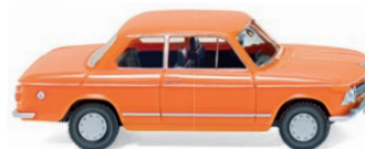
0183 01 BMW 2002 UVP 10,49 €