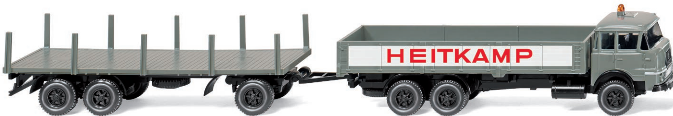
0502 01 Schwerlasthängerzug (Krupp) UVP 18,99 €

Im Nu war der VW Amarok bei seiner Modellpremiere vergriffen, rechtzeitig zum Winter stellt WIKING die filigrane Miniatur nach dem topaktuellen Pick-up-Vorbild aus Hannoveraner VW-Produktion in leicht modifizierter Modellpflege vor. Auch der VW T5 GP als Zustellfahrzeug der Deutschen Post repräsentiert die neueste Typengeneration des erfolgreichen Transporters in 87-facher Miniaturisierung. Mit dem Magirus