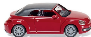
0028 49 VW The Beetle Cabrio (geschlossen) UVP 15,99 €