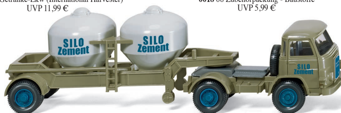
0530 01 Zementsattelzug (MAN) UVP 14,49 €