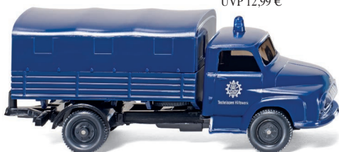
0693 20 THW - Pritschen-Lkw (Ford FK 2500) UVP 11,99 €