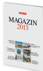
0006 20 WIKING-MAGAZIN 2013 UVP 10,00 €