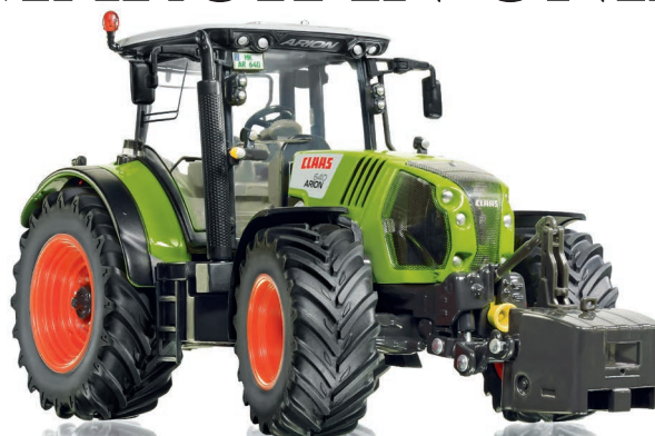
0773 24 Claas Arion 640 UVP 59,95 €