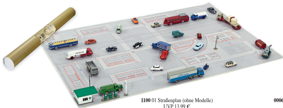
1100 01 Straßenplan (ohne Modelle) UVP 13,99 €