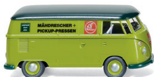
0797 11 VW T1 Kastenwagen UVP 12,99 €