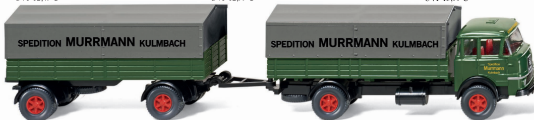
0486 01 Pritschenlastzug (Krupp 806) UVP 18,99 €