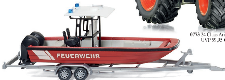
0095 47 Feuerwehr - Mehrzweckboot MZB72 (Lehmar) mit Dach UVP 12,99 €