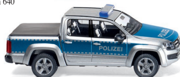
0311 06 Polizei - VW Amarok UVP 19,99 €