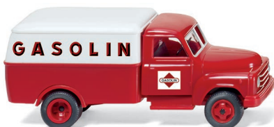
0345 48 Kasten-Lkw (Hanomag L28) UVP 12,49 €