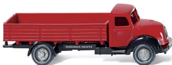
0426 01 Pritschen-Lkw (Magirus Sirius) UVP 11,99 €