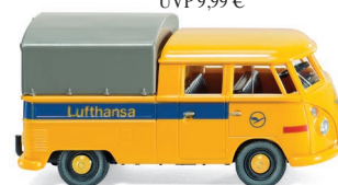
0789 04 VW T1 Doppelkabine UVP 14,99 €