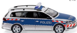
0104 47 Polizei - VW Passat B7 Variant UVP 16,99 €