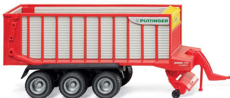
0381 39 Pöttinger Ladewagen UVP 12,99 €