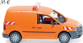
0275 07 Streckenkontrolle - VW Caddy UVP 13,49 €