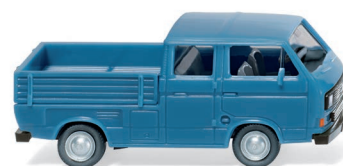
0293 01 VW T3 Doppelkabine UVP 10,99 €