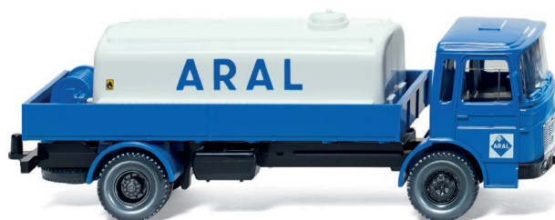
0808 99 Lkw mit Öltank (MAN) UVP 14,99 €