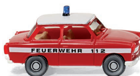
0861 24 Feuerwehr - Trabant 601 S UVP 10,99 €