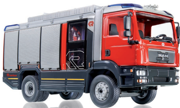
0431 98 Feuerwehr – Rosenbauer AT (MAN TGM) UVP 59,95 €