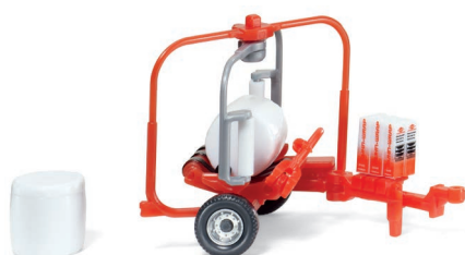
0384 40 Kuhn Ballenwickler RW 1800 UVP 9,99 €