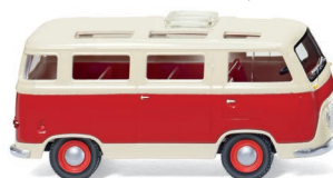
0289 98 Ford FK 1000 Panoramabus UVP 11,99 €