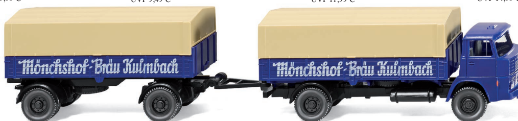
0417 01 Pritschenhängerzug (Henschel) UVP 19,99 €