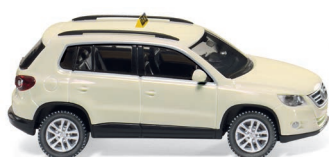
0149 22 Taxi - VW Tiguan UVP 14,49 €