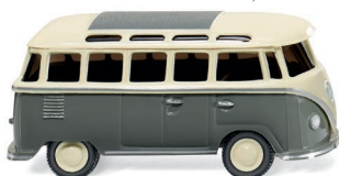
0317 02 VW T1 Sambabus UVP 9,49 €