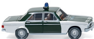
0864 32 Polizei - Audi 100 UVP 12,49 €