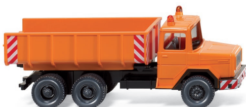
0645 01 Schuttwagen (Magirus Deutz) UVP 12,99 €