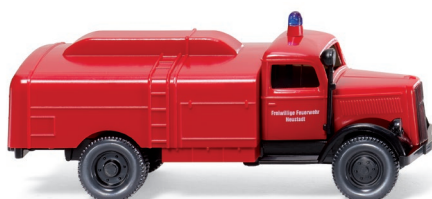
0861 23 Feuerwehr - Kesselwagen (Opel Blitz 1939) UVP 11,99 €