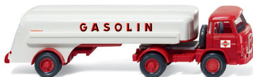
Bestandteile Set „Tankwagen im deutschen Alltag“ 0990 82

W IKING bringt Sommergefühle ins Programm – die Aura der Klassiker lässt grüßen: Mit dem Ford Mustang Cabrio in sunlight-yellow überrascht die Neuheiten-Auslieferung an den Fachhandel ebenso wie mit dem Audi 100 als Polizei-Streifenwagen und dem 1939er Opel Blitz Kesselwagen als Feuerwehr-Tanklöschfahrzeug. Premiere feiern auch der Hanomag Koffer-Lkw HD5N sowie der Magirus-Deutz als Eckhauber-Schuttwagen. Für