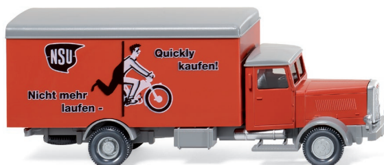
0846 01 Koffer-Lkw (Hanomag HD5N) UVP 12,99 €