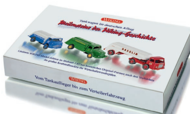
0990 82 Set „Tankwagen im deutschen Alltag“ UVP 39,99 €

W IKING bringt Sommergefühle ins Programm – die Aura der Klassiker lässt grüßen: Mit dem Ford Mustang Cabrio in sunlight-yellow überrascht die Neuheiten-Auslieferung an den Fachhandel ebenso wie mit dem Audi 100 als Polizei-Streifenwagen und dem 1939er Opel Blitz Kesselwagen als Feuerwehr-Tanklöschfahrzeug. Premiere feiern auch der Hanomag Koffer-Lkw HD5N sowie der Magirus-Deutz als Eckhauber-Schuttwagen. Für