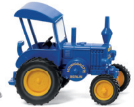
0880 07 Lanz Bulldog mit Dach