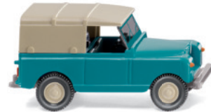
0100 02 Land Rover