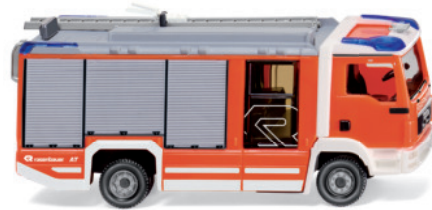
0612 49 Feuerwehr Rosenbauer AT LF (MAN TGL)