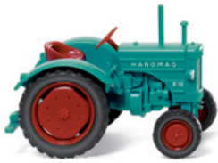
0885 05 Hanomag R 16