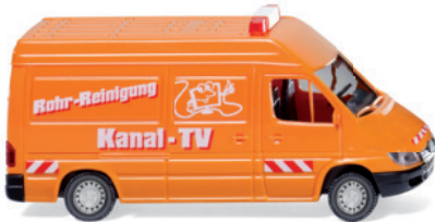
0283 02 Kommunaldienst - MB Sprinter Kastenwagen