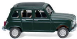
0224 02 Renault R4