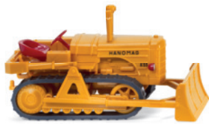
0844 38 Hanomag K55 Raupenschlepper