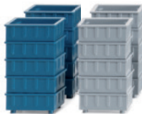
0018 12 Zubehörpackung - Stapelkästen