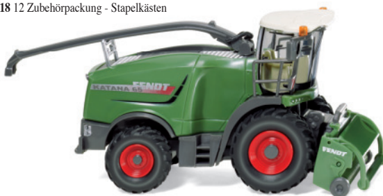
0389 60 Fendt Katana 65 mit Gras pick-up