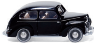
0820 03 Ford Taunus G73A