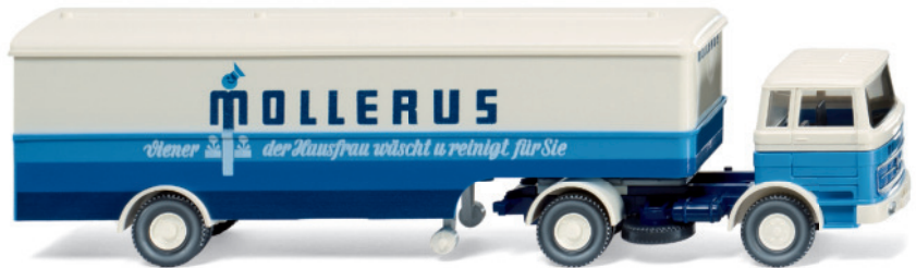
0513 18 Koffersattelzug (MB 1620)