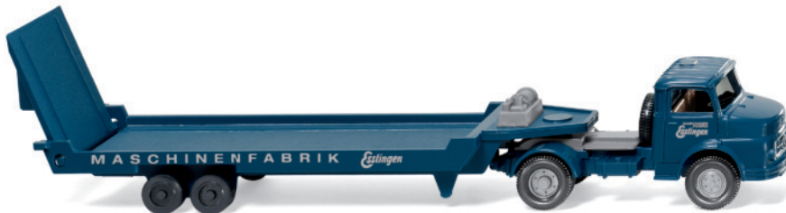
0490 01 Tiefladesattelzug (MB 1413)