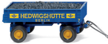
0400 01 Kohlenanhänger