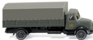
0949 03 Pritschen-Lkw (Magirus) N-Spur 1:160

W underschöne Klassiker – die Modellpflege mit viel zeitgenössischem Esprit macht's möglich! So fährt der VW Bulli der ersten Generation in bunter Flower-Power-Optik ins WIKING-Programm – die "Peace-Generation" der späten 1960er-Jahre lässt grüßen. Der Mercedes-Benz 1413 als Tieflader der Maschinenfabrik Esslingen macht genauso viel Modellspaß wie der Lanz Bulldog und der Kohlenanhänger mit wechselnden Wagennummern, die beide nach historischen Vorbildern der Berliner Hedwigshütte miniaturiert