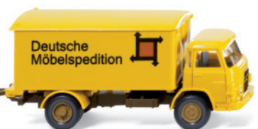
0540 03 Möbelkofferlastzug (MAN)