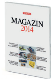
0006 21 WIKING Magazin 2014

W underschöne Klassiker – die Modellpflege mit viel zeitgenössischem Esprit macht's möglich! So fährt der VW Bulli der ersten Generation in bunter Flower-Power-Optik ins WIKING-Programm – die "Peace-Generation" der späten 1960er-Jahre lässt grüßen. Der Mercedes-Benz 1413 als Tieflader der Maschinenfabrik Esslingen macht genauso viel Modellspaß wie der Lanz Bulldog und der Kohlenanhänger mit wechselnden Wagennummern, die beide nach historischen Vorbildern der Berliner Hedwigshütte miniaturiert