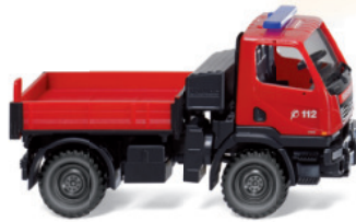
0601 25 Feuerwehr - Unimog U 20