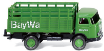
0446 03 Gitteraufbau-Lkw (MB LP 321)