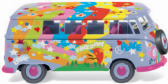
0797 14 VW T1 Bus