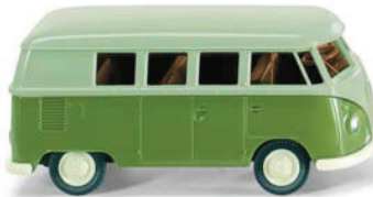
797 40 27 VW T1