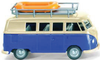
797 39 28 VW T1 mit Dachaufbau Schlauchboot