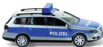
104 29 33 Polizei – VW Passat Variant