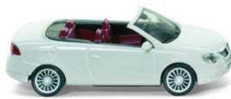
062 01 30 VW Eos