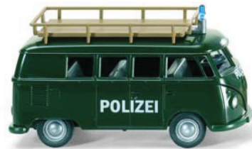
864 10 29 Polizei - VW T1