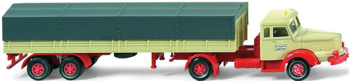
891 04 36 Pritschen-Sattelzug (Krupp Titan)

T reffsicher zum Hochsommer stellt WIKING den neuen VW Eos im nationalen Fachhandel vor. Der neue Open-Air-Wolfsburger vermittelt in der 87-fachen Miniaturisierung glatte, sportliche Formen – ein Spaß für alle Cabrio-Gourmets. Für WIKING-Freunde gibt es außerdem eine ganz besondere Premiere: Der Opel Caravan '56, der als Modell einst vorgestellt, aber nie in Serie ging,