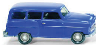
850 01 24 Opel Caravan '56