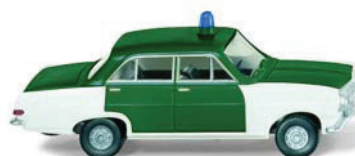
864 11 31 Polizei – Opel Rekord A