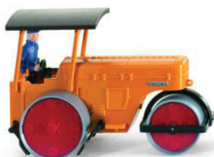
898 02 28 Straßenwalze (Ruthemeyer)