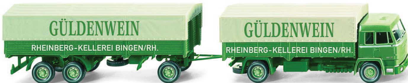
849 05 40 Pritschen-Lastzug (Büssing BS 16 L)

Die Wirtschaftswunderjahre auf Berliner Straßen – so heißt der Titel einer WIKING-Edition, die in einmaliger Auslieferung fünf zeitgenössische Fahrzeuge aus den späten 50er-Jahren Revue passieren lässt. Im authentischen Auftritt jener Zeit revitalisieren die Berliner Modellbauer Formen längst historischer WIKING-Modelle aus den Anfangsjahren der verglasten Serie. Mit dabei ist der