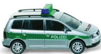
104 28 32 Polizei – VW Touran