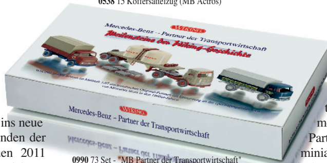
0990 73 Set - "MB Partner der Transportwirtschaft"

W IKING startet mit einer Klassiker-Offensive ins neue Modelljahr – automobile Legenden der Wirtschaftswunderjahre erfreuen 2011 den 1:87-Sammler! So miniaturisieren die Traditionsmodellbauer das Goggomobil der ersten Stunde ebenso wie den Ford Transit in der beeindruckenden Panoramaversion. Mit dem Hanomag Diesel Pritschen-Lkw macht WIKING das Neuheiten-Wunschtrio zahlreicher Markenfreunde komplett, denn alle drei Modelle zählen zu den Klassikern, die einst das Straßenbild der aufstrebenden