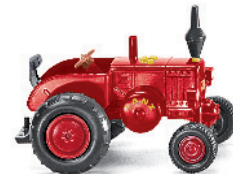
0880 04 Lanz Bulldog