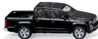
0311 02 VW Amarok