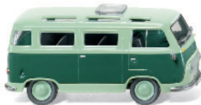
0289 99 Ford Transit Panorama-Bus