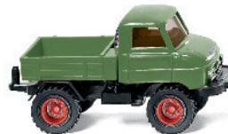
0371 03 Unimog U 411