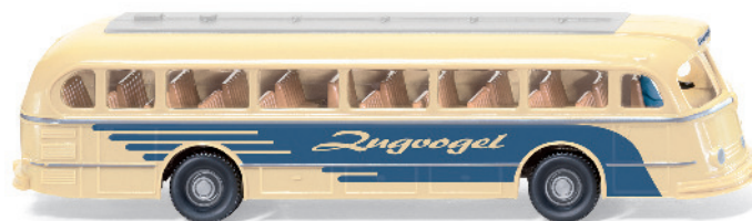
0700 01 Autobus (MB O 6600 H Pullman)

Dieser Autobus versprüht den WIKING-Charme der 1960er-Jahre: Der Mercedes-Benz O 6600 H Pullman erfährt mit der Februar-Modellpflege ein zeitgenössisch liebevolles Finishing – der Bus-Klassiker macht seinem Namen als „Zugvogel“ alle Ehre und zieht die Blicke der Sammler auf sich. Außerdem gibt es ein Wiedersehen mit dem Lanz Bulldog, dem geschlossenen Unimog U 411 sowie der legendären Ente von Citroën.