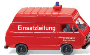
0601 21 Feuerwehr VW T3