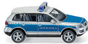
0104 43 VW Touareg GP "Kampfmittelbeseitigung"