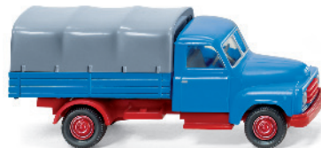
0345 01 Pritschen-LKW (Hanomag Diesel L28)