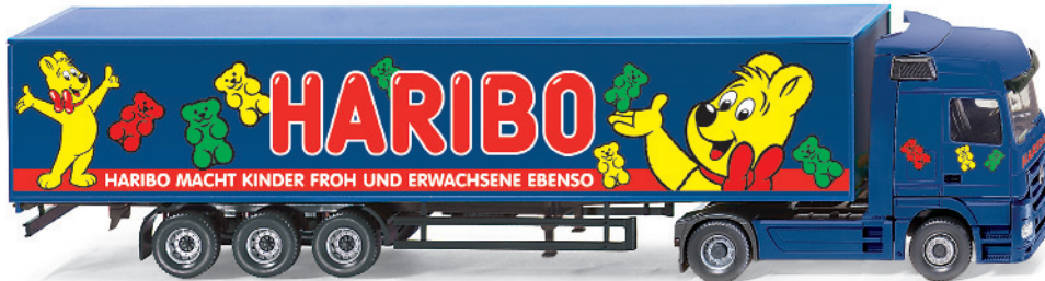
0538 15 Koffersattelzug (MB Actros)