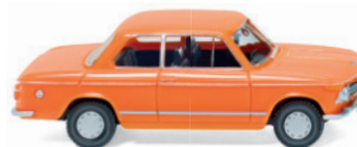
0183 01 BMW 2002