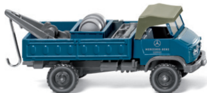
0366 01 Werkstattwagen (Unimog S)