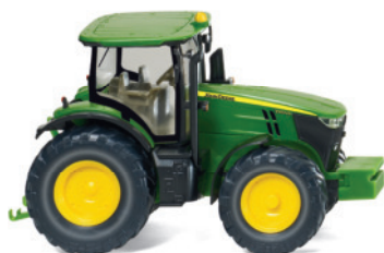
0358 01 John Deere 7260R