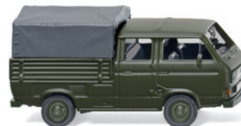
0293 02 Bundeswehr - VW T3 Doppelkabine