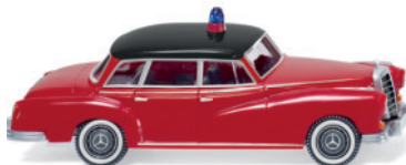
0861 25 Feuerwehr - MB 300