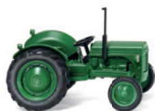
0892 04 Ferguson TE