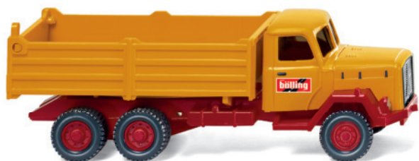
0424 02 Hochbordkipper (Magirus Saturn)