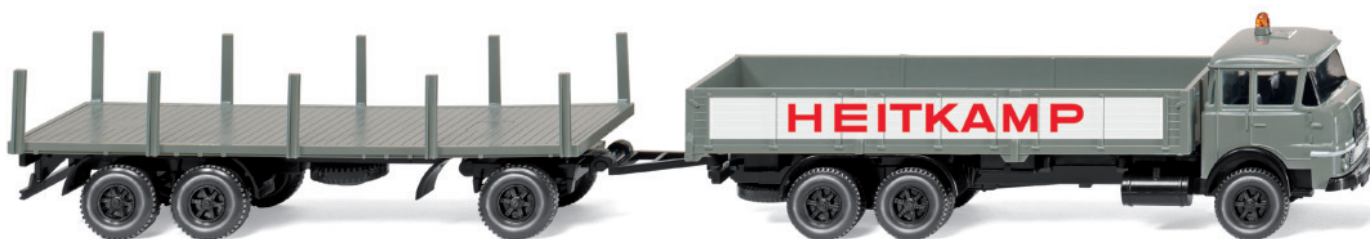
0502 01 Schwerlasthängerzug (Krupp)

Im Nu war der VW Amarok bei seiner Modellpremiere vergriffen, rechtzeitig zum Winter stellt WIKING die filigrane Miniatur nach dem topaktuellen Pick-up-Vorbild aus Hannoveraner VW-Produktion in leicht modifizierter Modellpflege vor. Auch der VW T5 GP als Zustellfahrzeug der Deutschen Post repräsentiert die neueste Typengeneration des erfolgreichen Transporters in 87-facher Miniaturisierung. Mit dem Magirus