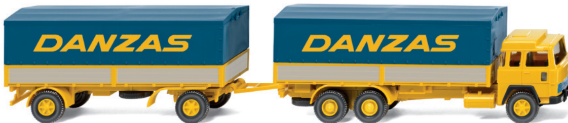
0475 01 Pritschenhängerzug (Magirus 235 D)

Neuheiten-Feuerwerk zum Jahresende! WIKING stellt mit der Dezember-Auslieferung zwei lang ersehnte Klassiker aus neuen Formen vor. Der BMW 2002 und der Renault R4 stehen für eine eigenständige Epoche, in die sich auch der Magirus 235 D als „Danzas“-Pritschenhängerzug und der Unimog S mit Faltdach als Werkstattwagen von Mercedes-Benz einfügt. Als weitere Neuheit debütiert die „Doka“ des VW T3, die viele Jahre als Standardtransporter in Diensten der Bundeswehr