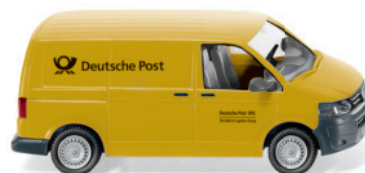
0309 06 VW T5 GP Kastenwagen