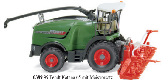
0389 99 Fendt Katana 65 mit Maisvorsatz

Das sind atemberaubende Maßstabskontraste, die WIKING-Enthusiasten und Landmaschinenfreunde ins Schwärmen geraten lassen: Der Claas Lexion 760 mit Conspeed Maispflücker überzeugt als Doppel-Debüt in 1:87 und 1:32. Beide Modellgiganten unterstreichen einmal mehr, was Detailvergnügen à la WIKING bedeutet – und das in so unterschiedlichen Maßstabsgrößen! Er-