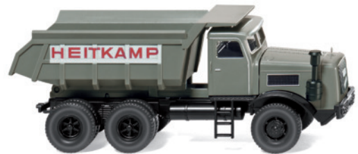
0866 36 Muldenkipper (Kaelble)