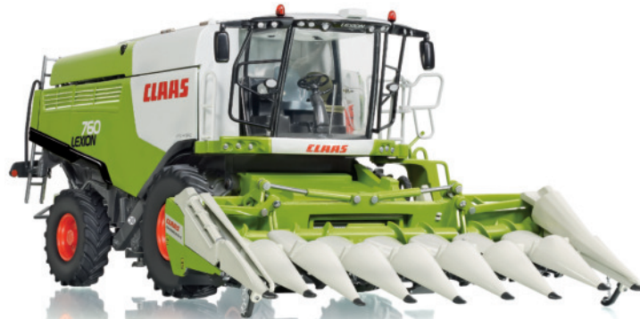
0773 40 Claas Lexion 760 Mährescher mit Conspeed Maisvorsatz