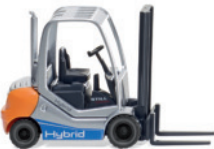
0663 39 Gabelstapler Still RX 70-30H