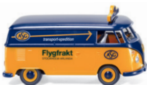
0797 13 VW T1 Kastenwagen