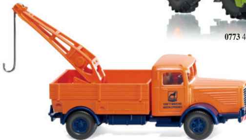
0634 02 Abschleppwagen (Büssing 8000)