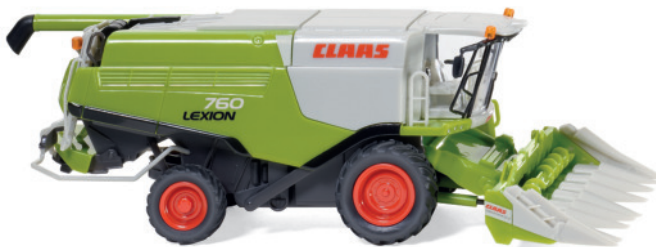
0389 11 Claas Lexion 760 Mährescher mit Conspeed Maisvorsatz