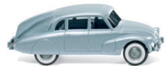
0827 49 Tatra 87