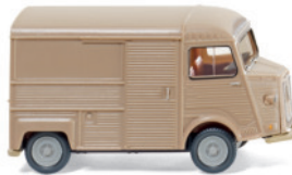
0262 01 Citroën HY Kastenwagen