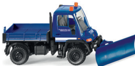
0693 22 THW - Unimog U 400 mit Räumschild