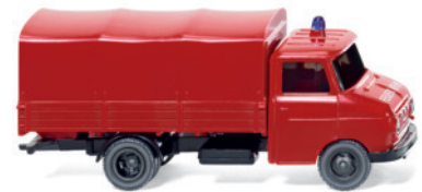
0861 27 Feuerwehr - Pritschen-Lkw (Opel Blitz)