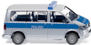
0104 48 Polizei - VW T5 GP Multivan