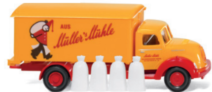
0540 49 Koffer-Lkw (Magirus Sirius)