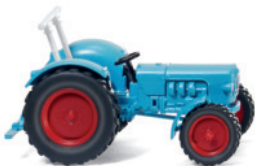
0871 42 Eicher Königstiger