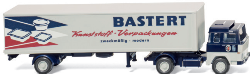
0547 01 Koffersattelzug (Magirus)