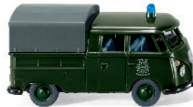
0864 19 Polizei - VW T1 Doppelkabine mit Plane UVP 12,99€