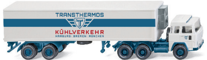
0528 49 Kühlkoffersattelzug (Magirus 235 D) UVP 19,99€

Beides sind Klassiker, die untrennbar mit der deutschen Nachkriegsgeschichte verbunden sind: WIKING stellt mit der August-Auslieferung das Glas Goggomobil mit filigranem Faltdach und den Ford FK 1000 als Kastenwagen vor. Beide Neuheiten erscheinen dank typischer WIKING-Handschrift filigran detailliert und komfortbedruckt. Darüber hinaus bringen der Ford Granada als Polizeifahrzeug und der Magirus 235 D