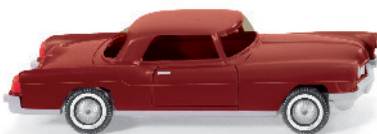
0210 01 Ford Lincoln Continental UVP 11,49€