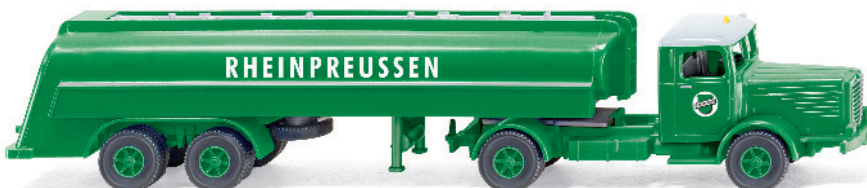
0882 49 Tanksattelzug (Büssing 8000) UVP 18,99€

Vier Jahrzehnte Automobilgeschichte – WIKING führt die Epochen in der Modellpflege facetten- und spannungsreich zusammen. Mit der legendären Brennstoffmarke „Rheinpreussen“ fährt der Tanksattelzug Büssing 8000 ins Programm, während der Ford Lincoln Continental und die MB Pagode als gestandene Chromklassiker die 1960er-Jahre Re-