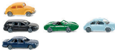
0918 08 Set mit 3 verschiedenen Pkw (Mix) N-Spur 1:160 UVP 7,99€