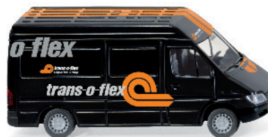
0285 49 MB Sprinter - Kastenwagen UVP 11,49€