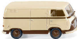
0289 01 Ford FK 1000 Kastenwagen UVP 11,99€