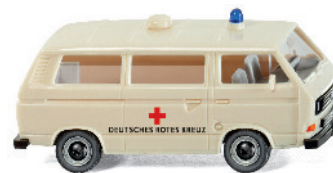
0320 02 DRK - VW T3 Bus UVP 11,49€