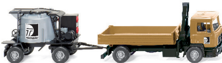
0689 03 Gussasphaltkocher-Hängerzug (MAN F 90) UVP 17,49€