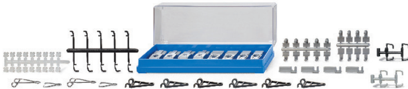
0018 05 Zubehörpackung - Verbindungen UVP 9,99€