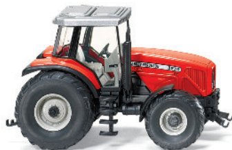
0385 05 Massey Ferguson MF 8270 UVP 12,49€