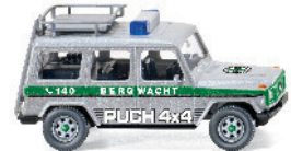
0278 03 Puch G UVP 14,99€