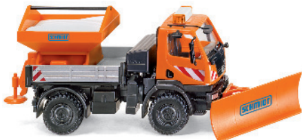
0646 05 37 Unimog U 20 - Winterdienst