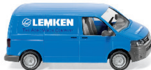
0309 04 34 VW T5 GP Kastenwagen