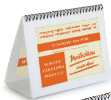
0007 11 00 WIKING Kalender 2011

Mit wirklichen WIKING-Schmankerln aus historischen Formen überrascht die Modellpflege der Oktober-Auslieferung – allen voran der Ackermann-Möbelzug im zeitgenössischen Auftritt der Spedition Schenker. Außerdem gibt es ein Wiedersehen mit dem VW T2, dessen Pritschenvorbild einst im kommunalen Straßendienst unterwegs war. Als Molkeriegefährt bringt das Goli-Dreirad die Milchkannen gleich mit, der legendäre Ford 17M erscheint im zeitgemäßen Design. Während der Mercedes-Benz 320 D einmal mehr das THW-Thema ergänzt, erscheint die neueste Metz-Drehleitergeneration