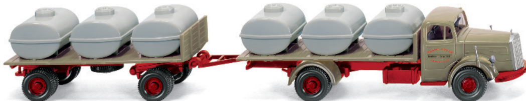
0859 40 40 Behelfstanzug (MB LP 6600)

K raftvoller Auftritt für einen Mercedes Benz-Klassiker erster Güte: WIKING stellt den LP 6600 als Behelfstanzug vor – ein attraktives Haubergespann, dessen Vorbild einst in Diensten der Spedition Hoyer stand. Überdies rüsten sich in 1:87 zwei Unimog für den Spezialeinsatz: Der U 20 hat sich fit für den Winterdienst gemacht, der U 1700 befördert die Kabeltrommel zur Baustelle. Außerdem belebt ein zeitgenössisches Rübenerntegespann das Landwirtschaftsthema. Dem kraftstrotzenden Schlüter 1250 VL stehen dabei gleich zwei Anhänger gut zu