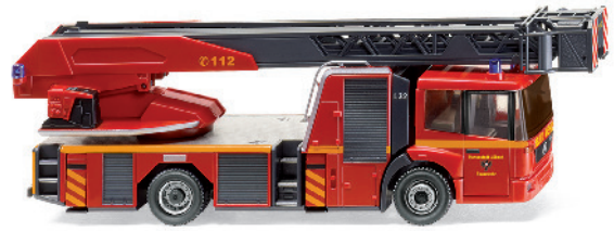
0627 03 48 Feuerwehr Lübeck - DL 32 (MB Econic)