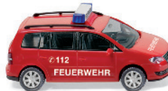
0601 20 33 Feuerwehr - VW Touran GP