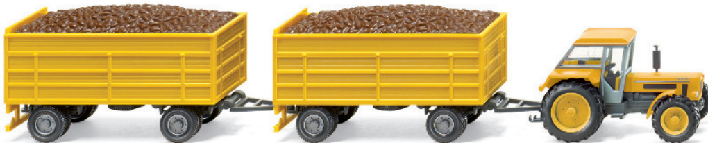
0875 02 42 Schlüter 1250 VL mit 2 Rübenanhängern