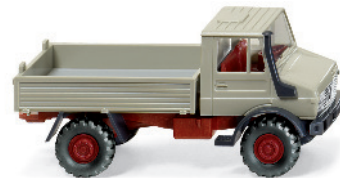
0375 01 28 Unimog 1700 L mit Kabeltrommel