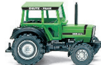
0386 01 27 DEUTZ-FAHR DX 4.70