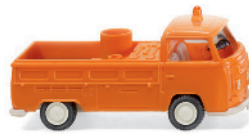
0316 01 30 VW T2 Pritsche - Kommunal