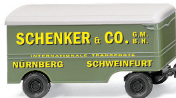
0540 01 40 Möbelzug - Ackermann