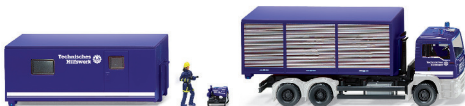
0693 12 43 THW Set (MAN TGS)