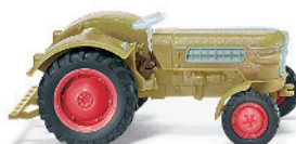
0899 03 26 Fendt Farmer 2