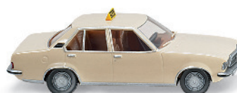
0800 06 29 Opel Rekord D