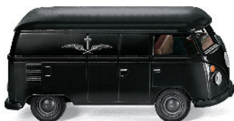
0797 05 30 VW T1 Bestattungswagen