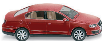
0064 03 29 VW Passat Limousine