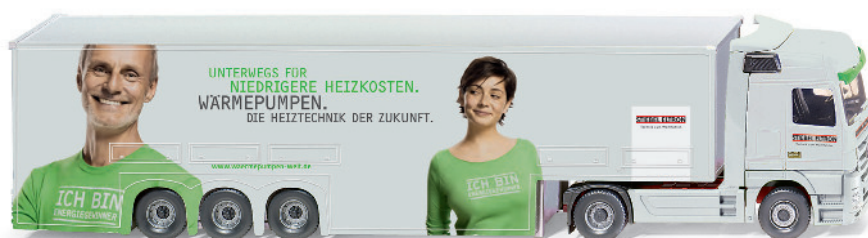
0529 04 46 Grossraumauflieger (MB Actros)