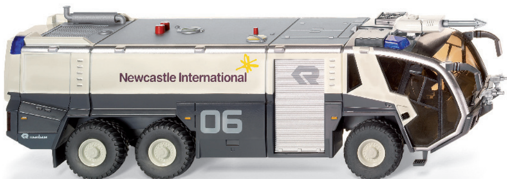
0430 02 00 FLF Panther 6x6 (Rosenbauer) Maßstab 1:43

Die großen Modell-Giganten stellt WIKING mit der Neuheiten-Auslieferung im Juni in den Mittelpunkt. Dabei kommt ein THW-Set in den Fachhandel, das dank zweier Abrollcontainer die gesamte Einsatzflexibilität des Technischen Hilfswerks beleuchtet. Entsprechend den Anforderungen im Katastrophenschutz ergänzt WIKING das Modellset mit einem THW-Helfer sowie Rosenbauer Tragkraftspritze. Der Detailreichtum