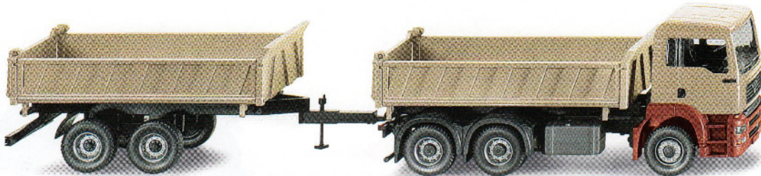
678 02 37 Kipperhängerzug (MAN TGA M)