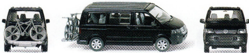
273 02 33 VW California mit Fahrrädern