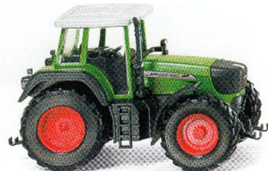
373 01 32 Fendt Vario 930