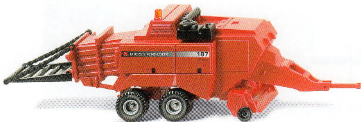
396 01 28 Quaderballenpresse MF 187