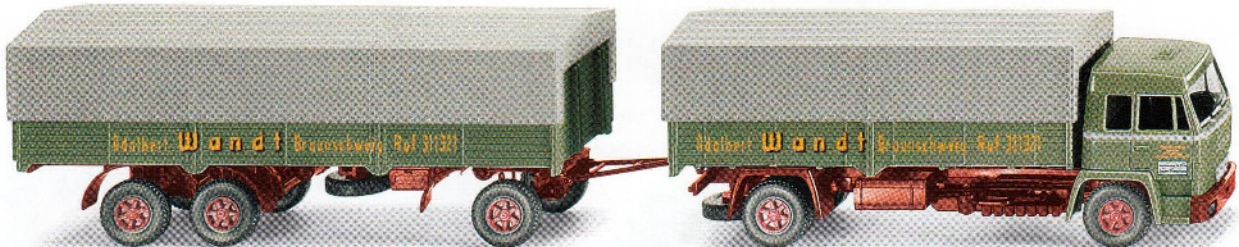
849 04 40 Pritschen-Lastzug (Büssing BS 16 L)