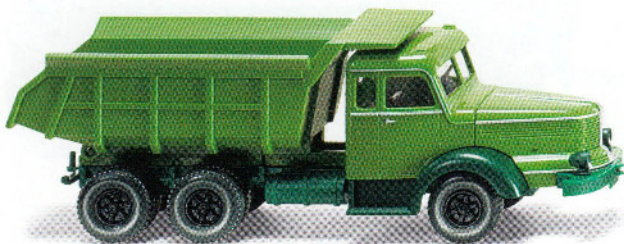
866 40 33 Muldenkipper (Krupp Titan)