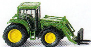
958 39 26 John Deere mit Frontgabel N-SPUR 1:160

Sommerzeit, Erntezeit – WIKING überrascht mit einem mächtigen Erntegespann von Top-Aktualität. Der Fendt Vario 930 als leistungsfähiger Großschlepper und die Quaderballenpresse von Massey Ferguson MF 187 ergänzen das beliebte Spektrum landwirtschaftlicher Modelle. Und auch in der Spur N faszinieren der Pöttinger-Heuladewagen und der John Deere-Schlepper. Der VW T5 rüstet sich indes für den Urlaub: Am Heck findet der Sammler auf einem angebaute Gepäckträger zwei filigrane Sporträder,