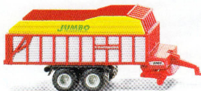
956 01 23 Heuladewagen (Pöttinger) N-SPUR 1:160

natürlich maßstäblich 87-fach miniaturisiert. Aber auch ein Klassiker schafft als wirklicher Epochenkontrast zeitgenössische Authentizität. Denn der Krupp Titan fährt als legendär wuchtiger Muldenkipper ins Programm. Da ist das Rosenbauer-Tunnelloschfahrzeug schließlich das I-Tüpfelchen der Juli-Auslieferung an den Fachhandel.