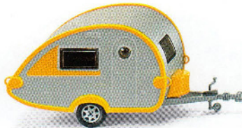
092 40 28 Wohnwagen T@B „Tequila Sun“