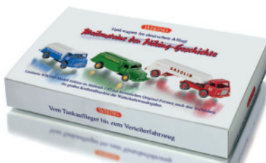
0990 82 Set „Tankwagen im deutschen Alltag“

W IKING bringt Sommergefühle ins Programm – die Aura der Klassiker lässt grüßen: Mit dem Ford Mustang Cabrio in sunlight-yellow überrascht die Neuheiten-Auslieferung an den Fachhandel ebenso wie mit dem Audi 100 als Polizei-Streifenwagen und dem 1939er Opel Blitz Kesselwagen als Feuerwehr-Tanklöschfahrzeug. Premiere feiern auch der Hanomag Koffer-Lkw HD5N sowie der Magirus-Deutz als Eckhauber-Schuttwagen. Für