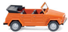
0040 49 VW 181