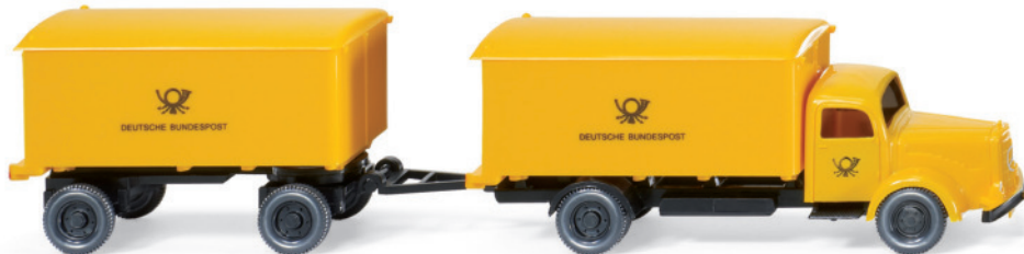
0550 01 Kofferhängerzug (MB L 5000)