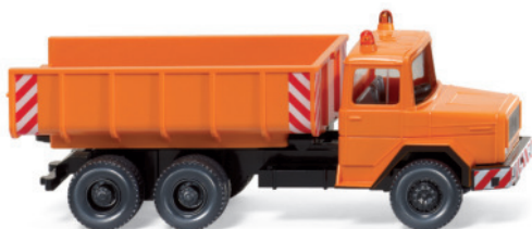
0645 01 Schuttwagen (Magirus Deutz)