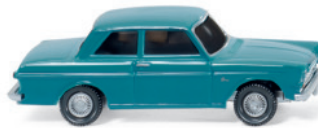
0202 01 Ford 12 M