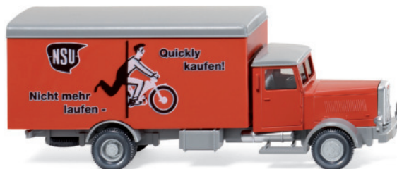
0846 01 Koffer-Lkw (Hanomag HD5N)