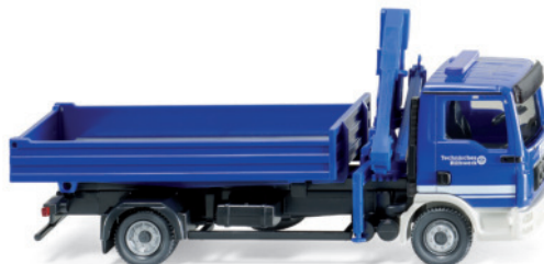
0693 19 THW - Pritschen-Lkw mit Ladekran (MAN TGL)