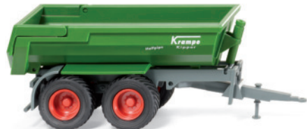
0388 11 Halfpipe-Muldenkipper (Krampe)