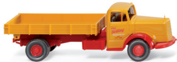
0895 05 Pritschenkipper (MB L 6600)

K lassiker und Youngtimer – attraktive Gestaltungen prägen die Modellpflege in der Juni Auslieferung. So gibt es ein Wiedersehen mit dem Ford 12 M und dem legendären VW 181. Der Buckel-Volvo PV 544 hat feriengerecht den Reiseanhänger im Schlepp, während der Fiat 1800 in zeitgenössischer Gestaltung Premium-Esprit der italienischen Autobauer versprüht. Das Porsche 356 Coupé kündigt von der sportlichen Seite der automobilen