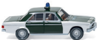
0864 32 Polizei - Audi 100