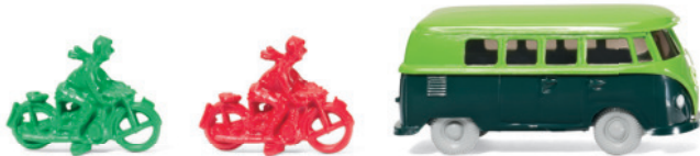
0990 83 Set „Sommerfrische am Wannsee“