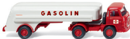
Bestandteile Set „Tankwagen im deutschen Alltag“ 0990 82