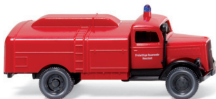
0861 23 Feuerwehr - Kesselwagen (Opel Blitz 1939)