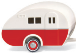
0839 07 Volvo PV 544 mit Reiseanhänger