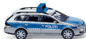
0104 39 33 Polizei - VW Golf V Variant