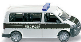
0695 04 34 Feldjäger - VW T5