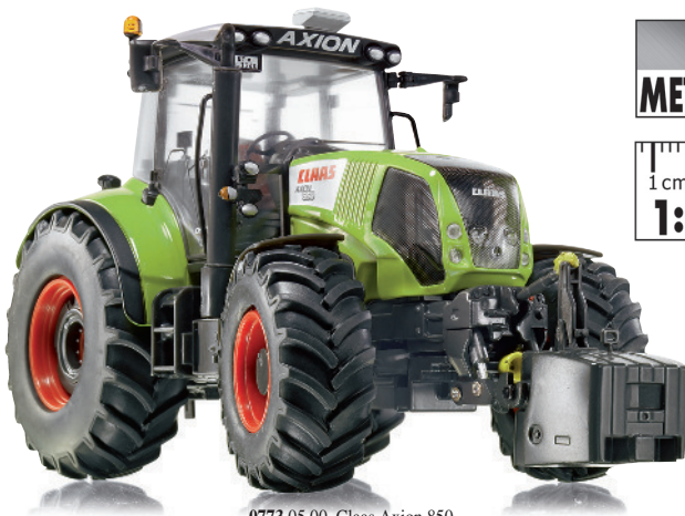
0773 05 00 Claas Axion 850