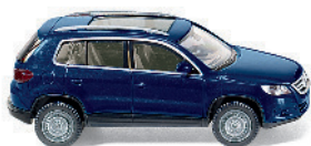
0068 39 31 VW Tiguan mit Glasschiebedach