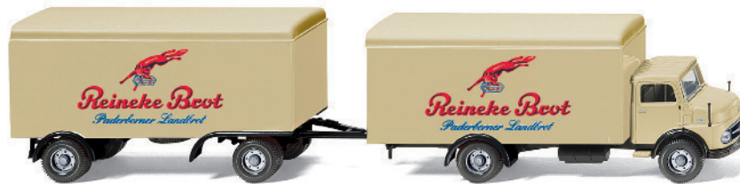
0852 40 40 Koffer-Lastzug (MB L 1113)