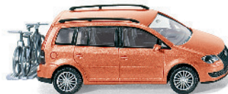
0305 38 31 VW Touran mit Fahrrädern