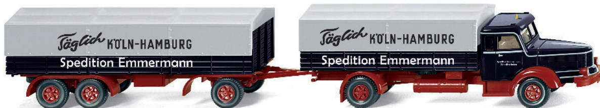
0891 06 40 Pritschen-Lastzug (Krupp Titan)