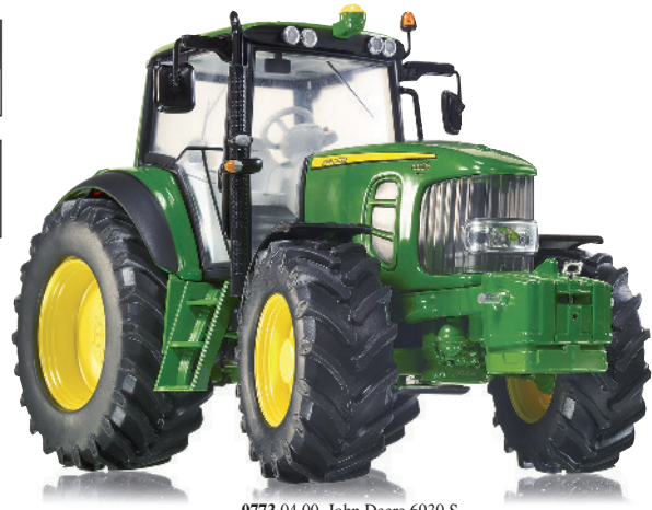
0773 04 00 John Deere 6930 S