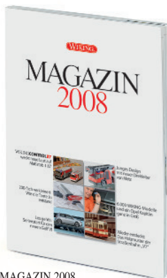
006 15 00 WIKING-MAGAZIN 2008

die schon vor über 40 Jahren im Programm der legendären Verkehrsmodelle präsent war. Und dann kommt auch noch