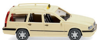
0800 12 Taxi - Volvo 850 Kombi UVP 9,99 €