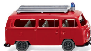
0861 29 Feuerwehr - VW T2 Bus UVP 9,49 €