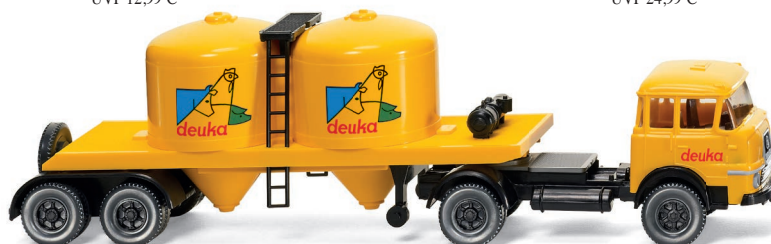
0534 02 Futtermittelsattelzug (Krupp) UVP 19,99 €

Die automobile Mischung macht's – WIKING stellt sie themenreich vor! Und diesmal sind es die revitalisierten Formen, die fast fünf Jahrzehnte nach ihrer Entstehung attraktive Neuheiten möglich machen. Das modellbauerische Spektrum der April-Auslieferung beeindruckt mit dem strahlend gelben Krupp, der als „Deuka“-Futtermittelsattelzug ländliche Sechziger-Jahre-Aura vermittelt. Der Borgward Bus B611 hat sich im feinen Finishing und mit