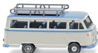
0270 98 Borgward Bus B611 UVP 12,99 €