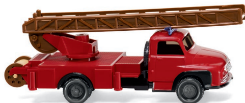
0620 01 Feuerwehr - Leiterwagen (Ford FK 2500) UVP 12,99 €