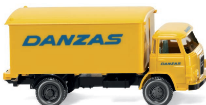
0540 04 Koffer-Lkw (MAN 415) UVP 12,99 €