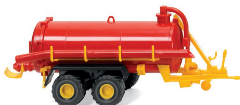
0382 02 Vakuumfasswagen UVP 7,99 €