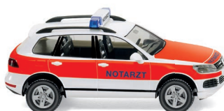
0071 18 Notarzt - VW Touareg UVP 15,49 €