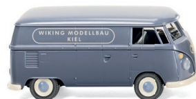
Modelle Set „VW T1“