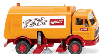
0642 05 Straßenkehrwagen (MB) UVP 13,49 €