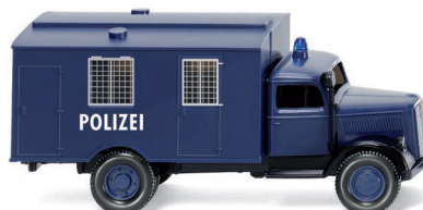
0864 35 Polizei - Gefangenentransport (Opel Blitz) UVP 12,99 €