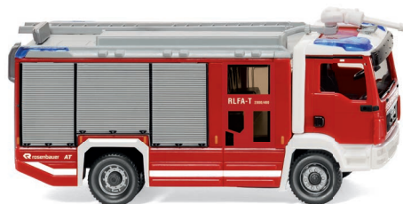
0612 48 Feuerwehr - Rosenbauer AT RLFA-T (MAN TGM) UVP 24,99 €