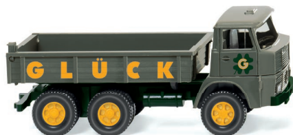
0424 03 Flachpritschenkipper (Henschel) UVP 12,99 €