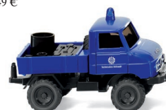
0693 24 THW - Unimog U 411 UVP 9,99 €