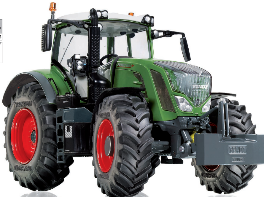
0773 45 Fendt 828 Vario (2014) · UVP 59,95 €