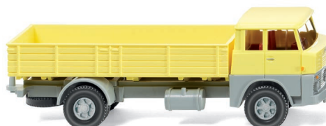
0412 01 Pritschen-Lkw (Henschel HS 14/16) UVP 13,49 €