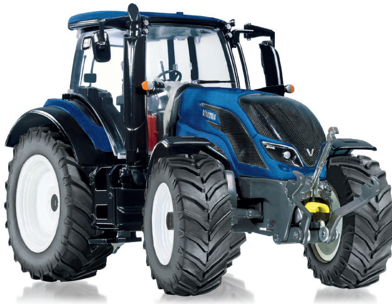
0778 14 Valtra T214 · UVP 59,95 €