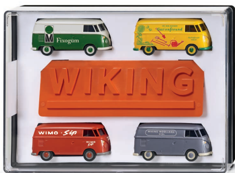
2170 01 Geschenkpackung -VW T1 UVP 49,99 €