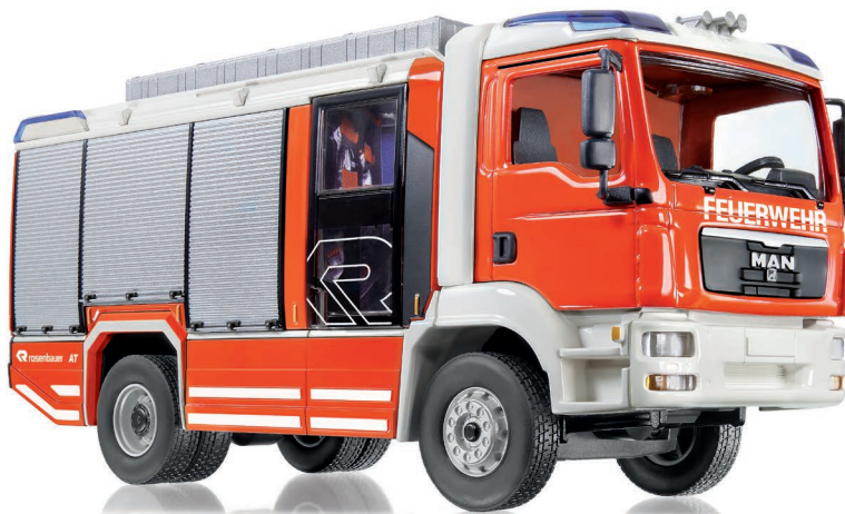
0431 42 Feuerwehr - Rosenbauer AT (MAN TGM) · UVP 59,95 €