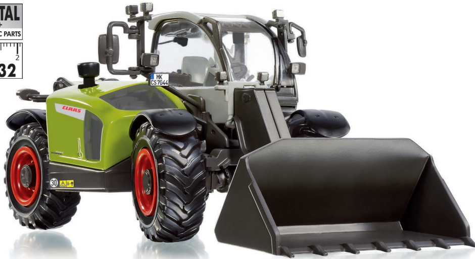
0773 47 Claas Scorpion 7044 Teleskoplader · UVP 64,95 €