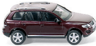
060 40 30 VW Touareg