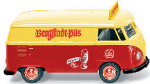
797 02 31 VW T1 mit Dachschild