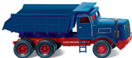
866 38 33 Muldenkipper (Kaelble)