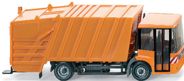
638 03 34 Pressmüllwagen (MB Eonic Facelift)