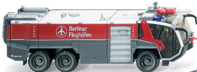
626 02 46 Feuerwehr – FLF Panther 6x6 (Rosenbauer)