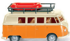
797 38 28 VW T1 mit Schlauchboot