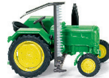
882 01 25 John Deere 2016