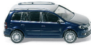
305 40 30 VW Touran