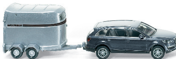
066 03 41 Audi Q7 mit Pferdeanhänger