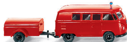
861 13 29 Feuerwehr – VW T1 mit Anhänger