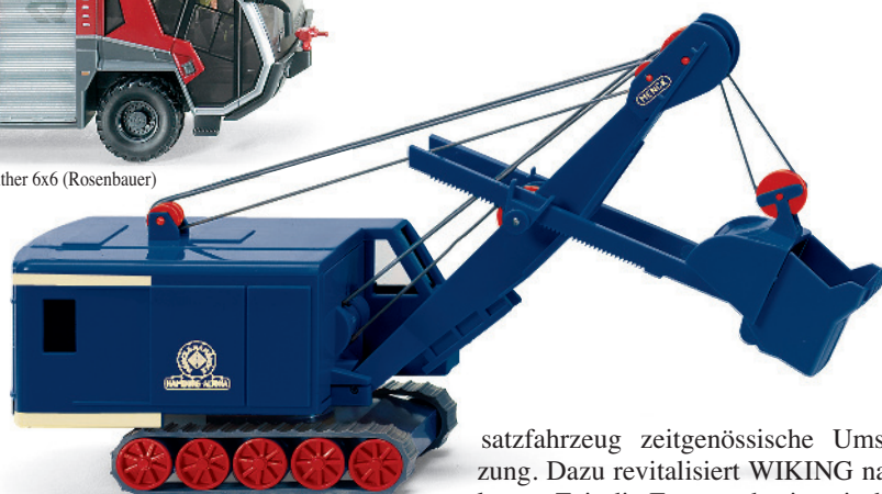
897 03 37 Menck-Bagger

Die Berliner Flughäfen sind stolz auf ihre neue Generation von Flugfeldlöschfahrzeugen – und WIKING miniaturisiert als Pendant dazu den Rosenbauer Panther 6x6 in 1:87. Die Modellpflege nimmt sich im April der Farbaktualisierung zahlreicher topaktueller Pkw von VW bis Mercedes an. Im Mittelpunkt steht zweifellos das imposante Gespann des Audi Q7 mit Pferdeanhänger. Zugleich