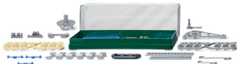
0018 07 Zubehörpackung - Feuerwehr