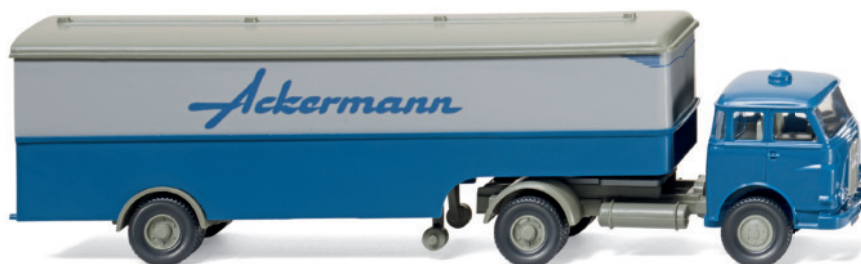
0513 17 Koffersattelzug (MAN Pausbacke)

Die 1970er-Jahre erleben mit der April-Auslieferung ihren modellbauerischen WIKING-Frühling: Mit dem roten Manta GT/E und dem miamiblaunen Audi 50 fahren zwei Youngtimer ins Programm – beide imponieren durch feinste Detailminiaturisierungen. Das zeitgenössische Trio ergänzt der silberne VW Golf I Cabrio, der damals an die lange Karman-Ära des Käfer-Cabrios anknüpfte. Ein Jahrzehnt früher unterwegs waren