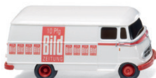
0265 01 Lieferwagen (MB L 319)