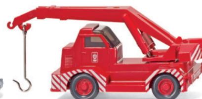
0680 01 Mobilkran (Demag)