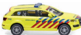
0071 17 Notarzt Niederlande - Audi Q7