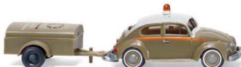
0030 01 VW Käfer 1200 mit Einachsanhänger