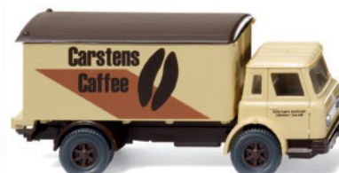
0446 02 Koffer-Lkw (International Harvester)