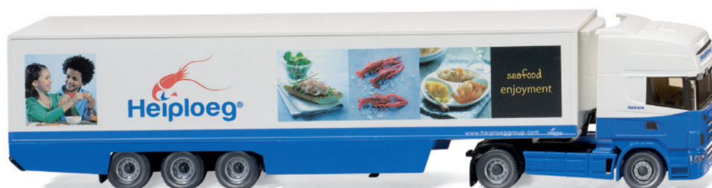
0528 05 Kühlkoffersattelzug (Scania R420 Topline)

W IKING überzeugt mit Themenvielfalt: Der Audi Q7 rettet Menschenleben – das Vorbild der April-Neuheit ist als Notarztfahrzeug in den Niederlanden unterwegs. Genauso topaktuell, aber europaweit im Langstreckeneinsatz ist hingegen der Kühlkoffersattelzug mit der Zugmaschine des Scania R420 Topline. Nostalgische Gefühle erwachen mit dem revitalisierten Hanomag-Henschel als Tiefladesattelzug und dem International Harvester Loadstar, der als Koffer-Lkw debütiert. Hinzu kommen der kompakte Fiat 600 – jetzt