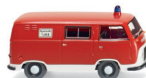
0861 22 Feuerwehr - Ford FK 1000 Kastenwagen