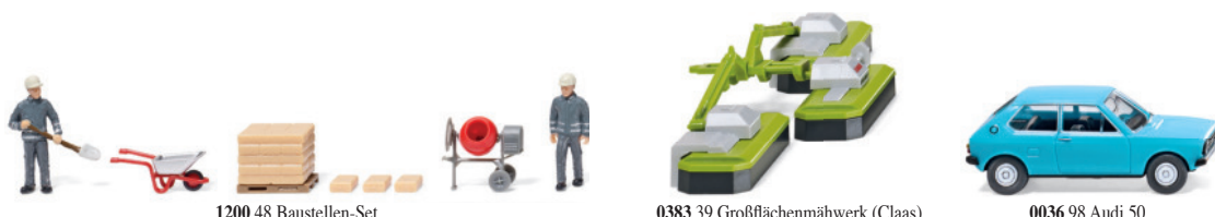
1200 48 Baustellen-Set