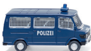
0864 31 Polizei - Bus (MB 207 D)