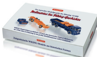
0990 93 Set "Büssing 12.000" UVP 35,99 €

L ebendige Historie in 1:87 erleben! Viele Kilometer war der Büssing 12.000 in den frühen 1950er-Jahren in den Firmenfarben der Braunschweiger Lkw-Schmiede unterwegs, um das Fahrverhalten im Fernverkehr zu testen. Jetzt widmet WIKING dem historischen Testwagen in einmaliger Auslieferung eine Themen-Edition, die zusätzlich das damals einzeln an die Aufbauhersteller ausgelieferte Fahrgestell sowie entsprechende Büssing-Ballastgewichte für den Testwagen bereitstellt. Ergänzend dazu ist ein farblich passendes Ladegut-Set erhältlich. Darüber hinaus gelingt WIKING der zeitgenössische Brücken-