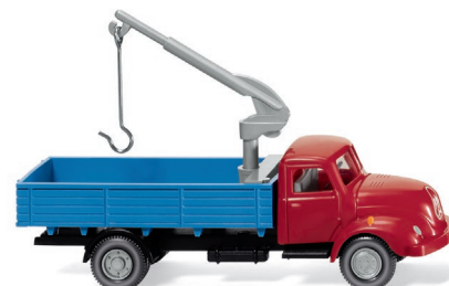
0420 02 Pritschen-Lkw mit Ladekran (Magirus S 3500) UVP 13,99 €