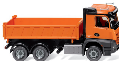
0678 48 Dreiseitenkipper (MB Arocs) UVP 29,99 €