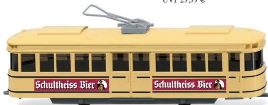
0750 01 Straßenbahn-Triebwagen UVP 14,99 €