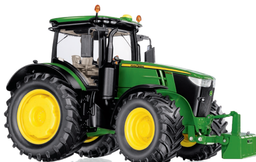
0778 37 John Deere 7310R UVP 84,95 €