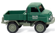
0371 07 Unimog U 411 UVP 10,99 €