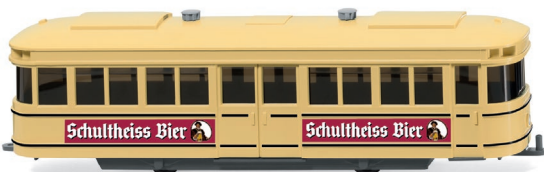
0749 01 Straßenbahn-Anhänger UVP 14,99 €