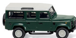
0102 02 Land Rover Defender 110 UVP 16,99 €