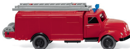
0610 02 Feuerwehr – Spritzenwagen (Magirus S 3500) UVP 13,49 €