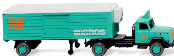
0520 03 Kühlkoffersattelzug (Magirus) UVP 19,99 €