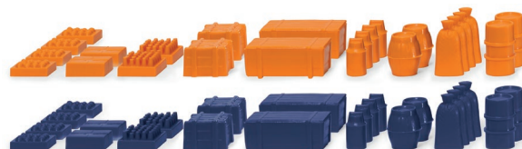
0018 20 Zubehörpackung - Ladegut II UVP 6,99 €