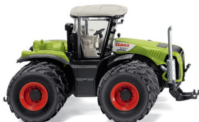
0363 98 Claas Xerion 5000 mit Zwillingsbereifung UVP 18,99 €