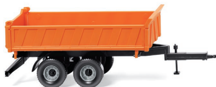
0678 04 Dreiseiten-Kipphanhänger UVP 12,99 €