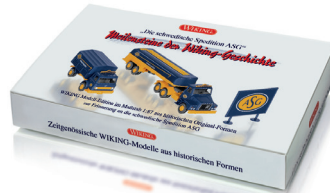
0990 92 Set "ASG" UVP 39,99 €

WIKING weiß, was Modellfreunde lieben! Und dazu zählt zweifellos das Speditionsthema des schwedischen Großlogistikers ASG. Ihm widmen die Traditionsmodellbauer eine Themen-Edition, die jeden Speditionshof zu bereichern weiß. Dazu zählen der International Harvester ebenso wie der Volvo Hauber als Tankauflieger sowie als I-Tüpfelchen eine zugehörige Speditionstafel in Markenfarben. Darüber hinaus hält die Modellpflege zum Jahresausklang alles bereit, was das Klassiker-Herz pulsieren lässt. Der 2-türige Volvo Amazon zeigt ebenfalls schwedisches Flair und der VW T1 fährt in Farben von Jacobs Kaffee ins Programm. Außerdem erinnern der Jeep-