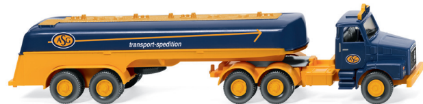
Bestandteile Set "ASG"