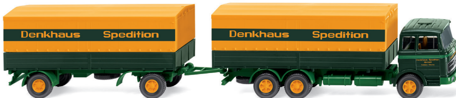
0456 01 Pritschenhängerzug (MB 2223) UVP 21,99 €