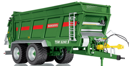
0778 35 Bergmann Universalstreuer TSW 6240 S UVP 99,95 €