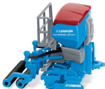
0378 11 Lemken Bestellkombination Solitair/Zirkon UVP 14,99 €