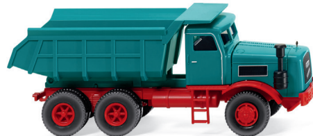
0866 34 Muldenkipper (Kaelble) UVP 17,99 €