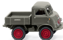
0368 01 Unimog U 401 UVP 16,99 €