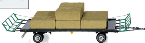
0778 31 Oehler Zweiachs-Ballentransportwagen ZDK 120 B UVP 59,95 €