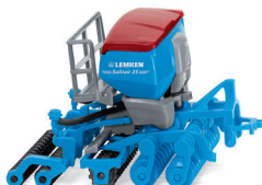
0378 19 Lemken Bestellkombination Solitair/Heliodor UVP 14,99 €