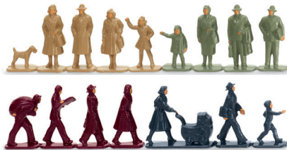
0018 17 Zubehörpackung – Personengruppen UVP 7,99 €