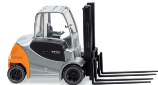
0663 61 Gabelstapler Still RX 60 UVP 13,99 €