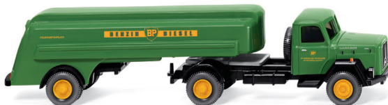
0800 48 Tanksattelzug (Magirus Saturn) UVP 17,99 €