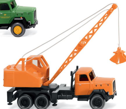
0662 03 Kommunal – Kranwagen (Magirus/Fuchs) UVP 25,99 €

Willkommene Neuheiten: Der dreiaxelige Magirus Eckhauber kann sich sehen lassen – er brilliert als multifunktionaler Bagger mit einst gerne genutztem Fuchs-Aufbau. Und auch als BP-Tanksattelzug erinnert das legendäre Saturn-Gespann an die große Zeit der luftgekühlten Ulmer Lkw. Mit dem Unimog U 401 schließt WIKING eine historische Lücke in der Reihe der einstigen Gaggenauer Alleskönner. Und zum Ausklang des Jahres, in dem Wiking-Modellbau seinen 85. Geburtstag gefeiert hat, kommt der sechste VW T1 (Typ 2) hinzu,