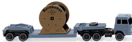
0949 39 Tiefladesattelzug (Hanomag Henschel) N-Spur 1:160 UVP 10,49 €