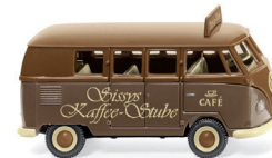
0788 08 VW T1 (Typ 2) Bus UVP 16,99 €