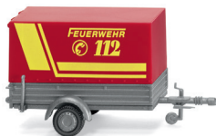
0056 05 Feuerwehr – Pkw-Anhänger UVP 9,99 €