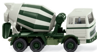
0682 03 Betonmischer (MB 1620) UVP 14,99 €