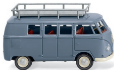
0788 10 VW T1 (Typ 2) Bus UVP 13,99 €