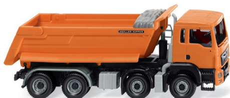
0674 48 Muldenkipper (MAN TGS Euro 6/Meiller) UVP 35,99 €