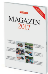
0006 24 WIKING-MAGAZIN 2017 UVP 11,00 €

WIKING bereitet Themenspaß: Der Muldenkipper-Neuheit stellen die Traditionsmodellbauer zeitgleich einen Meiller-Absetzkipper auf MAN TGS-Fahrgestell zur Seite – die topaktuelle Baustellenserie setzt reizvolle Akzente! Darüber hinaus wirft die Modellpflege einen nostalgischen Rückblick auf die zurückliegenden Jahrzehnte des Fahrzeugbaus. Allen voran der Hanomag WD, mit dem die frühe Motorisierung der Landwirtschaft begann. Außerdem gibt es ein Wiedersehen mit dem Mercedes-Benz 180 und dem DKW F 89. Der Volvo Amazon ergänzt die Modellpflege im neuen Farbauftritt. Im