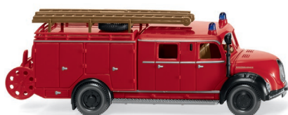
0863 99 Feuerwehr - LF 16 (Magirus) UVP 21,49 €