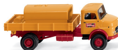
0438 02 Pritschenkipper mit Aufsatztank (MB LAK) UVP 16,99 €