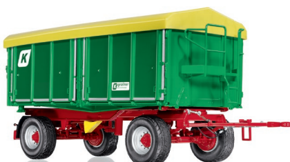
0778 27 Kröger Zweiachs-Dreiseitenkipper HKD 302 UVP 99,95 €