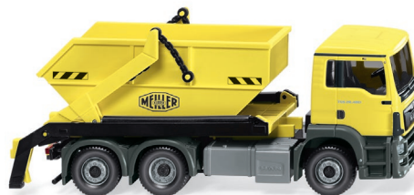
0679 06 Absetzkipper (MAN TGS Euro 6/Meiller) UVP 25,99 €