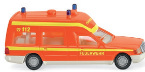
0607 01 Feuerwehr – Krankenwagen (MB Binz) UVP 14,99 €