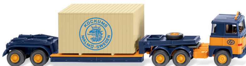
0503 04 Tiefladesattelzug (Scania 111) UVP 21,99 €

B erufsfeuerwehren hatten ihn während der 1960er-Jahre als Aushängeschild in ihr Herz geschlossen – jetzt stellt WIKING den legendären Magirus LF 16 vor. Vor allem die lange Gruppenkabine macht das charaktertragende Löschfahrzeug so imposant – hinzu kommen Steckleiterteile und Schiebeleiter auf dem Dach und die heckseitig angebrachte Schlauchhaspel. Und weil in der Feuerwehrhistorie ein Magirus-Rundhauber nie alleine kommt, lässt WIKING zugleich einen Mehrzweck-Lkw ebenfalls mit Alligator-Haube vorfahren. Als weitere