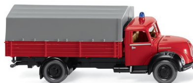
0861 43 Feuerwehr - Pritschen-Lkw (Magirus) UVP 17,99 €