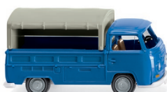
0316 03 VW T2 Pritsche UVP 9,99 €