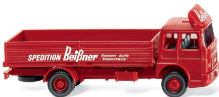
0519 02 Wechsellpritschen-Lkw (MAN) UVP 14,99 €