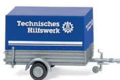
0056 04 THW - Pkw-Anhänger UVP 9,99 €