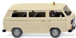
0800 14 Taxi – VW T3 Bus UVP 10,99 €