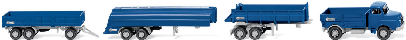
Bestandteile Set "Blumhardt"