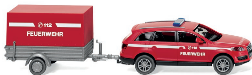
0133 07 Feuerwehr – Audi Q7 mit Anhänger UVP 19,99 €