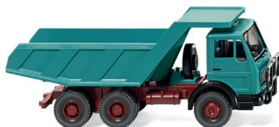
0671 05 Muldenkipper (MB NG) UVP 13,99 €