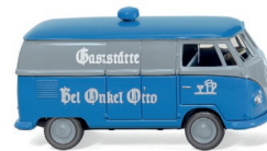
0788 04 VW T1 (Typ 2) Kastenwagen UVP 16,99 €