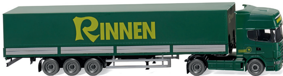
0518 04 Pritschensattelzug (Scania R 420 Topline) UVP 28,99 €