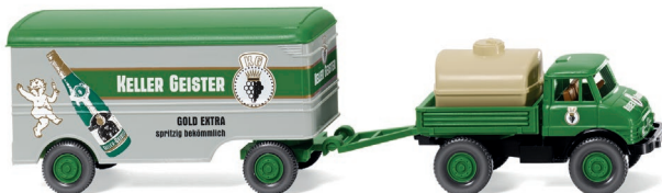
0371 06 Unimog U 406 mit Koffernhänger UVP 19,99 €