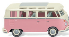
0797 20 VW T1 Sambabus UVP 16,99 €