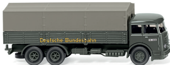
0479 02 Pritschen-Lkw (Büssing 12.000) UVP 23,99 €