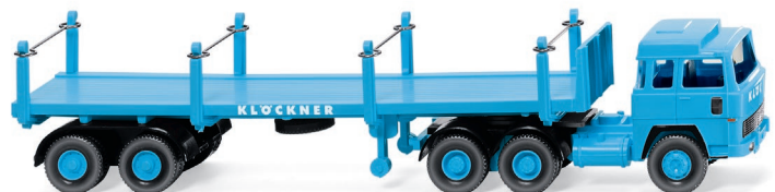
0518 46 Rungensattelzug (Magirus 235 D) UVP 19,99 €