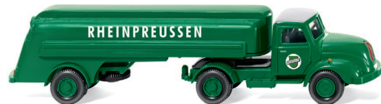
0800 49 Tanksattelzug (Magirus S 3500) UVP 17,99 €