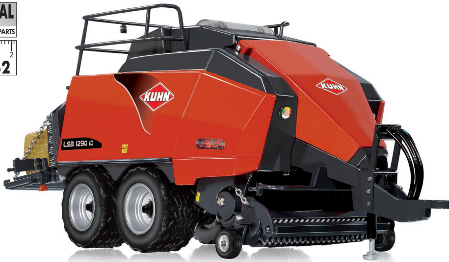
0778 19 Kuhn Großpackenpresse LSB 1290 iD · UVP 89,95 €