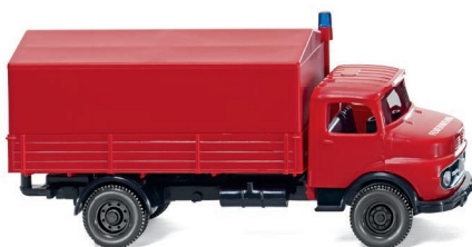
0861 34 Feuerwehr - Pritschen-Lkw (MB Kurzhauber) UVP 12,49 €