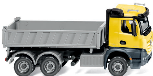
0678 49 Dreiseitenkipper (MB Arocs) UVP 26,99 €