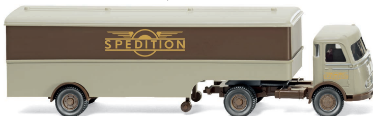
0513 20 Koffersattelzug (MB Pullman) UVP 19,99 €