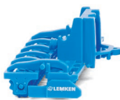
0378 10 Lemken Kreiselege Zirkon 12 UVP 6,99 €