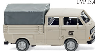
0293 04 VW T3 Doppelkabine UVP 11,99 €