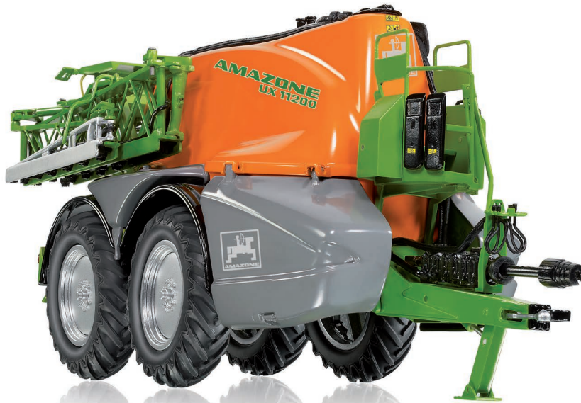
0773 46 Amazone Feldspritze UX 11200 · UVP 99,95 €

Auch im Modell ein Superlativ: Die Amazone UX 11200 zeigt die Dimensionen einer imposanten 12.000 Liter-Spritze mit Tandemachse. Das Super-L-Gestänge ermöglicht in der modellbauerischen Arbeitsbreite die Darstellung der ganzen Leistungsfähigkeit des Vorbilds. Dazu tragen auch die breiten, abklappbaren Spritzenarme sowie das anheb- und absenk- und abklappbare Spritzgestell bei. Die Pumpenmimik ist filigranisiert nachgebildet, der Domdeckel an der Tankoberseite kann geöffnet werden.