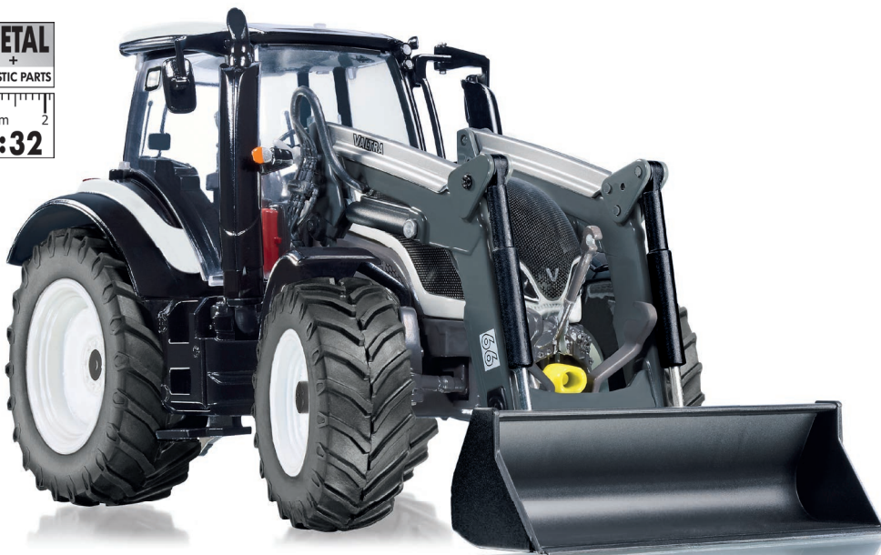
0778 15 Valtra T174 mit Frontlader · UVP 69,95 €