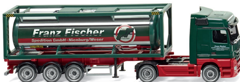
0536 03 Tankcontainersattelzug 30' (MB Actros) UVP 34,99 €

Die neue Baustellen-Generation von Mercedes-Benz ist da! Der Arocs mit seinem markanten Frontgrill in Baggerzahn-Optik aktualisiert das große WIKING-Traditionsthema – der Modell-Debütant stellt sich als attraktiver Dreiseitenkipper vor. Einen Blick zurück wirft hingegen der Mercedes-Benz Actros erstmals einen 30-Fuß-Tankcontainer eskortiert. Erin-