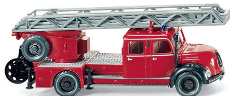
0862 34 Feuerwehr – Drehleiter (Magirus DL 25h) UVP 21,49 €