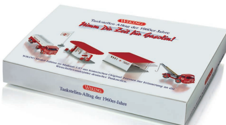
0990 89 Set "Tankstelle Gasolin" UVP 49,99 €

Zur individuellen Nachrüstung können WIKING-Freunde jetzt auch auf ein Lkw-Räder-Set zurückgreifen, u.a. mit den beliebten Trilixfelgen. Wirkliche WIKING-Kenner wissen Modelle mit "Flügelrad"-Spedition zu schätzen, denn Koffer-Lkw Modelle erschienen bereits vor fünf Jahrzehnten in dieser Gestaltung, die sich großer Beliebtheit erfreuten. Wunderschöne Klassiker in zeitgenössischen Farben stehen überdies im Mittelpunkt der Dezember-Modellpflege. Dazu zählen der eisengraue Mercedes-Benz 220 S und der perlweiße DKW Junior de Luxe mit grauem Dach, aber auch der NSU Ro 80, dessen aerody-