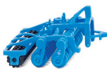
0378 20 Lemken Kurzscheibenegge Heliodor 9 UVP 6,99 €