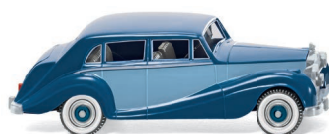
0838 03 Rolls Royce Silver Wraith UVP 13,49 €