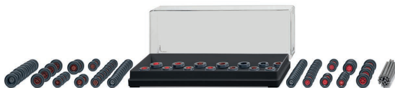
0018 15 Zubehörpackung - Lkw-Räder UVP 11,99 €