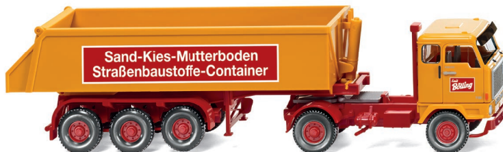
0676 06 Hinterkippersattelzug (Volvo F89) UVP 18,99 €