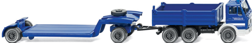
0693 26 THW - Tiefladehängerzug (MB NG) UVP 18,99 €