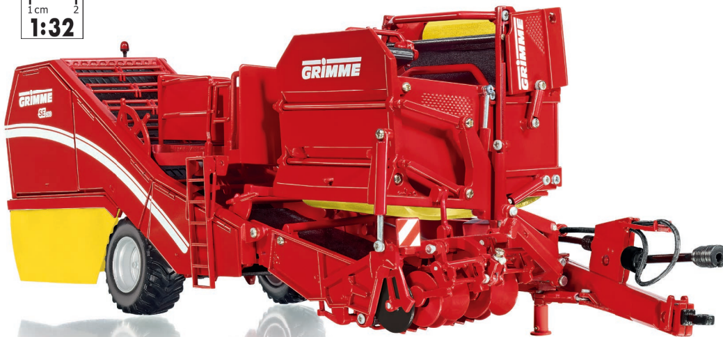
0778 16 Grimme Bunkerroller SE 260 · UVP 139,95 €

Mit dem seitlich gezogenen Grimme SE 260 miniaturisiert WIKING erstmals einen Bunkerroller im Maßstab 1:32. Das WIKING-Modell verfügt für den seitlich gezogenen Schleppereinsatz über eine schwenkbare Deichsel und eine gefederte Pendelachse. Große modellbauerische Detailqualität verbirgt sich unter der roten Grimme-Verkleidung – der Blick ins Maschineninnere fasziniert.