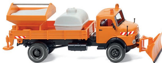
0646 07 Winterdienst - Pritschenkipper (MB LAK) UVP 19,99 €